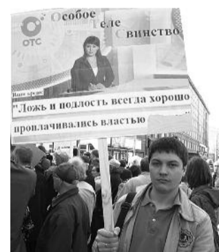
● НА ФОТО: МОЖЕТ ЛИ КАНАЛ ОТС ИЗМЕНИТЬ СВОЮ ПОЛИТИКУ?