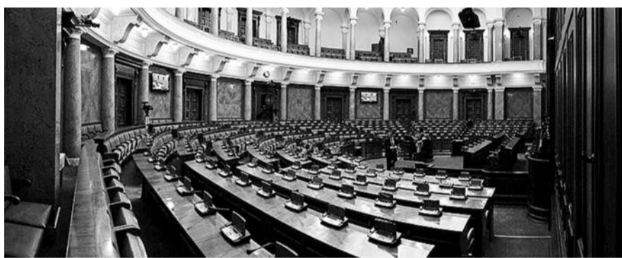
● НА ФОТО: КОМПАРТИЯ СЕРБИИ МОЖЕТ ВЕРНУТЬСЯ В ОРГАНЫ ВЛАСТИ СТРАНЫ

Что касается представительства партий в парламенте, то, как полагают местные