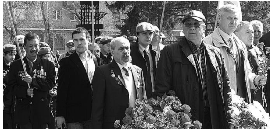
● НА ФОТО: В НАРЫМСКОМ СКВЕРЕ ПОЧТИЛИ ПАМЯТЬ ЖЕРТВ РАДИАЦИОННЫХ КАТАСТРОФ

В Нарымский сквер пришли и чиновники из областной и городской администраций. Чернобыльцы говорили представителям власти, что ликвидаторам не хватает федеральных льгот. Положенное по закону жилье получают немногие, пособие, выплачиваемое им, настолько мизерное, что его едва хватает на лекарства.