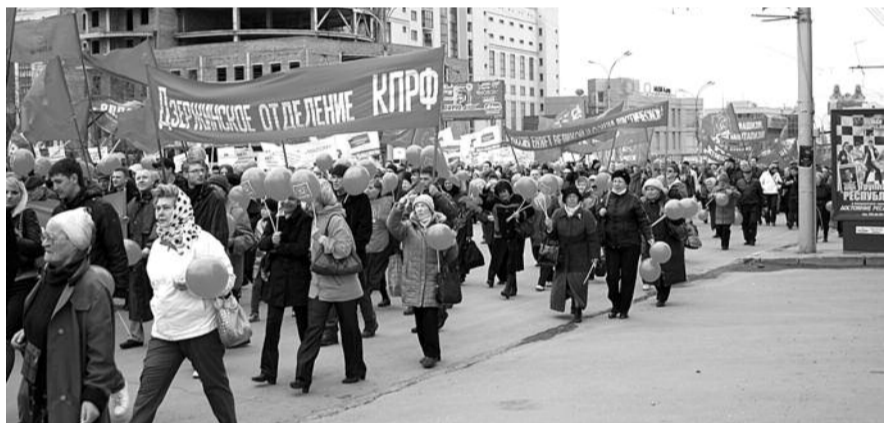
● НА ФОТО: В ШЕСТВИИ И МИТИНГЕ ПРИНЯЛО УЧАСТИЕ ОКОЛО 4 ТЫСЯЧ НОВОСИБИРСЦЕВ

здоровались, поздравляли друг друга со значимым праздником, обсуждали последние события и «инициативы» власти. К началу движения колонну составили коммунисты, гражданские активисты из движения «За честные выборы!», представители ЛДПР, «Справедливой России», «Патриоты», различные общественные организации и объединения. Среди участников оказались даже продавцы-киоскеры. В голове колонны двигался автомобиль с мощной акустикой, из которой раздавались советские песни и первомайские лозунги. Перед колонной вышагивало несколько мальчишек-кадетов в форме. Колонна оказалась столь длинной, что звуковое оборудование с автомобиля «не дотягивалось» даже до ее середины. Впрочем, это людей не смущало, даже наоборот, давало простор для творчества — демонстранты сами придумывали и выкрикивали лозунги, которые тут же поддерживали шедшие рядом товарищи. Чаше других звучали лозунги против создания базы НАТО в Ульяновске и вхождения в страны во Всемирную торговую организацию, которая задушит остатки промышленности и сельского хозяйства.