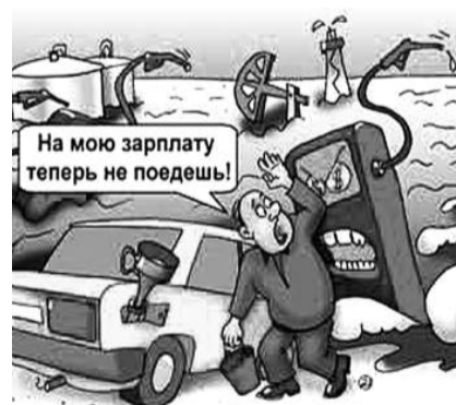
● НА РИС.: СТАНУТ БОЛЬШЕ ХОДИТЬ ПЕШКОМ

ные кредиты, наращивая производственные мощности. Например, как сообщили «Московские новости», Антипинский НПЗ, расположенный в Тюмени, привлекает зарубежный кредит на сумму 750