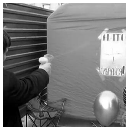
● НА ФОТО: УЧАСТНИКИ АКЦИИ РАССТРЕЛЯЛИ НАТО ИЗ ВОДНЫХ ПИСТОЛЕТОВ

— Мы против буржуазной власти, сидящей в Кремле, и ее людоедской политики, мы против ущерба суверенитету нашей