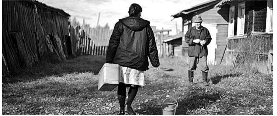
● НА ФОТО: ПОСЛЕ «МОДЕРНИЗАЦИИ» ДОКТОР В ДЕРЕВНЕ — БОЛЬШАЯ РЕДКОСТЬ

то есть. Но бассейн для определенных слоев населения, деревенские жители туда не поедут. В штатном расписании Бобровской больницы сократили только ночную санитарку, а остальные ставки все заняты. Тем более, надо иметь палату для тяжелобольных, чтобы на ночь могли прийти родственники. Об этом не подумали. А я попыталась без направления поехать в Сузун в больницу, терапевт на приеме сказала: «У вас в Бобровке есть свои врачи, там и лечитесь». Лечебный круг для меня замкнулся.