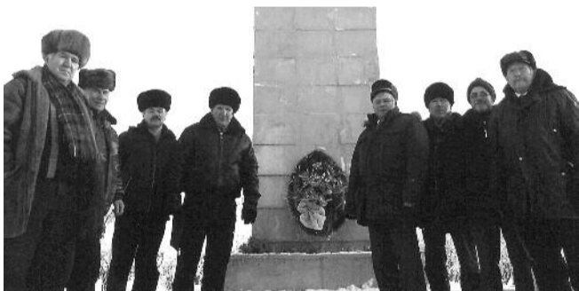
● НА ФОТО: КОЛЫВАНСКИЕ КОММУНИСТЫ У ПАМЯТНИКА ЛЕНИНУ

22 апреля прошел V пленум районного комитета Колыванского местного отделения КПРФ, на котором обсуждались итоги выборов в Государственную думу и Президента РФ.