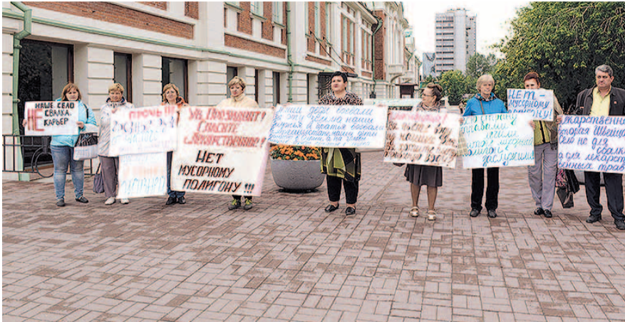
НА ФОТО: ЖИТЕЛИ СЕЛА ВЫШЛИ НА ПИКЕТ В ЦЕНТРЕ НОВОСИБИРСКА

28 августа в центре Ново-сибирска жители села Лекарственное Тогучинского района провели пикет против строительства мусорного полигона. Сейчас судьба села находится в руках жителей — от них отвернулись глава района и многие депутаты. Говорят, что власти приступят к обсуждению проблемы только после выборов губернатора.