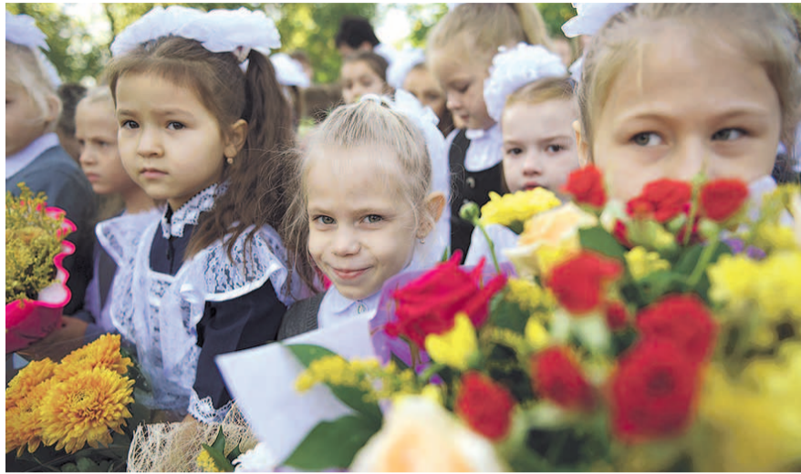
НА ФОТО: ПЕРВЫЙ РАЗ В ПЕРВЫЙ КЛАСС!

— К началу учебного года мы открываем три образовательные организации. Одна из них — коррекционная школа №37 на 220 мест, в которой установлено уникальнейшее радио-оборудование,