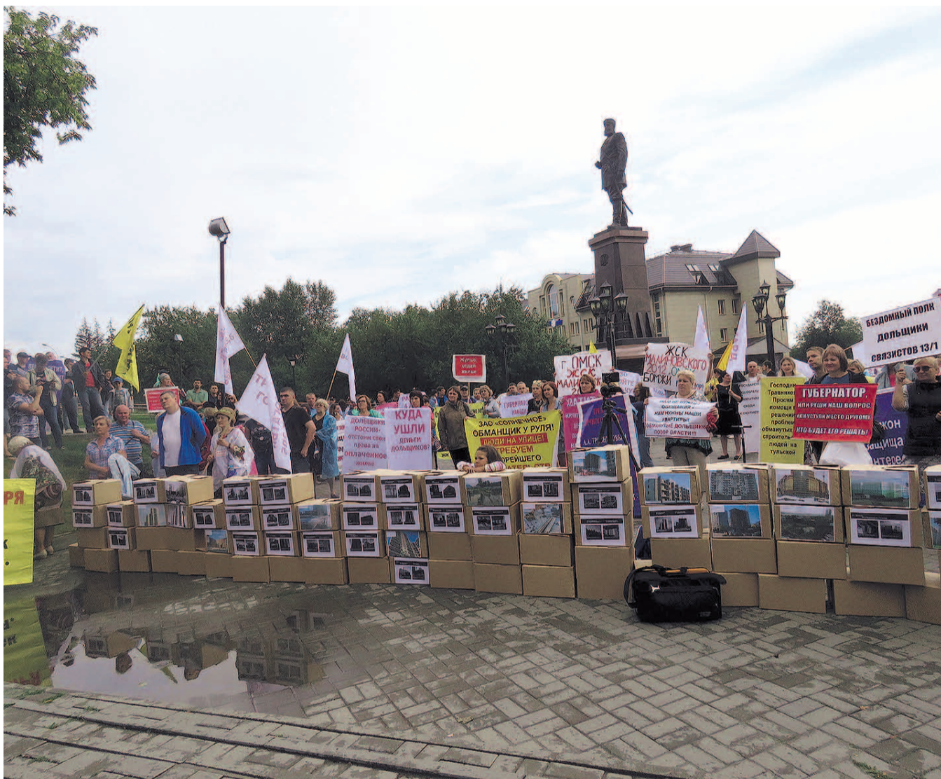
НА ФОТО: НА ФОТОГРАФИЯХ БОЛЕЕ 50 ДОЛГОСТРОЕВ, ЭТО — ТЫСЯЧИ СЕМЕЙ БЕЗ ЖИЛЬЯ