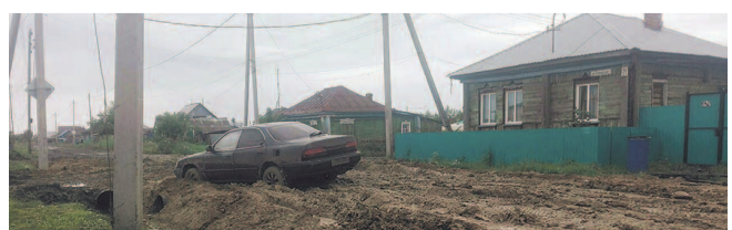
НА ФОТО: АВТОМОБИЛЬНАЯ ДОРОГА В БАРАБИНСКЕ