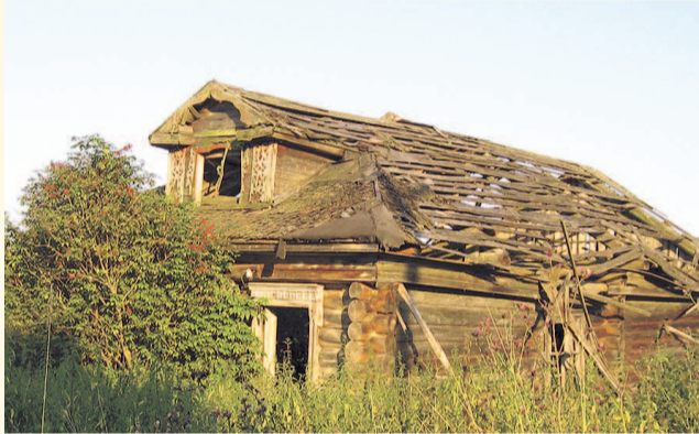
НА ФОТО: РЕГИОН ПОСТЕПЕННО ВЫМИРАЕТ