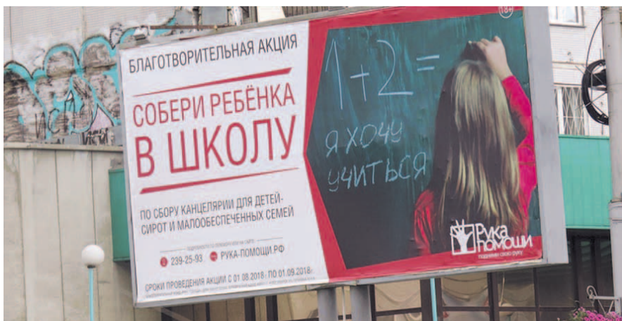
НА ФОТО: ШКОЛА НАЧИНАЕТСЯ С КРЕДИТА!