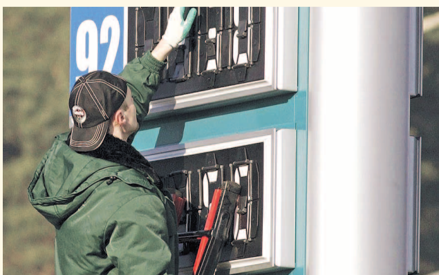
НА ФОТО: ЕСТЬ ТАКАЯ ПРОФЕССИЯ — ЦЕННИКИ ПЕРЕПИСЫВАТЬ...