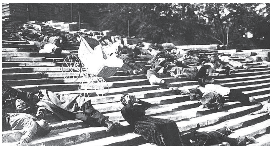
НА ФОТО: «БРОНЕНОСЕЦ ПОТЕМКИН»: РАССТРЕЛ МИРНЫХ ЖИТЕЛЕЙ НА ПОТЕМКИНСКОЙ ЛЕСТНИЦЕ

Ещё одно подтверждение: опрос ведущих кинематографов из 25 стран, проведённый в 1958 году Бельгийской синематекой. 110 специалистов из 117 назвали лучшим фильмом всех времён и народов «Броненосец «Потёмкин» Сергея ЭЙЗЕНШТЕЙНА . В десятку лучших по итогам опроса вошли также «Мать» Всеволода ПУДОВКИНА (по ГОРЬКОМУ ) и «Земля» Александра ДОВЖЕНКО .