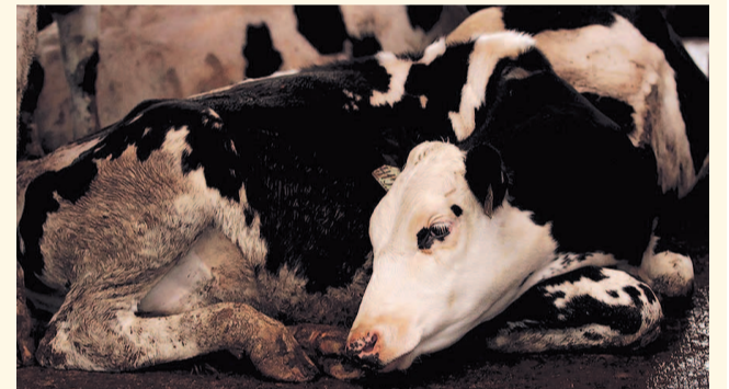
НА ФОТО: ЗАБОЛЕВАНИЕ СКОТА ВЕДЕТ К ЭКОНОМИЧЕСКИМ ПОТЕРЯМ