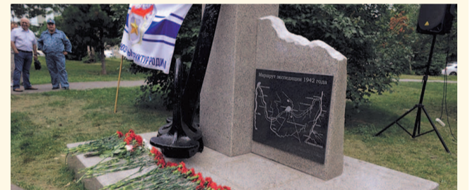
НА ФОТО: ПАМЯТЬ ЖИВА В СЕРДЦАХ ПОТОМКОВ