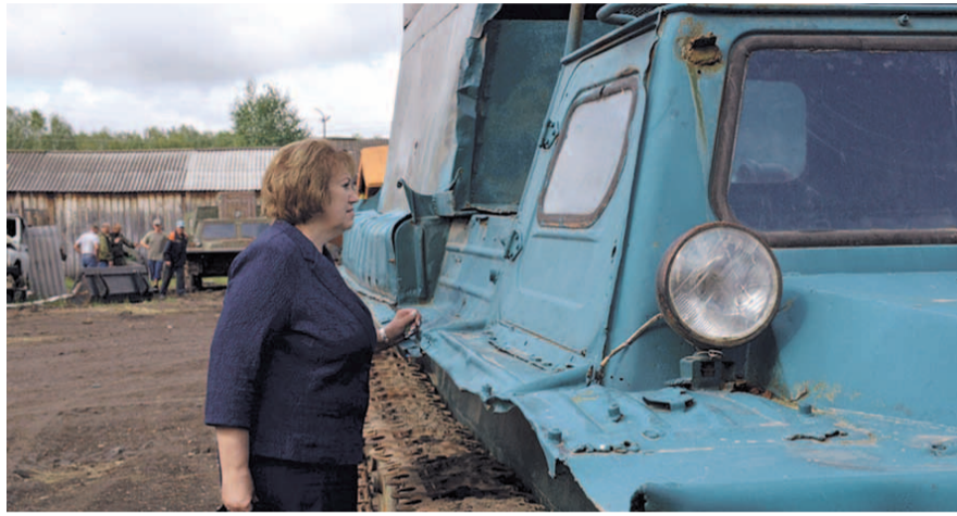
НА ФОТО: ТЕХНИКИ ПОЧТИ НЕ ОСТАЛОСЬ, А ТА, ЧТО ЕСТЬ, ДЫШИТ НА ЛАДАН