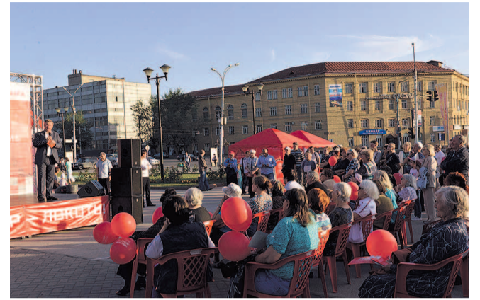
НА ФОТО: НА ВСТРЕЧЕ ОБСУДИЛИ ВАЖНЫЕ ВОПРОСЫ

— Перед нами стоит важная задача — вдохнуть вторую жизнь в Академгородок.