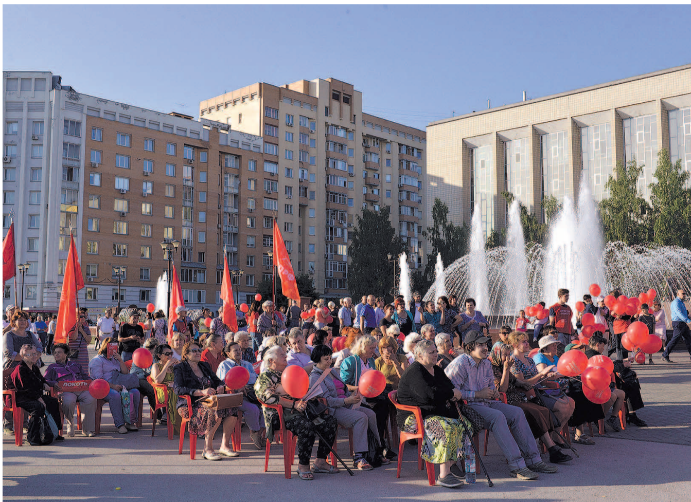
НА ФОТО: ЛЮДИ ПРИШЛИ НА ВСТРЕЧУ, ЧТОБЫ УЗНАТЬ О ТОМ, КАКИЕ ПРОБЛЕМЫ ГОРОДА БУДУТ РЕШАТЬСЯ В СЛЕДУЮЩИЕ ПЯТЬ ЛЕТ