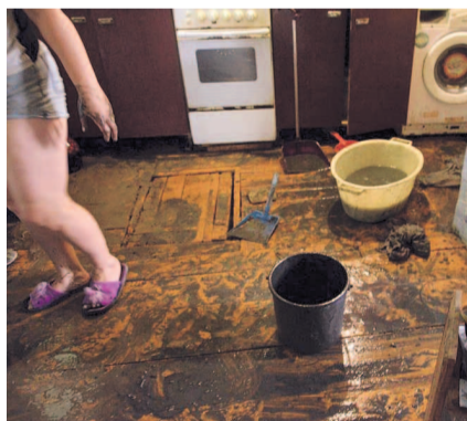
НА ФОТО: ВАШИ ПРОБЛЕМЫ ВАМ И УБИРАТЬ

— Мы получили жилье в этом доме чуть более пяти лет назад. И практически сразу же столкнулись с проблемой канализации. За это время куда мы только не обращались, но, как правило, на все жалобы получали только отписки, — сообщила жительница.