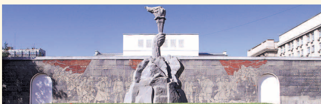
НА ФОТО: СКВЕР ПРИВЕДУТ В ПОРЯДОК