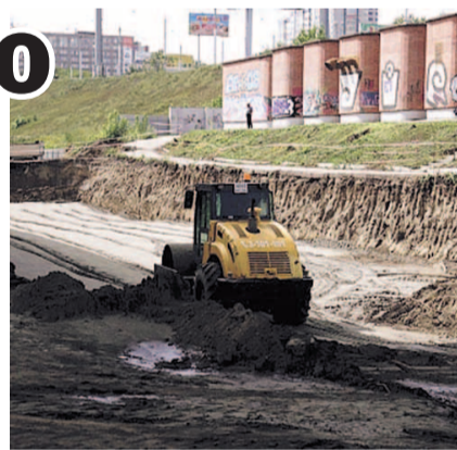
НА ФОТО: СТРОИТЕЛЬСТВО «СПОРТИВНОЙ»

— К концу сентября по итогам конкурсных процедур определим генподрядчика. И затем уже он представит графики, очередность работ: заливка фундамента, установка основных конструкций эстакады. Я дал поручение — обеспечить видеоконтроль на территории строительства. Здесь будут