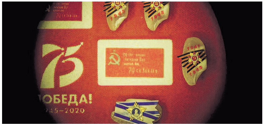
НА ФОТО: МИНИАТЮРЫ РАЗМЕРОМ В НЕСКОЛЬКО МИЛЛИМЕТРОВ

Кроме того, он закончил работу над копиями Знамени Победы. Ему удалось получить несколько нитей, снятых с официальной копии Знамени Победы, которое водрузили над рейхстагом 1 мая 1945 года, по специальному разрешению руководства Центрального музея Вооруженных Сил.