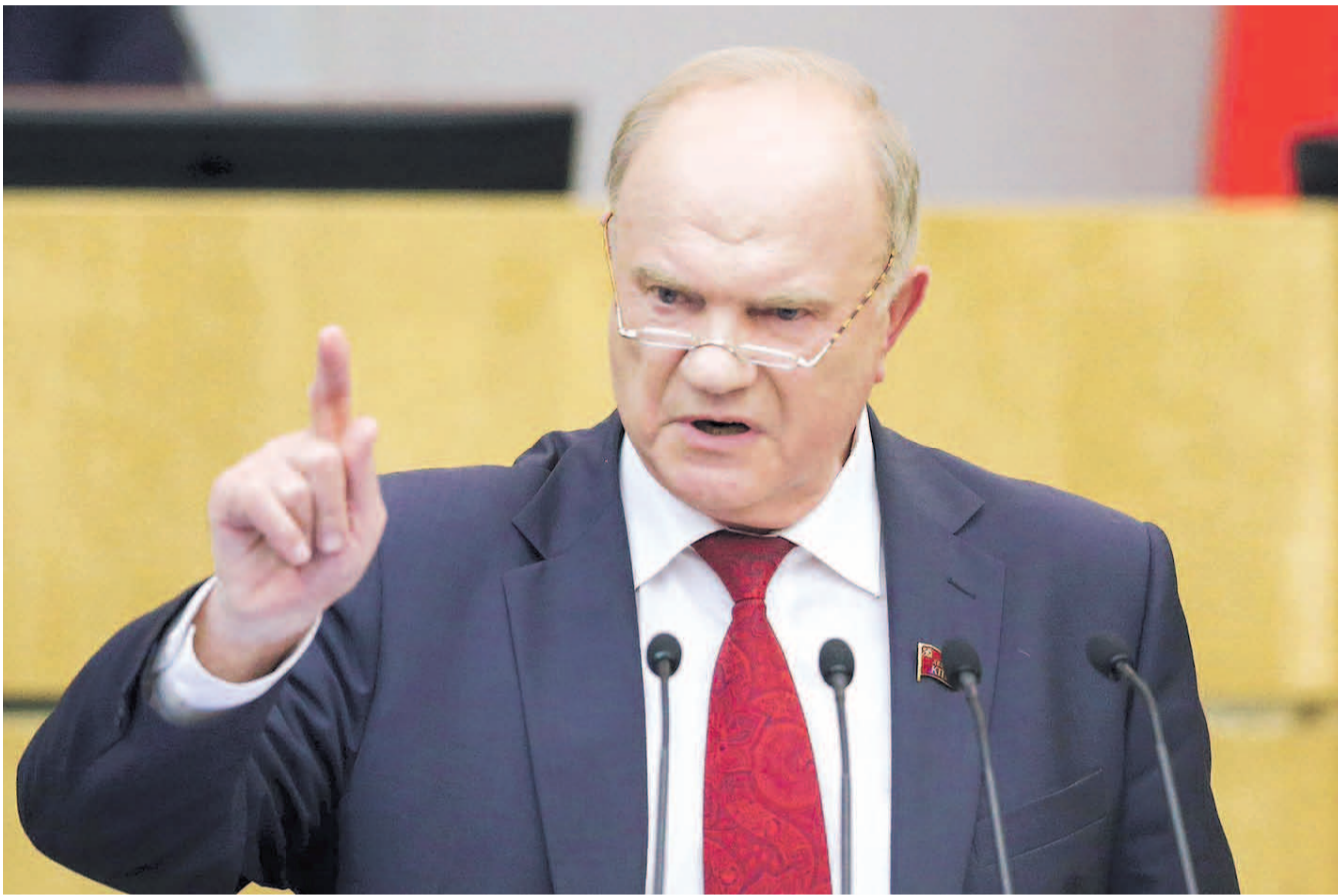
Г.А. ЗЮГАНОВ: «МЫ КАТЕГОРИЧЕСКИ ПРОТИВ ОСТАНОВКИ «РЕМОНТА» КОНСТИТУЦИИ. МЫ НАСТАИВАЕМ НА СВОИХ 15 КЛЮЧЕВЫХ ПОПРАВКАХ!»