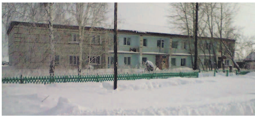
НА ФОТО: «БЛАГОУСТРОЕННЫЕ» КВАРТИРЫ НЕ МОГУТ ПРОДАТЬ ДАЖЕ ЗА 150000 РУБЛЕЙ

— Когда мы подписывали документы, мне пихали бумаги еще до просмотра квартиры. Я была сонная с дороги и подписывала все это, считай, не глядя. Меня сперва прописали в паспорте, а потом уже показали квартиру. Я была в шоке: повсюду окурки, пустые бутылки, мусор, ванная грязная ужасно,