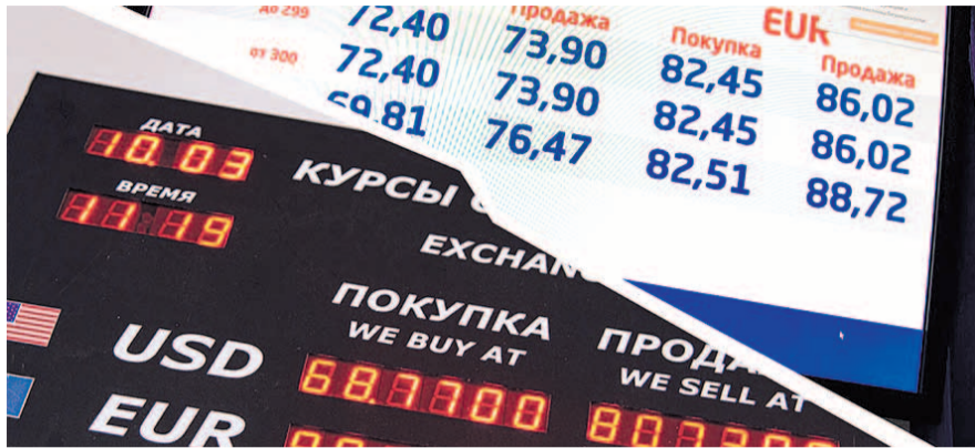
НА ФОТО: ГРАЖДАНЕ, ВЫ УСПЕЛИ ЗАПАСТИСЬ ДОЛЛАРАМИ?

— Ущербная экономика сырьевого капитализма, криво скроенная по либеральным лекалам, не дает нашей стране вырваться из плена нефтяной зависимости и начать поступательно развиваться. Поэтому нам нужно наращивать добычу, инвестировать средства в развитие отрасли, разработку новых месторождений. А вырученные средства направлять в производство, инфраструктуру и социальную сферу. Повторю то, что говорил летом 2019 года: мы, коммунисты, считаем необходимым развитие, прежде всего, несырьевых, наукоемких отраслей