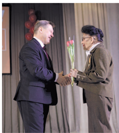
НА ФОТО: МЭР ПОЗДРАВИЛ ЖЕНЩИН

— Пылали страсти, были демонстрации и митинги. Этот праздник имел в своем прошлом ярко выраженный красный цвет. Только во времена Советской власти женщины получили возможность учиться, заниматься наукой, производством. Вспомним, как Софье КОВАЛЕВСКОЙ пришлось побороться, преодолеть в том числе семейные препоны, чтобы заниматься любимым делом — математикой. Сейчас это в прошлом, праздник стал