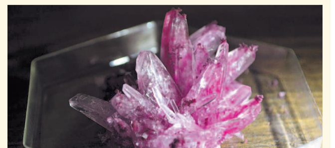
НА ФОТО: ИСКУССТВЕННО ВЫРАЩЕННЫЕ АЛМАЗЫ