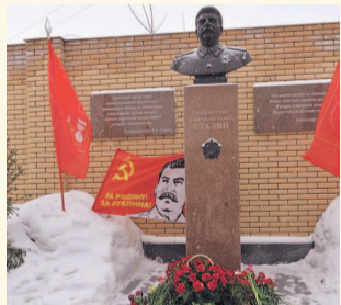
НА ФОТО: У БЮСТА СТАЛИНА

5 марта в день 67-й годовщины со дня смерти выдающегося политика, государственного, военного и партийного деятеля Иосифа Виссарионовича СТАЛИНА новосибирские коммунисты во главе с первым секретарем Новосибирского обкома, мэром Новосибирска Анатолием ЛОКОТ и секретарем по оргработе Алексеем РУСАКОВЫМ возложили цветы к бюсту вождя.