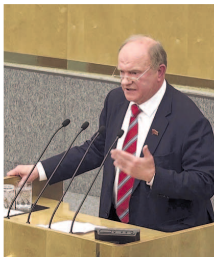
НА ФОТО: ГЕННАДИЙ ЗЮГАНОВ В ГОСДУМЕ

— Я обращаюсь к «Единой России». Мы хотели, чтобы вы услышали голос народа, потому что реформирование Конституции предполагает диалог. Мы предложили вам закон о национализации, который кардинально изменил бы социально-экономическую политику.