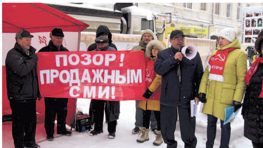
НА ФОТО: ГДЕ ИСКАТЬ ОБЪЕКТИВНУЮ И ПРАВДИВУЮ ИНФОРМАЦИЮ?

Кстати, я не знаю, в каком объеме и из каких источников поступают средства на существование районных газет, «Советской Сибири» и «Ведо-