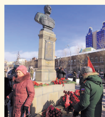
НА ФОТО: ЦВЕТЫ ПОКРЫШКИНУ

В мэрии Новосибирска рассказали, что, согласно плану, в Год памяти и славы на баннерах разместят информацию