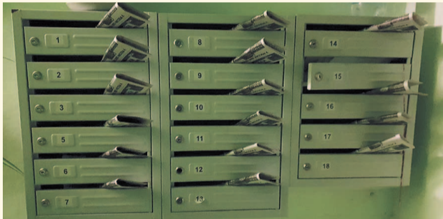
НА ФОТО: ГАЗЕТА ДОЙДЕТ ДО ЧИТАТЕЛЯ!