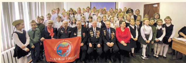
НА ФОТО: НА УРОКЕ МУЖЕСТВА