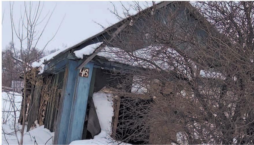
НА ФОТО: ЗАБРОШЕННЫЙ ДОМ В ПОЛОВИННОМ