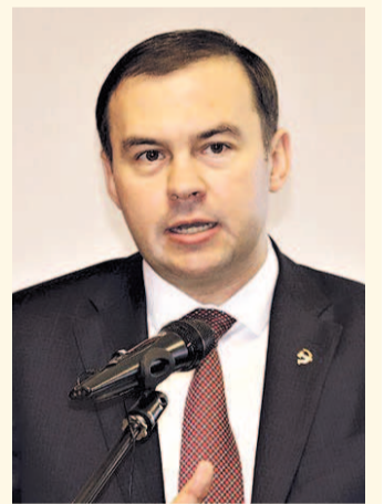
НА ФОТО: ЮРИЙ АФОНИН

Заместитель Председателя ЦК КПРФ, первый зампред Комитета Госдумы по природным ресурсам, собственности и земельным отношениям Юрий АФОНИН рассказал, что КПРФ сразу говорила о вредности и пагубности участия России в сделке ОПЕК+, которую «с настойчивостью, достойной лучшего применения, в свое время продвигали либералы из финансово-экономического блока правительства».