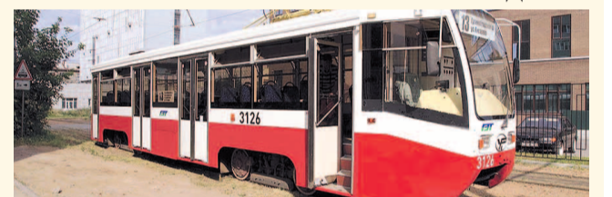
НА ФОТО: ОБНОВЛЕННЫЕ ТРАМВАИ ПОВЕЗУТ ГОРОЖАН