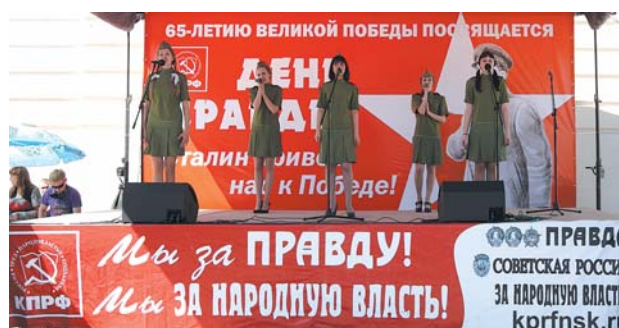
● НА ФОТО: НА ГЛАВНОЙ СЦЕНЕ ЗВУЧАЛИ ПАТРИОТИЧЕСКИЕ ПЕСНИ