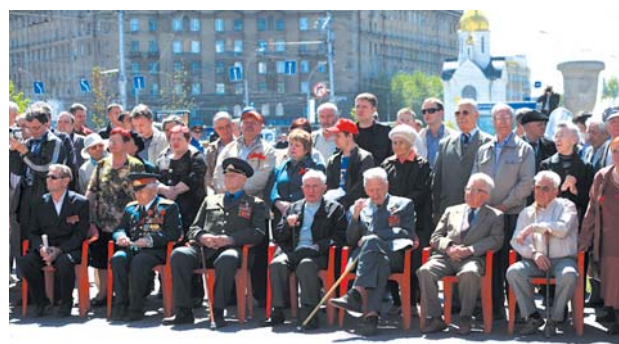
● НА ФОТО: ВЕТЕРАНЫ НА «ДНЕ ПРАВДЫ-2010» — В ПЕРВЫХ РЯДАХ