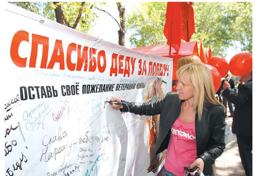
● НА ФОТО: БАННЕР ДЛЯ ПОЖЕЛАНИЙ ВЕТЕРАНАМ «СПАСИБО ДЕДУ ЗА ПОБЕДУ!»