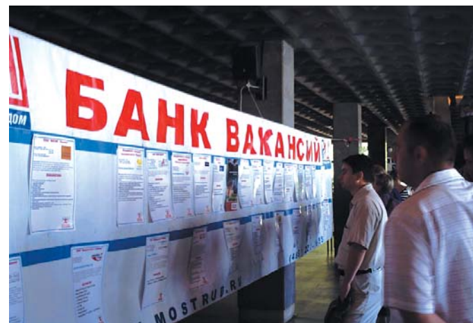
● НА ФОТО: ДЛЯ ВАС РАБОТЫ НЕТ!

Надежды на молодых специалистов, окончивших сельхозинститут, тоже пока немного, так как лишь 10% из них решают посвятить себя работе в аграрной сфере. И хотя в последнее время была внедрена программа, предусматривающая контрактное трудоустройство на селе, результаты ее действия также ощутимого результата не принесли.