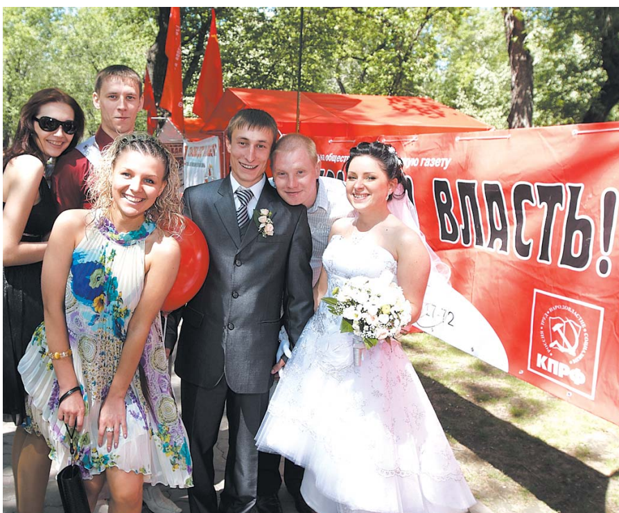
● НА ФОТО: «ДЕНЬ ПРАВДЫ-2010» ПОСЕТИЛО БОЛЕЕ 10 СВАДЕБНЫХ ЦЕРЕМОНИЙ