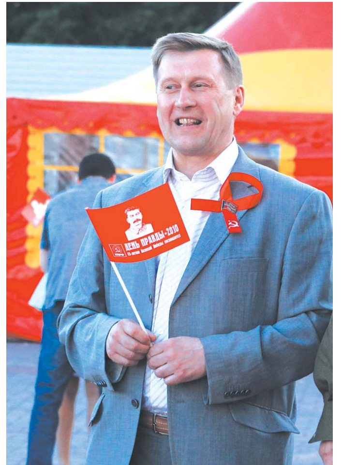
● НА ФОТО: ПЕРВЫЙ СЕКРЕТАРЬ ОБКОМА КПРФ АНАТОЛИЙ ЛОКОТЬ