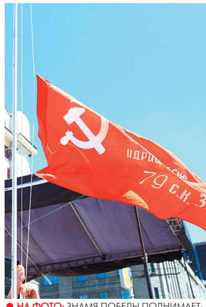
● НА ФОТО: ЗНАМЯ ПОБЕДЫ ПОДНИМАЕТСЯ В НЕБО НА ГЛАВНОЙ ПЛОЩАДКЕ