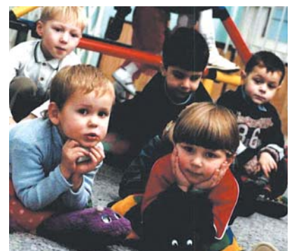
● НА ФОТО: НА ВСЕХ МЕСТ НЕ ХВАТИТ

— Депутаты-«единороссы» заблокировали ваше выступление на сессии Облсовета?