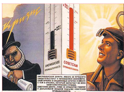
● НА РИС.: СОВЕТСКИЙ ПЛАКАТ 50-Х ГОДОВ

Уже все понимают, что наша страна отнюдь не является «тихой гаванью» в бушующем море кризиса, как нам говорили в прошлом году. Прошедшие события показали, что Россия напрямую зависит от мировой экономической ситуации.