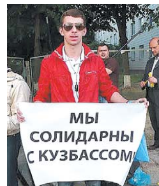
● НА ФОТО: СТРАНА ПОДДЕРЖИВАЕТ ШАХТЕРОВ

Социальная безответственность власти привела в середине мая 2010 года к беспрецедентному всплеску народного протеста. Рабочие «Алттрака», отчаявшиеся получить задолженность по зарплате, объявили голодовку. Шахтеры Кузбасса после трагических событий 9 мая, когда в результате взрывов на шахте «Распадская» погибли 67 человек, а еще 23 числятся пропавшими без вести, вышли на улицы городов Кемеровской области.