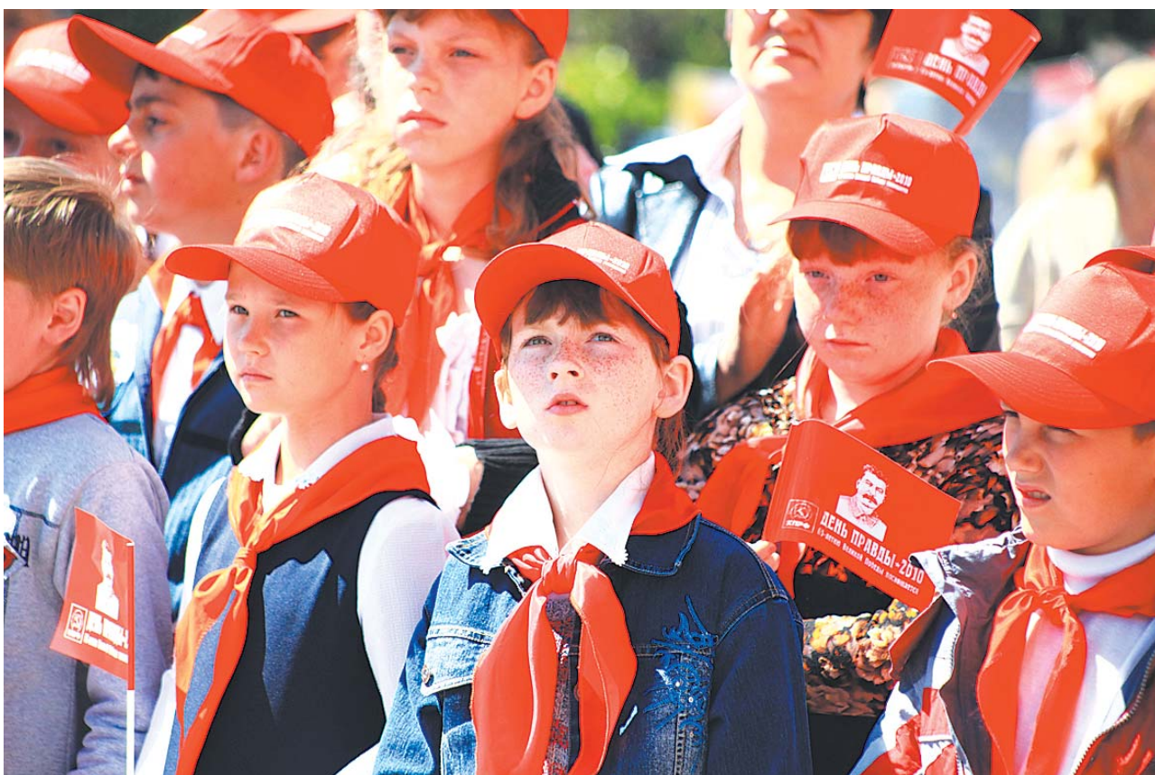
● НА ФОТО: КПРФ ПОДАРИЛА НОВОСИБИРСКУЮ ПРАЗДНИК