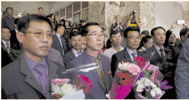
НА ФОТО: ДЕЛЕГАЦИЯ ИЗ СЕВЕРНОЙ КОРЕИ

В метро Новосибирска установили памятную доску бывшему северокорейскому лидеру КИМ Чен Иру . В торжественной церемонии приняли участие мэр Новосибирска Анатолий ЛОКОТЬ и временный поверенный в делах Посольства КНДР в РФ ЗИН Чжон Хеп .