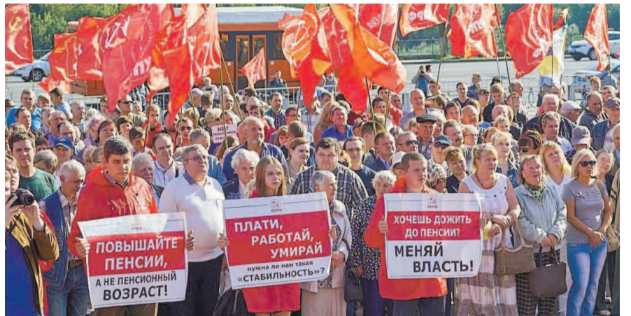
НА ФОТО: КПРФ ПРОДОЛЖАЕТ БОРЬБУ ПРОТИВ ПЕНСИОННОЙ РЕФОРМЫ

По словам депутата, в Правительстве не удовлетворены предваритель-