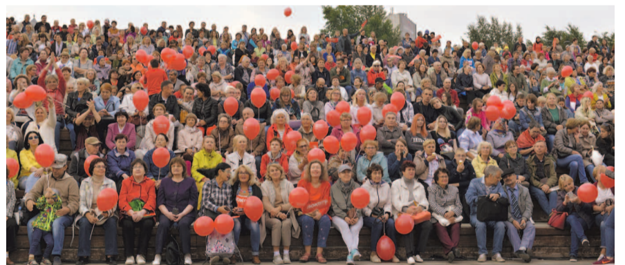
НА ФОТО: НЕСКОЛЬКО ТЫСЯЧ ЧЕЛОВЕК ПРИШЛИ ПОДДЕРЖАТЬ КАНДИДАТА ОТ КПРФ НА ФИНАЛЬНЫЙ МИТИНГ-КОНЦЕРТ 6 СЕНТЯБРЯ В НОВОСИБИРСКЕ

Как и год назад, основная поддержка КПРФ сосредоточена в городах, где проще противостоять административному ресурсу. Так, на выборах в Горсовет Йошкар-Олы каждый третий депутат был избран от КПРФ (да и список в Заксобрание республики набрал в процентном отношении почти в два раза больше, чем пять лет назад), 12 человек провели коммунисты в Горсовет Пензы, 8 депутатов — в приморском Уссурийске. Так что общественное со-