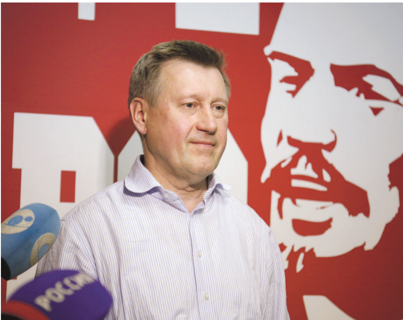
НА ФОТО: АНАТОЛИЙ ЛОКОТЬ БЛАГОДАРИТ НОВОСИБИРЦЕВ ЗА ПОДДЕРЖКУ НА ВЫБОРАХ