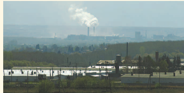
НА ФОТО: СНИЗУ ПЫЛЬ, А СВЕРХУ — ДЫМ

Минприроды РФ опубликовало рейтинг городов РФ с наиболее загрязненным воздухом. Искитим прогремел на всю страну — он признан одним из самых грязных городов России.