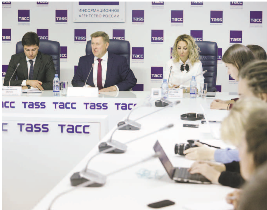
НА ФОТО: ПЕРВАЯ ПРЕСС-КОНФЕРЕНЦИЯ ПОСЛЕ ПОБЕДЫ НА ВЫБОРАХ

— Да, явка невысокая, но она соответствует прошлогодней на выборах губернатора. Кроме того, явка на выборах мэра Томска в прошлом году составила 19%. На выборах в Мосгордуму явка была примерно такая же. Позиция КПРФ была всегда в том, что второе воскресенье сентября не подходит в качестве Единого дня голосования, такая дата неудобна для людей. Но эти правила игры определяем не мы. Считаю, что некорректно сравнивать явку с 2014 годом — тогда выборы проходили в апреле. КПРФ последовательно