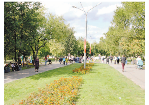
НА ФОТО: СКВЕР ПРЕОБРАЗИЛСЯ

На открытие сквера собралось немало местных жителей. Всем желающим раздавали бесплатно сахарную вату и катали на лошадях и верблюдах. Для