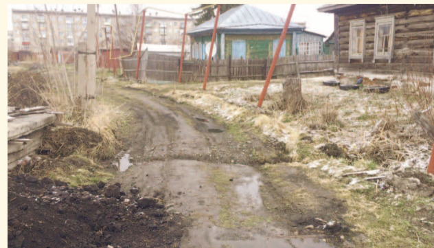
НА ФОТО: ИНВАЛИДНАЯ КОЛЯСКА ЗДЕСЬ НЕ ПРОЕДЕТ