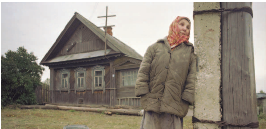
НА ФОТО: ПРАВИТЕЛЬСТВО ХОЧЕТ ПРЕВРАТИТЬ СЕЛЬСКИХ ПЕНСИОНЕРОВ В КРЕПОСТНЫХ?

Другой фактор, более значимый, который смущает депутата, это 30-летний стаж работы на производстве. Сергей