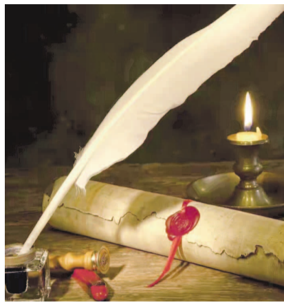
НА ФОТО: ЗАЙМСТВОВАНИЯ ДОЛЖНЫ БОГОЩАТЬ РОДНОЙ ЯЗЫК, А НЕ ЗАМЕНЯТЬ ЕГО

Самым трудным в переводе с японского является не наличие иероглифов. Озарение японского языка иностранными словами, так называемыми «гайрайго». Поскольку речевых средств