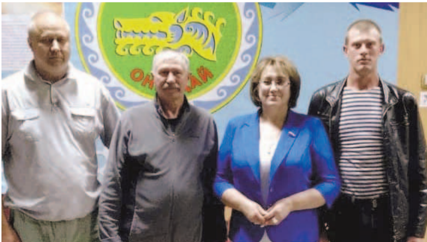
НА ФОТО: НА ВСТРЕЧЕ С ИЗБИРАТЕЛЯМИ В ОНГУДАЕ

Как рассказала депутат, на встречах жители задают много вопросов о состо-