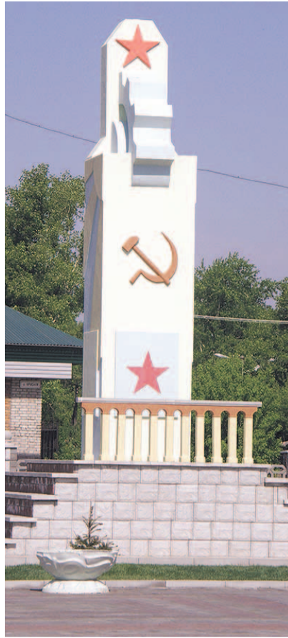
НА ФОТО: ПАМЯТНИК В КУЙБЫШЕВЕ «БОРЦАМ ЗА ВЛАСТЬ СОВЕТОВ»