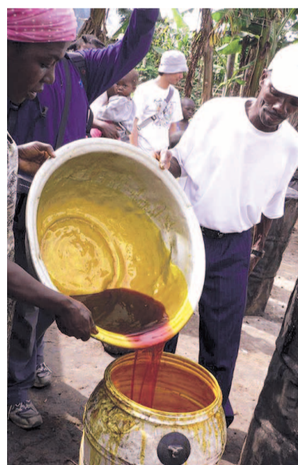
НА ФОТО: ПАЛЬМОВОЕ МАСЛО — СОВРЕМЕННЫЙ ВЫСОКОТЕХНОЛОГИЧНЫЙ ПРОДУКТ

Из богатых стран сегодня трансжиры переместились в бедные, развивающиеся. Так, еще недавно самый высо-