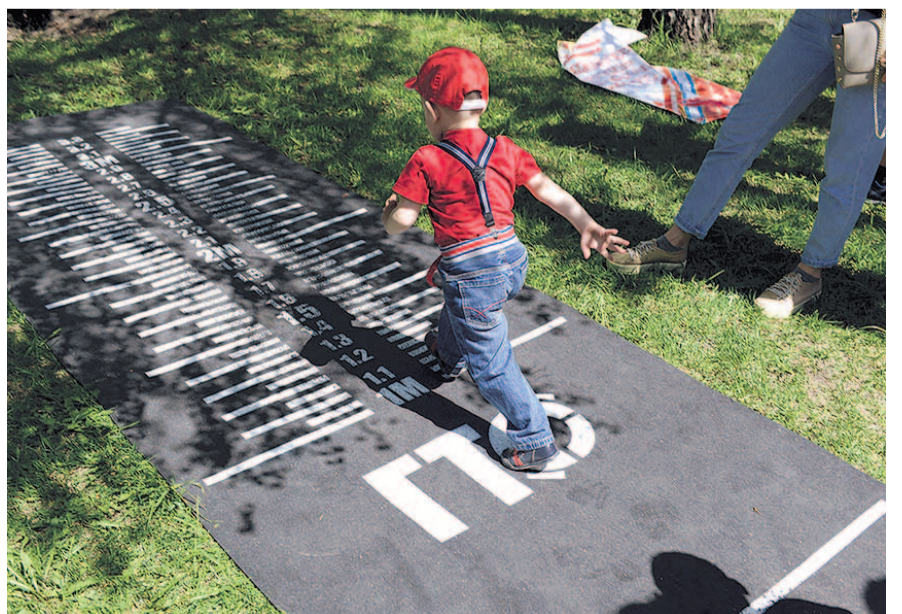
НА ФОТО: ...ИЛИ ПОПРОБОВАТЬ СДАТЬ НОРМЫ ГТО