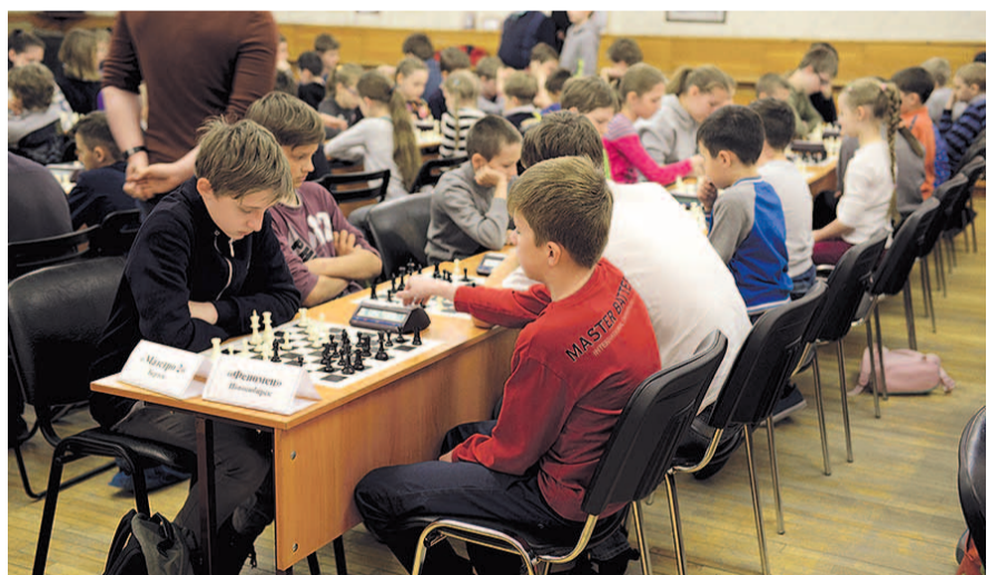
НА ФОТО: УЧАСТНИКИ ТУРНИРА «ШАХМАТНАЯ КОРОЛЕВА»

По его словам, через этот турнир прошли уже тысячи шахматистов, кто-то из них стал видными гроссмейстерами. Депутат поблагодарил руководи-