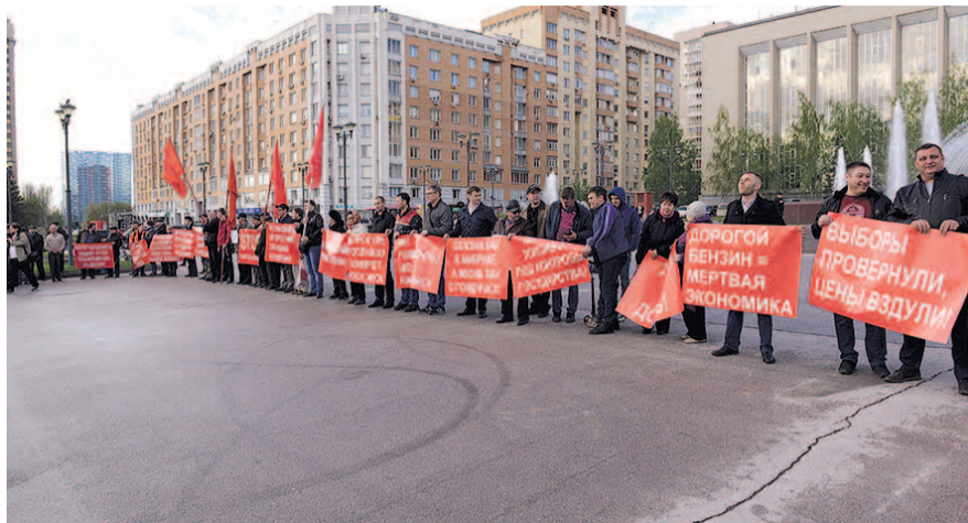
НА ФОТО: ПИКЕТИРУЮЩИЕ ПРИЗЫВАЮТ УСТАНОВИТЬ КОНТРОЛЬ НАД ЦЕНАМИ НА ТОПЛИВО

Действительно, транспортники, только-только приспособившиеся к