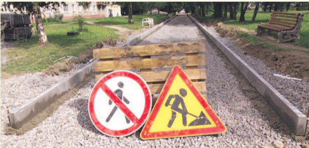
НА ФОТО: ХОДИТЬ ПО ТРОТУАРАМ СТАНЕТ УДОБНЕЕ