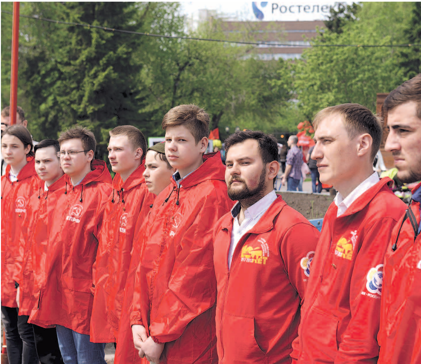
НА ФОТО: НОВОЕ ПОКОЛЕНИЕ КОМСОМОЛЬЦЕВ