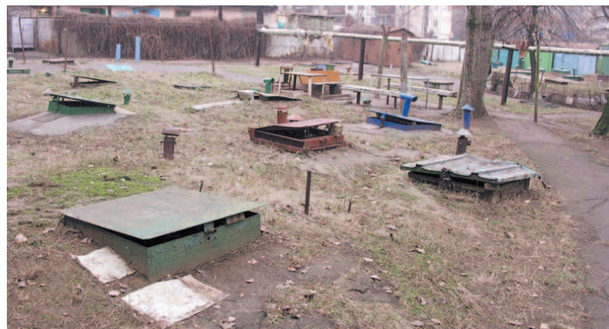
НА ФОТО: ПОГРЕББА МИКРОРАЙОНА НОВОБОРСКИЙ