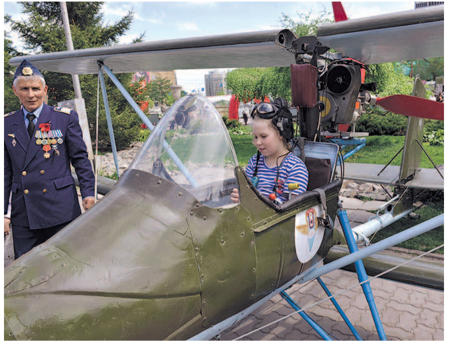
НА ФОТО: ГОСТИ «ДНЯ ПРАВДЫ» МОГЛИ ПРИМЕРИТЬ НА СЕБЯ РОЛЬ ПИЛОТА...

макеты настоящего оружия и реконструкторы, которые отлично вжились в роль участников Гражданской войны.