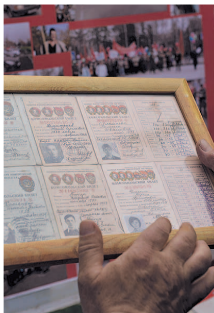
НА ФОТО: КОМСОМОЛЬСКИЕ БИЛЕТЫ

В этом году организаторы тематических площадок, реконструировали этапы получения комсомольцами орденов за свою деятельность на благо Союза. Так, коммунисты Заельцовского района воссоздала атмосферу сражающегося комсомола, показав, как в 1928 году комсомольцам был вручен орден Боевого Красного Знамени. Особенно «Боевую» составляющую дополняли