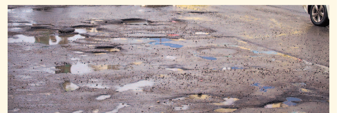
НА ФОТО: ТО ЯМА, ТО КАНАВА — ВРАГ НЕ ПРОЙДЕТ!