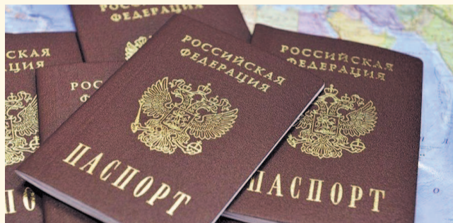
НА ФОТО: СБОЙ ТЕХНИКИ ОСТАВИЛ ЛЮДЕЙ БЕЗ ГЛАВНОГО ДОКУМЕНТА

Паспорта миллионов российских граждан в одночасье стали считаться недействительными в базе данных ЕИАС «Российский паспорт» из-за технического сбоя. По данным Министерства внутренних дел РФ, «беспаспортными» внезапно оказались не меньше 1,5 млн человек.