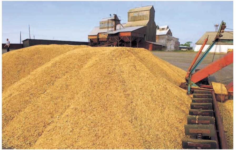
НА ФОТО: ИЗБЫТОК ЗЕРНА ОКАЗАЛСЯ НЕВОСТРЕБОВАННЫМ НА РЫНКЕ

Страны-получатели российской продовольственной помощи, объемы и сроки поставок в них продовольствия Россия сможет определить сама, исходя из логистики и собственных внешнеполитических приоритетов. По словам министра иностранных дел Сергея ЛАВРОВА , такие акции регулярно реализуют, например, США.