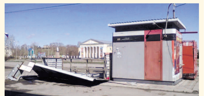
НА ФОТО: УНЕСЕННАЯ ВЕТРОМ ОСТАНОВКА