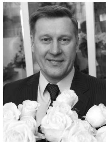
● НА ФОТО: АНАТОЛИЙ ЛОКОТЬ

От имени Новосибирского обкома КПРФ поздравляю ветеранов и всех земляков с великой датой — 67-летием Победы Красной Армии над фашизмом! Это Победа всего Советского народа, и сибиряки внесли огромный вклад в общее дело — наш город находился в тылу, и именно отсюда поставлялось оружие и продовольствие для фронта. Наша область знаменита Сибирскими дивизиями, которые принимали участие в защите Сталинграда, в контрнаступлении под Москвой и во взятии Берлина.