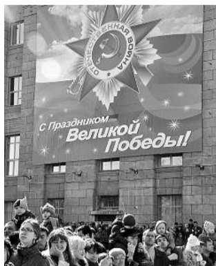
● НА ФОТО: ЗНАМЕНИ ПОБЕДЫ В НОВОСИБИРСКЕ НЕ НАЙТИ

Согласно закону, работающему в стране, в нерабочие праздничные дни 9 Мая — День Победы и 23 февраля — День защитника Отечества символ Знамени Победы вывешивается на зданиях (либо поднимается на мачтах, флажштоках), а также жилых домах наряду с Государственным флагом Российской Федерации.