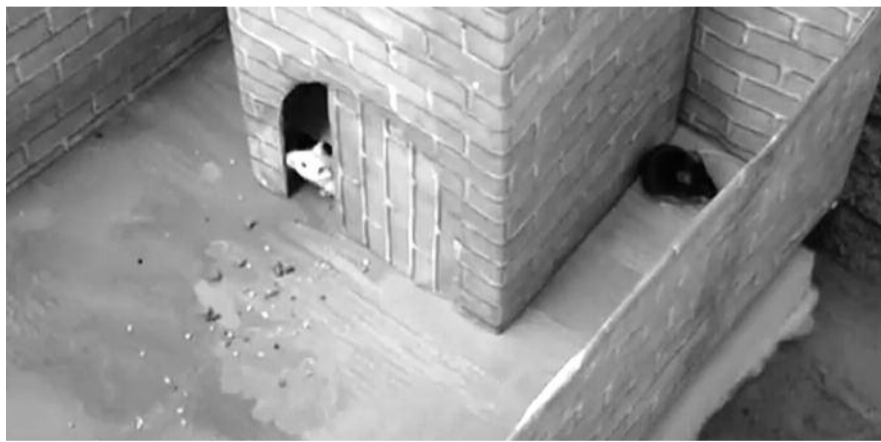
● НА ФОТО: КРЫСА «ДМИТРИЯНАТОЛИЧ» СМЕНИЛА В ДОМИКЕ «ВЛАДИМИРВЛАДИМИРЫЧА»