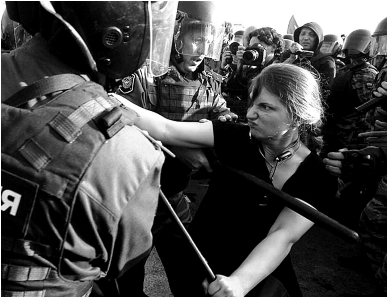
● НА ФОТО: В МИНУВШЕЕ ВОСКРЕСЕНЬЕ В МОСКВЕ СОСТОЯЛАСЬ САМАЯ РАДИКАЛЬНАЯ В ИСТОРИИ СОВРЕМЕННОЙ РОССИИ АКЦИЯ