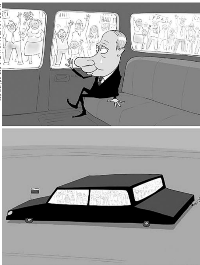
● НА ФОТО: ЗАВОЕВАТЕЛЬ ВОШЕЛ В ОПУСТОШЕННУЮ МОСКВУ