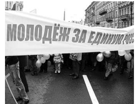
● НА ФОТО: КОГДА-НИБУДЬ ОНИ ПРОЗРЕЮТ И УВИДЯТ, КОГО ВЫБИРАЮТ ВО ВЛАСТЬ

Факт, что в течение 20 лет не возвращена государству, народу разворованная государственная собственность, богатейшие природные ресурсы — достояние всех жителей России. Факт, что сегодня в нашей экономике осталось всего 10% государственной собственности, и ни главе государства, ни правительству управлять сегодня нечем. Поэтому реальный штаб по управлению экономикой, а, следовательно, и страной находится в клубе олигархов, богатых промышленников и торговцев «Союза промышленников и предпринимателей», куда иногда приглашают главу государства, главу правительства и министров. Сегодня в руках олигар-