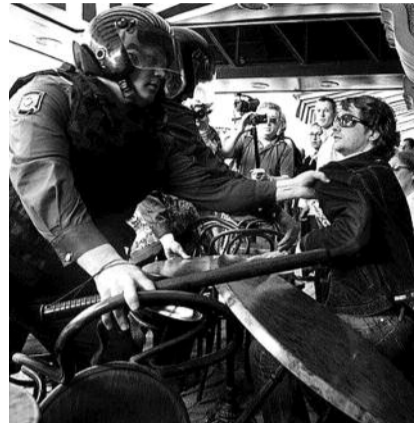
НА ФОТО: ЗАДЕРЖАНО ОКОЛО 450 ЧЕЛОВЕК

Обстановка накаляется. Впереди стоящих в «пробке», организованной 5-7 рядами ОМОНа поджимают задние ряды демонстрантов. Происходит прорыв передних рядов через полицейское ограждение в сторону Болотной на Большой каменный мост. Полиция действует предельно жестко. По свидетельствам очевидцев, «ОМОН винтит и кладет на землю... всех, кто прорвался,