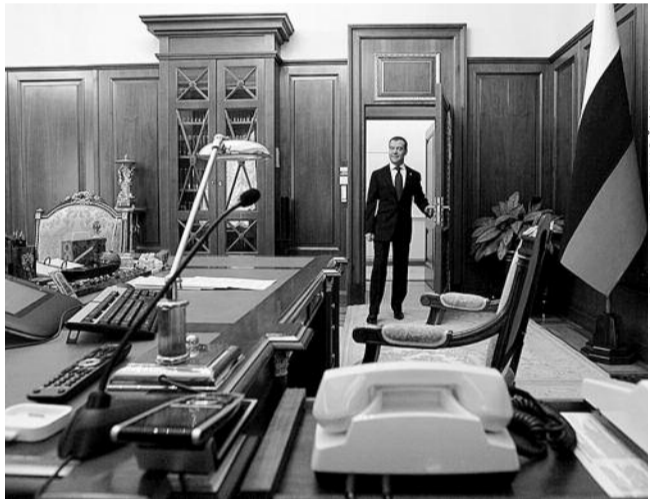
● НА ФОТО: В ПОСЛЕДНИЙ РАЗ...