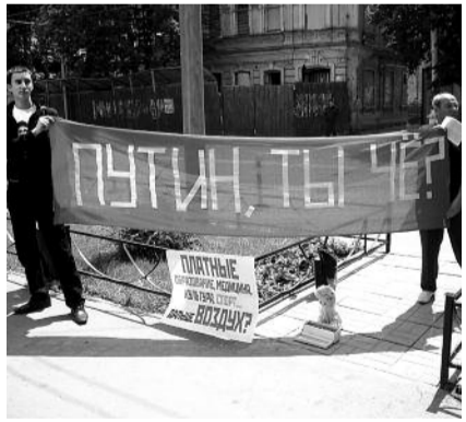
● НА ФОТО: АКЦИЯ ПРОТИВ 83-ФЗ В САРАТОВЕ

С 20 по 25 апреля в российских городах проходили акции протеста родительских, общественных и профсоюзных организаций против коммерциализации школьного образования. В стране закрываются центры дополнительного образования, а обучение в обычных школах без дополнительной платы становится практически невозможным.