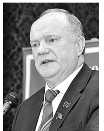
● НА ФОТО: ЛИДЕР КПРФ

8 мая на заседании Государственной думы по вопросу утверждения на должность Председателя Правительства РФ Дмитрия МЕДВЕДЕВА от имени фракции КПРФ выступил ее руководитель. Председатель ЦК КПРФ Геннадий ЗЮГАНОВ объяснил, почему фракция будет голосовать против Медведева (печатается в сокращении).