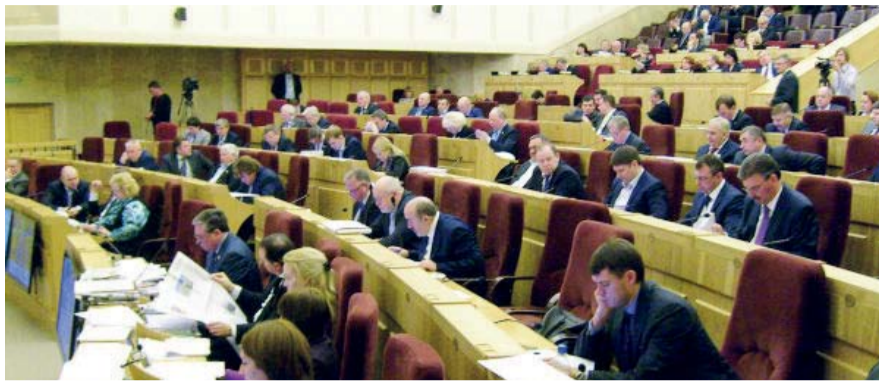
НА ФОТО: СЕССИЯ ЗАКОНОДАТЕЛЬНОГО СОБРАНИЯ НОВОСИБИРСКОЙ ОБЛАСТИ

— Расходы на дороги сокращены в общей сложности на 1 млрд 117 млн рублей, — комментирует ситуацию заместитель председателя Законодательного собрания, лидер фракции КПРФ