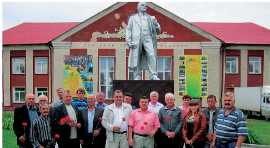
НА ФОТО: КАРГАТСКОЕ МЕСТНОЕ ОТДЕЛЕНИЕ КПРФ У ПАМЯТНИКА ЛЕНИНУ