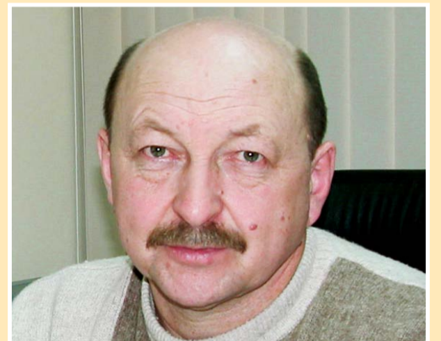
НА ФОТО: АЛЕКСАНДР АБАЛАКОВ

В мэрии Новосибирска прошло первое заседание рабочей группы по внесению изменений в порядок проведения общественных слушаний. В заседании принял участие депутат Государственной думы, член фракции КПРФ Александр АБАЛАКОВ , который был одним из инициаторов работы по внесению изменений в порядок проведения слушаний. По итогам заседания рабочей группы большинство пунктов, предлагаемых общественниками, было одобрено мэрией.