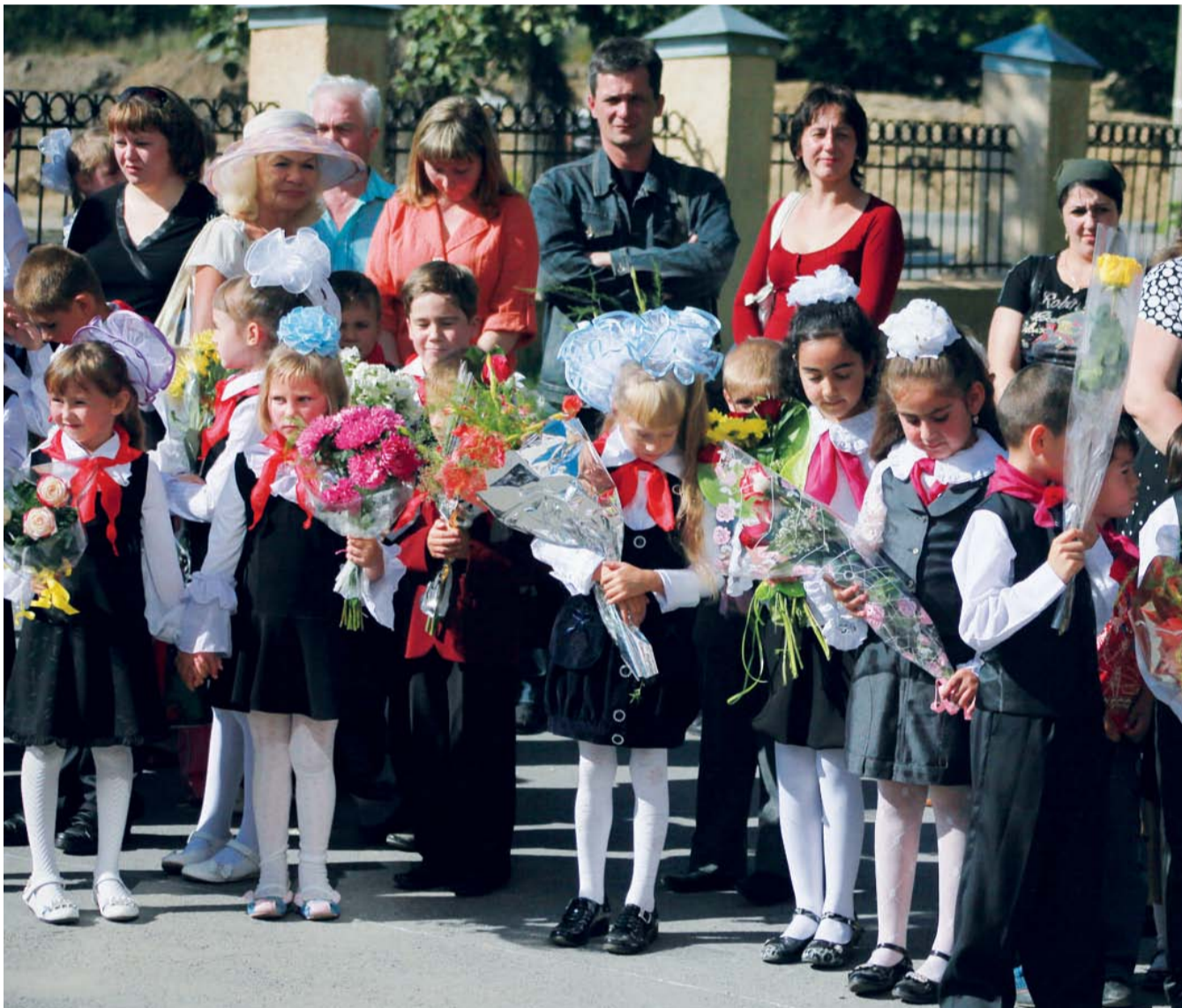
НА ФОТО: 1 СЕНТЯБРЯ ШКОЛЫ НОВОСИБИРСКА ПРИМУТ 10 ТЫСЯЧ ПЕРВОКЛАССНИКОВ