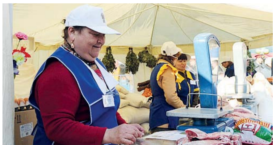
НА ФОТО: ФЕРМЕРСКИЕ РЫНКИ ДОЛЖНЫ ВЕРНУТЬСЯ В ГОРОДА