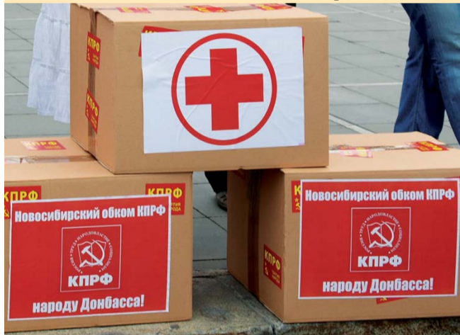
НА ФОТО: ГУМАНИТАРНАЯ ПОМОЩЬ ДОНБАССУ