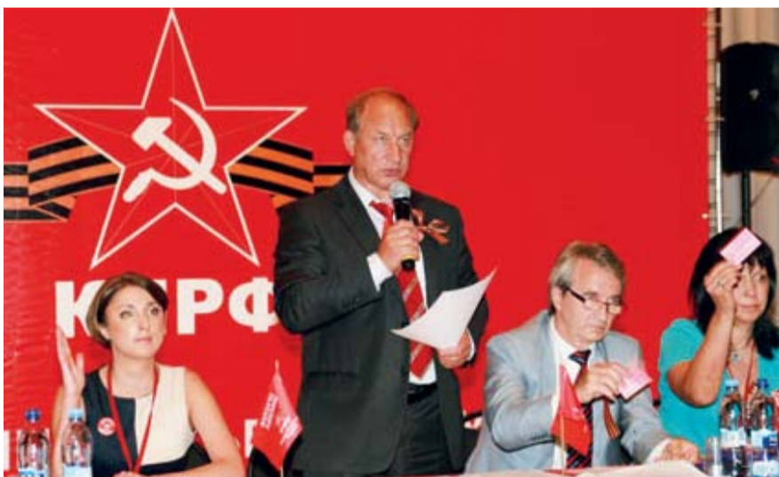
НА ФОТО: ВЕЛ СЪЕЗД ВАЛЕРИЙ РАШКИН

Перед участниками Съезда выступили первый секретарь Московского горкома КПРФ, депутат Госдумы