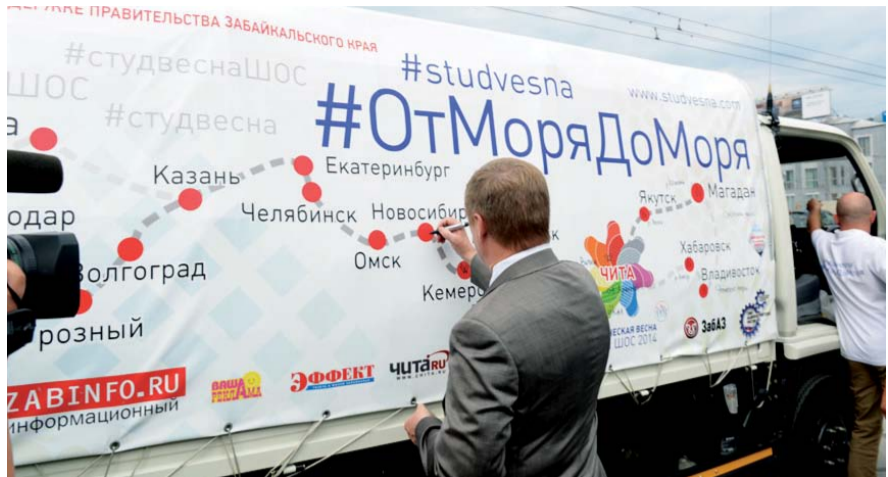
НА ФОТО: ГРУЗОВИК ПОВЕЗЕТ ГУМАНИТАРНУЮ ПОМОЩЬ, СОБРАННУЮ НОВОСИБИРЦАМИ

Коммунисты направили в Новороссию медикаменты