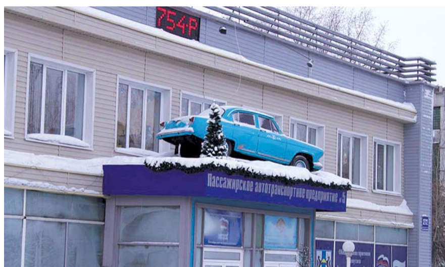
НА ФОТО: ПРЕДПРИЯТИЯ, НЕ ПРИНОСЯЩИЕ ГОРОДУ ДОХОД, БУДУТ ЗАКРЫТЫ

Как пояснил мэр, речь идет о «Центральной аварийной диспетчерской Калининского района», уже давно не выполнявшей свои функции, и МУП «Новосибирскгорресурс». В дальнейшем также будут ликвидированы МУП «Управление жилищного хозяйства Ленинского района», МУП «Управляющая компания Железнодорожного района», МУП «Управляющая компания Первомайского района», МКУ «Гормост» и МУП «ПАТП-5». Функции «Гормоста», не справившегося долж-