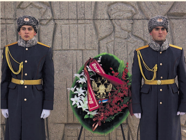
НА ФОТО: ВАХТА ПАМЯТИ