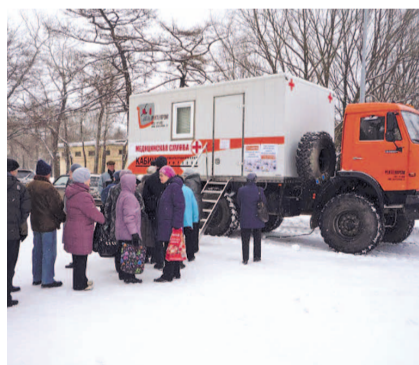
НА ФОТО: МОБИЛЬНЫЙ ФЛЮОРОГРАФ

— Сейчас есть тенденция к снижению заболеваемости туберкулезом. Но при этом в Новосибирской области наблюдается рост количества случаев