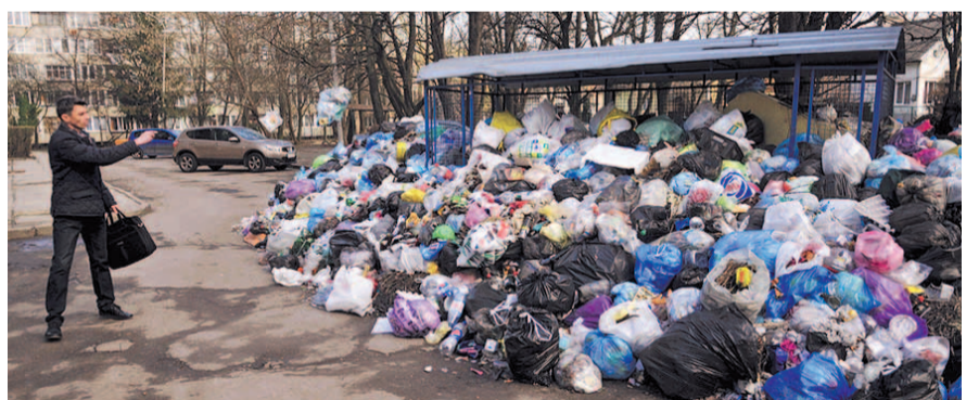
НА ФОТО: ЧЕЛЯБИНСКИЙ ПЕЙЗАЖ. НАС ЖДЕТ ТАКОЙ ЖЕ?

Депутат Заксобрания Вадим АГЕНКО, который входит в рабочую группу по «мусорной» реформе, подтвердил, что перевозчики обратились