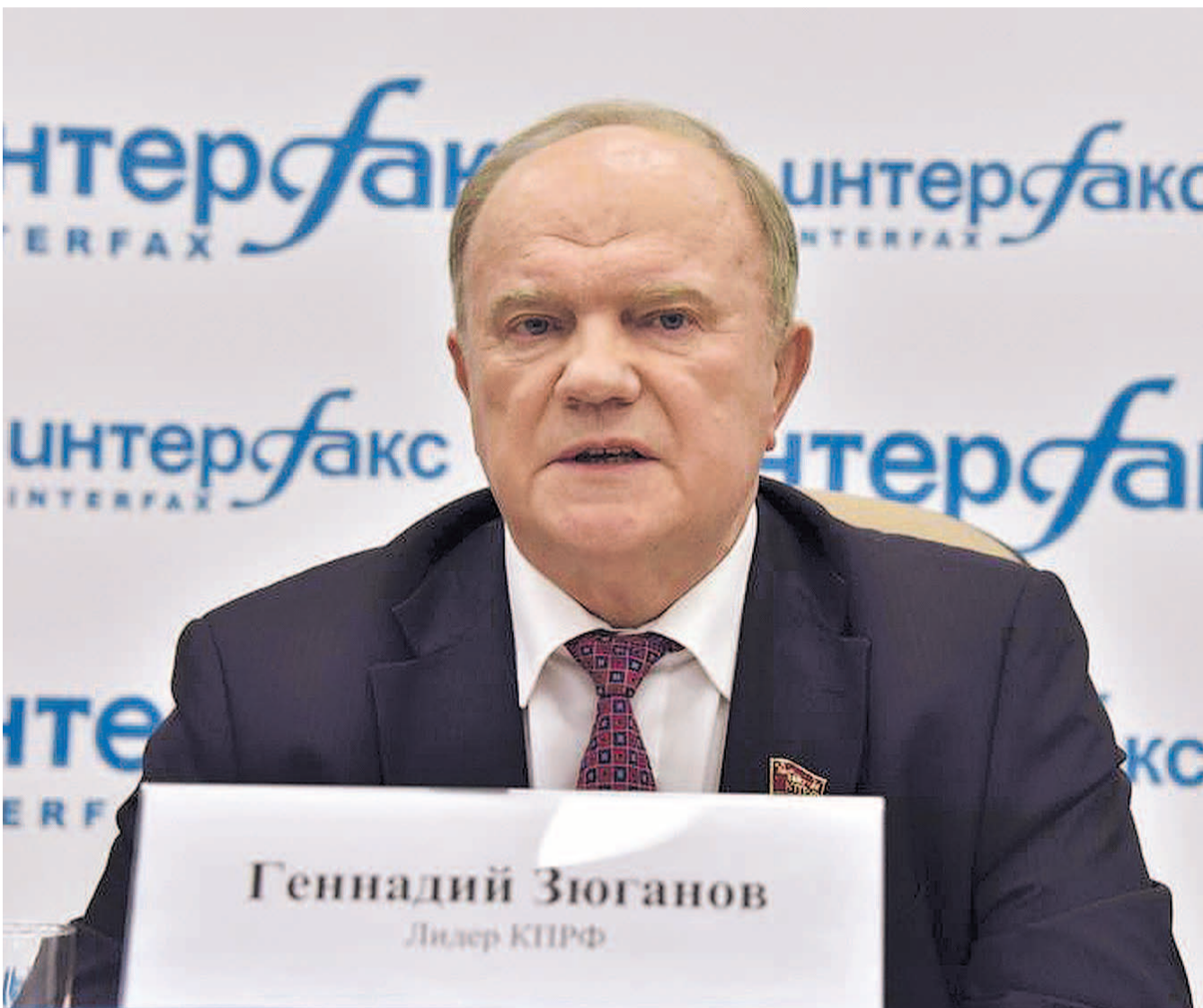
Геннадий Зюганов Лидер КПРФ