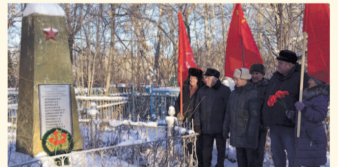
НА ФОТО: НА БРАТСКОЙ МОГИЛЕ КРАСНЫХ ПАРТИЗАН