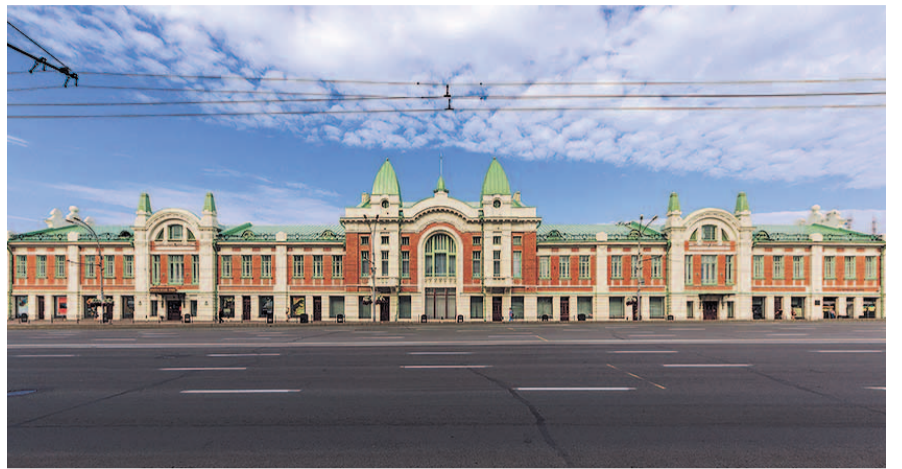
НА ФОТО: «ДОМ С КРЕСТОМ» — КРАЕВЕДЧЕСКИЙ МУЗЕЙ НОВОСИБИРСКА

Если бы какой-нибудь режиссер снимал кино о Ново-Николаевске, он бы наверняка выбрал в качестве декораций Городской торговый корпус. Построенное 110 лет назад в центре Базарной площади здание сразу же стало знакомым для города. На первом этаже на-