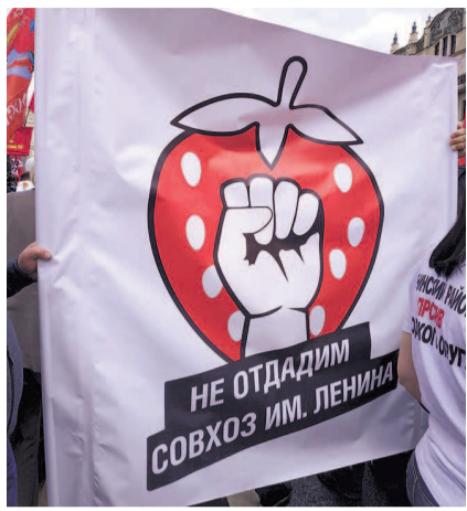
НА ФОТО: ОТСТОИМ СПРАВЕДЛИВОСТИ!

Тема губернатора Иркутской области Сергея ЛЕВЧЕНКО на этой пресс-конференции, как и на ряде предыдущих, звучала отдельно и мощно. Как отдельно звучит эта фамилия и в выпусках новостей СМИ по всей стране. Только вот странность: губернатор с отличными результатами работы, увеличивший общий бюджет области с 2015 года со 100 до почти 200 миллиардов рублей, а также поднявший сбор за использование лесных ресурсов с 3 до 10 миллиардов рублей при тех же объемах лишь за счет наведения порядка с налогообложением, — так вот такого чиновника наши СМИ не в пример другим приводят, а совсем наоборот. Работа Левченко освещается примерно так же, как кандидата от КПРФ Павла ГРУДИНИНА на последних выборах Президента.