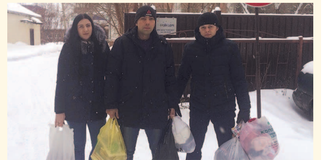
НА ФОТО: МОШКОВСКИЕ КОММУНИСТЫ С ПОДАРКАМИ ДЛЯ РЕБЯТИШЕК