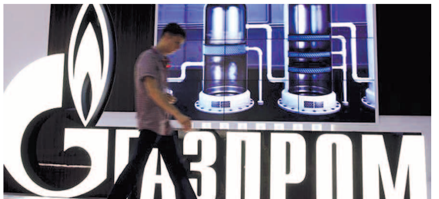
НА ФОТО: ПРИ НИЗКИХ ЦЕНАХ НА ГАЗ БЮДЖЕТ БУДЕТ ПОПОЛНЯТЬСЯ ИЗ НАШИХ КАРМАНОВ

Избыточное «газовое» предложение в Европе привело к тому, что стоимость этого товара с немедленной поставкой рухнула за год на 57%, и сей-