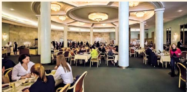
НА ФОТО: В СТОЛОВОЙ ГОСУДАРСТВЕННОЙ ДУМЫ