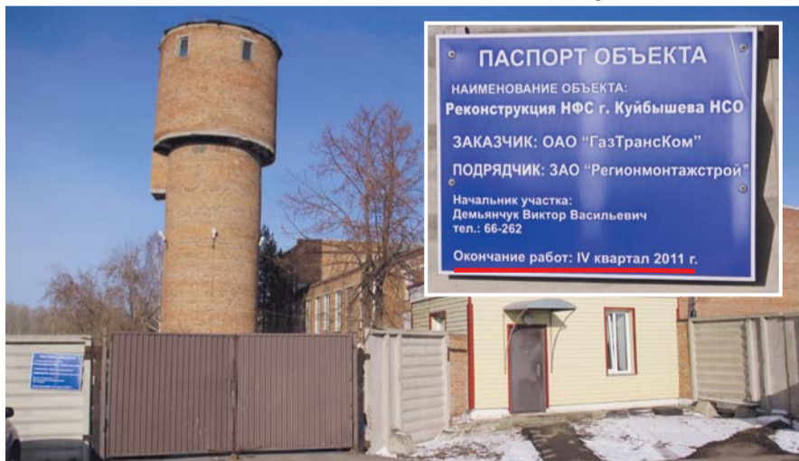
НА ФОТО: ЗДЕСЬ ЗАКОПАНЫ 240 МЛН РУБЛЕЙ?!

Следственный комитет наконец-то заинтересовался сильно затянувшейся реконструкцией куйбышевской насосно-фильтровальной станции стоимостью в 240 млн.рублей.