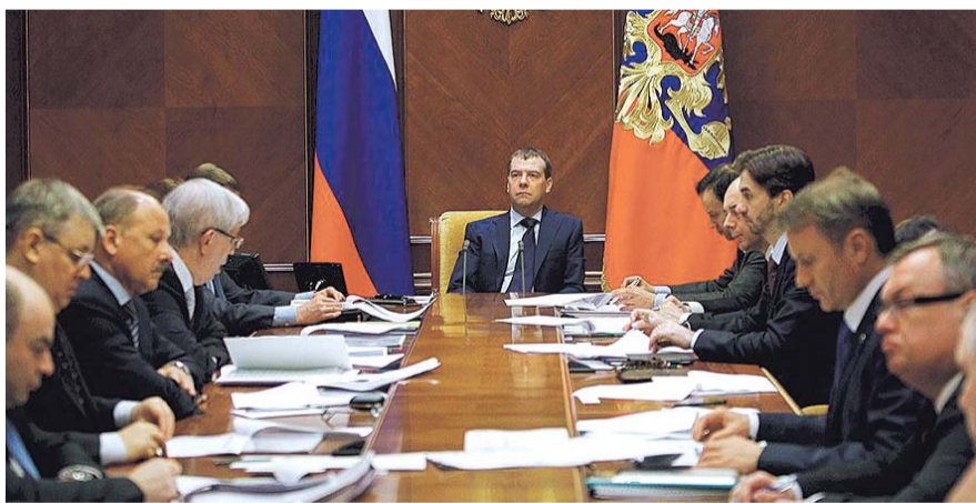
НА ФОТО: РОССИЯНЕ ПОСТАВИЛИ «НЕУД» КАБИНЕТУ МИНИСТРОВ

За систематической «нащупывание» «дна российской экономики» без убедительных попыток оторваться от него глава МЭР Алексей УЛЮКАЕВ