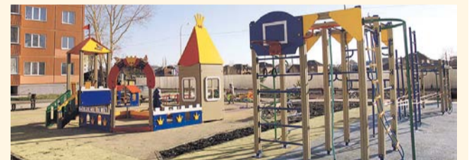
НА ФОТО: ТЕРРИТОРИЯ ДВОРОВ ДОЛЖНА БЫТЬ КОМФОРТНОЙ