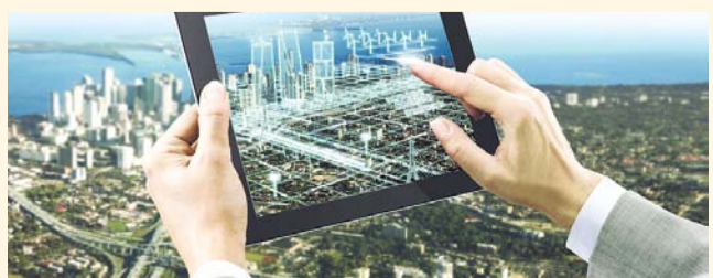
НА ФОТО: ВЗГЛЯД НА ГОРОД ИЗ БУДУЩЕГО