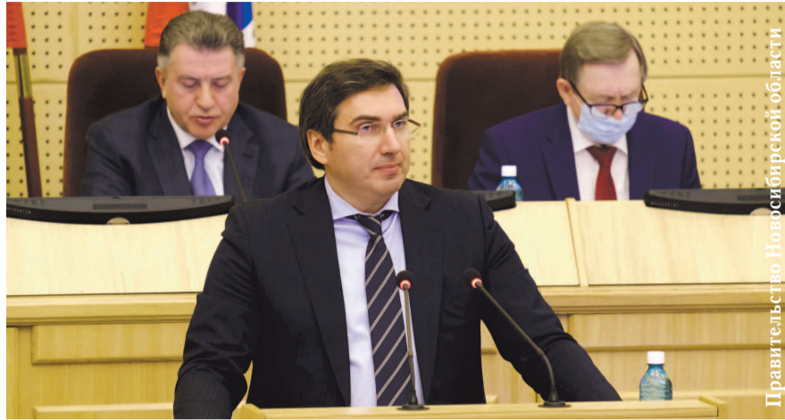
НА ФОТО: МИНИСТР ЗДРАВООХРАНЕНИЯ КОНСТАНТИН ХАЛЬЗОВ НА СЕССИИ ЗАКСОБРАНИЯ НОВОСИБИРСКОЙ ОБЛАСТИ

Один из материалов популярного Интернет-портала «Свободная пресса», посвященный действиям властей по борьбе с пандемией, называется «Бестолковщина российского государственного управления». С этим определением согласились бы жители Новосибирской области, простаивающие в очередях в больницы и аптеки.