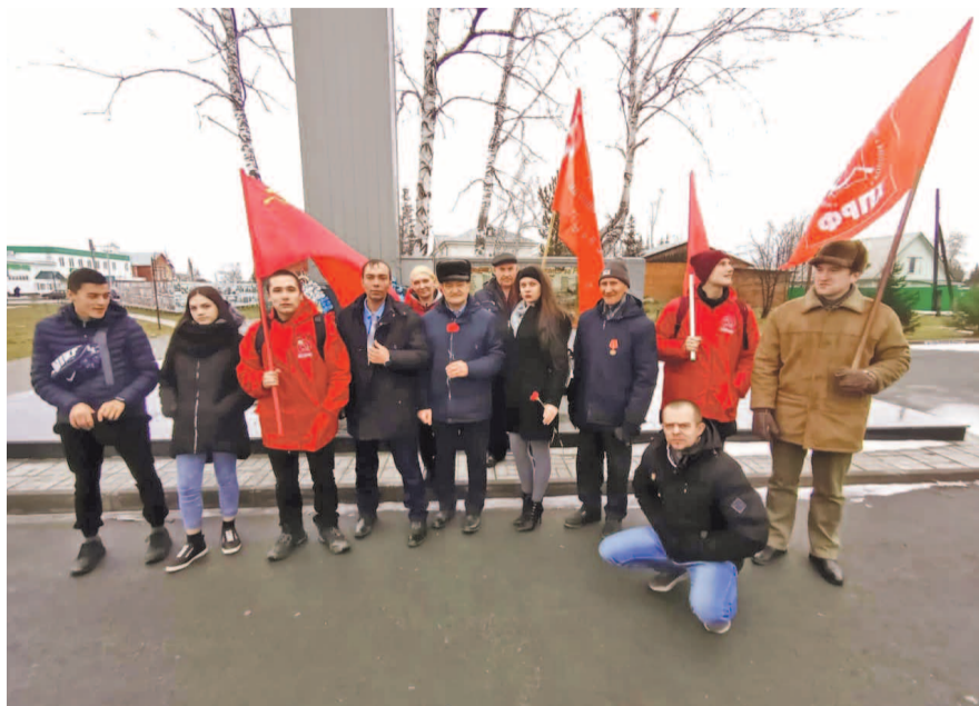
НА ФОТО: КОММУНИСТЫ МОШКОВСКОГО РАЙОНА ПРАЗДНУЮТ ГОДОВЩИНУ ВЕЛИКОГО ОКТЯБРЯ

— Кризис империализма набирает обороты во всем мире, и не далек тот день, когда вновь противоречия между классами в нашей стране могут привести к новой социалистической революции.