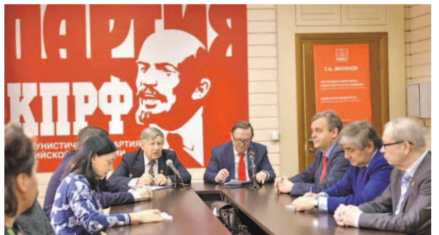
НА ФОТО: КОММУНИСТЫ ОБСУДИЛИ ЗАВОЕВАНИЯ ВЕЛИКОЙ ОКТЯБРЬСКОЙ СОЦИАЛИСТИЧЕСКОЙ РЕВОЛЮЦИИ