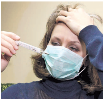
НА ФОТО: ЗАБОЛЕЛ — ИДИ К ВРАЧУ!

К сожалению, вакцины, которая бы положила конец гриппу, как было с оспой или корью, до сих пор не суще-