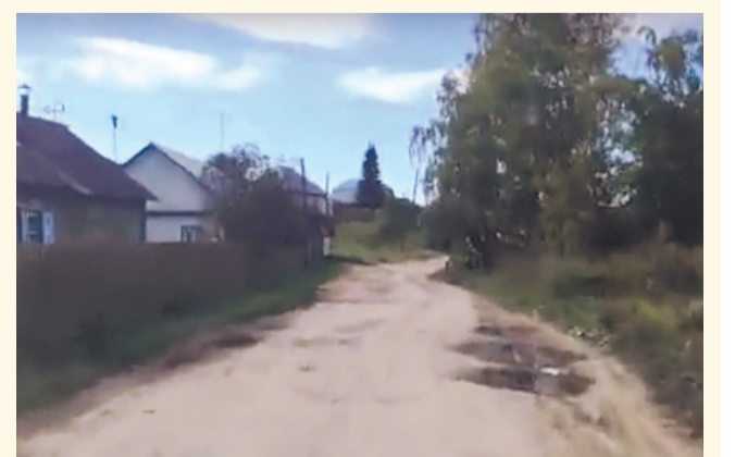
НА ФОТО: ДОРОГА КАКОЙ БЫЛА, ТАКОЙ И ОСТАЛАСЬ