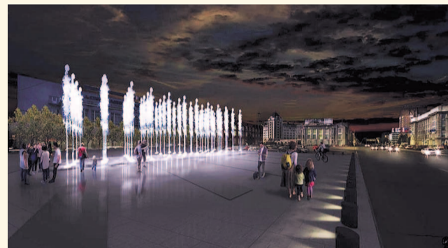
НА ФОТО: ТАК МОЖЕТ ВЫГЛЯДЕТЬ «СУХОЙ» ФОНТАН