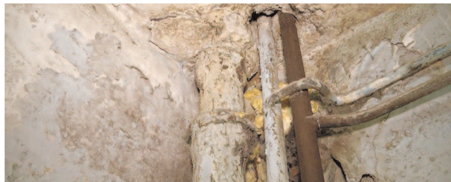
НА ФОТО: СКОЛЬКО ДОЛЖНО СТОИТЬ ПРОЖИВАНИЕ В ТАКОМ «ЖИЛЬЕ»?

Состоялось очередное заседание по делу НТИ против малоимущей пенсионерки