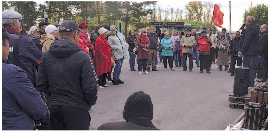
НА ФОТО: МИТИНГ В КУЙБЫШЕВЕ

22 сентября в день Всероссийской акции протеста против повышения пенсионного возраста в большинстве районов Новосибирской области прошли митинги и пикеты. Во многих из них — в формате «свободного микрофона»: помимо коммунистов, на сцене активно выступали местные жители, которые возмущены нынешним курсом Правительства.