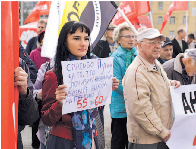
НА ФОТО: НА МИТИНГЕ