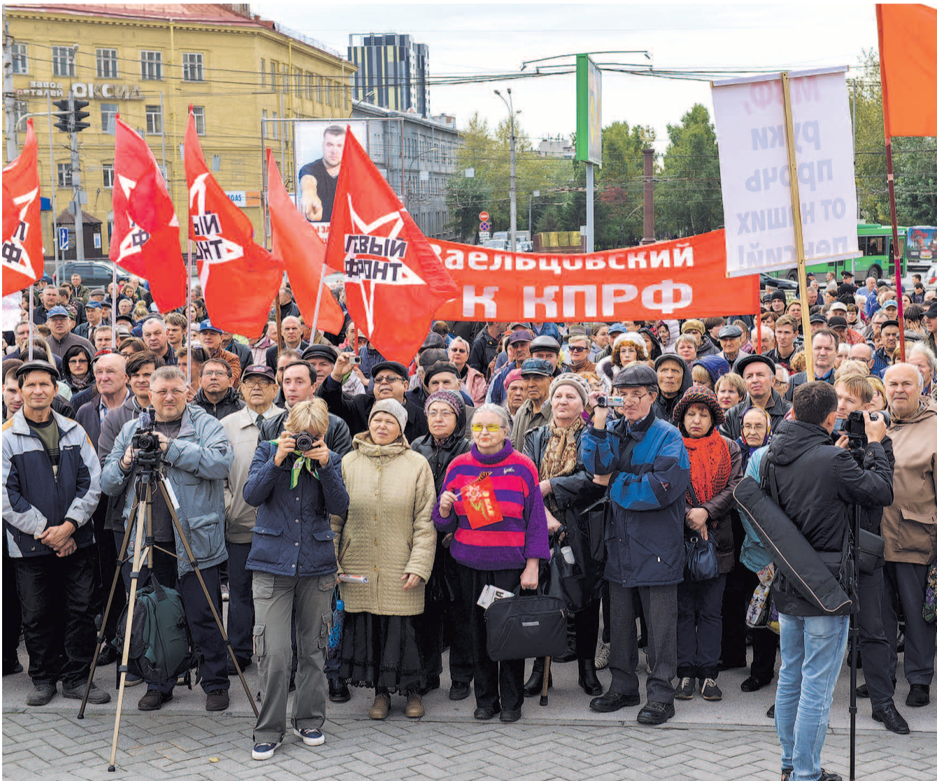
НА ФОТО: НАРОДНЫЙ ПРОТЕСТ НЕ УТИХАЕТ