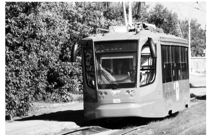
НА ФОТО: ТРАМВАЙНАЯ СЕТЬ БУДЕТ РАЗВИВАТЬСЯ

ним из показателей ситуации на рынке продовольствия является деятельность крупных торговых сетей. Они не только не ушли из Новосибирска, но, напротив, расширяют свое присутствие.