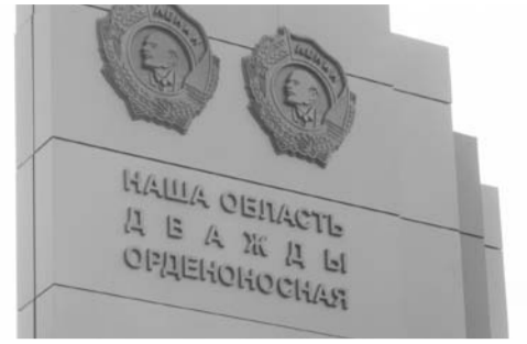
НА ФОТО: ТАК ВЫГЛЯДИТ ВОССТАНОВЛЕННАЯ СТЕЛА

Лидер фракции КПРФ в Горсовете Новосибирска Ренат СУЛЕЙМАНОВ добился восстановления памятного знака, говорящего об успехах Новосибирской области в советское время.