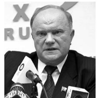
НА ФОТО: ЛИДЕР КПРФ

Лидер КПРФ Геннадий Зюганов предлагает отдать под народный трибунал бывшего президента СССР Михаила Горбачева . В годовщину событий августа-1991 Г.А.Зюганов рассказал об этом «Русской службе новостей».