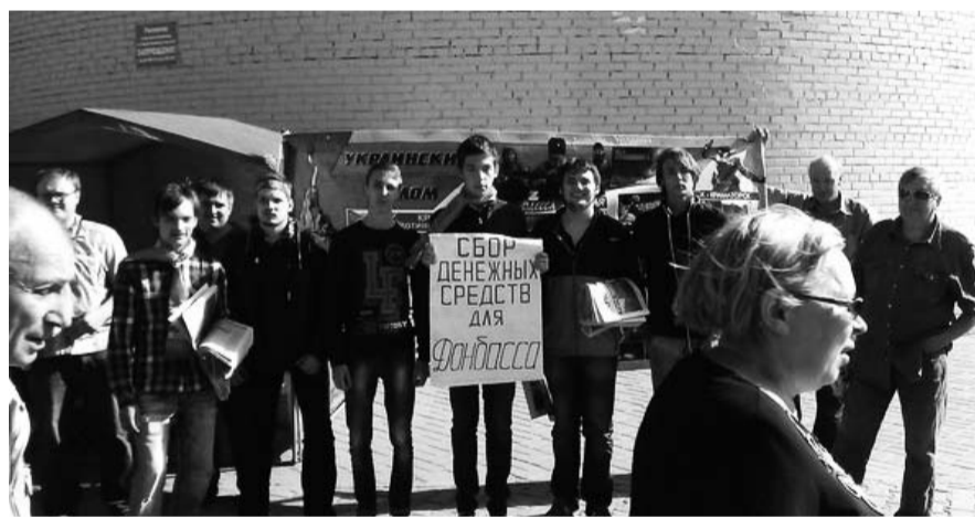
НА ФОТО: ПИКЕТ ЛКСМ ПО СБОРУ ПОМОЩИ ДЛЯ ДОНБАССА

Показательным стал и пикет ЛКСМ, прошедший 16 августа на Ленинском рынке. Принято считать, что, как пра-