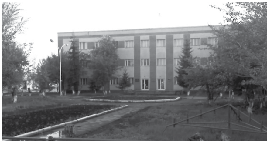
НА ФОТО: ЗДАНИЕ АДМИНИСТРАЦИИ КОЧКОВСКОГО РАЙОНА

— Проблемы — не уникальные. Наверное, такие же, как во многих других провинциальных городах России. Это и нехватка рабочих мест, и, как следствие, отток из города и района молодых квалифицированных кадров, и состояние окружающей среды, и дефицит пригодной для питья воды, и