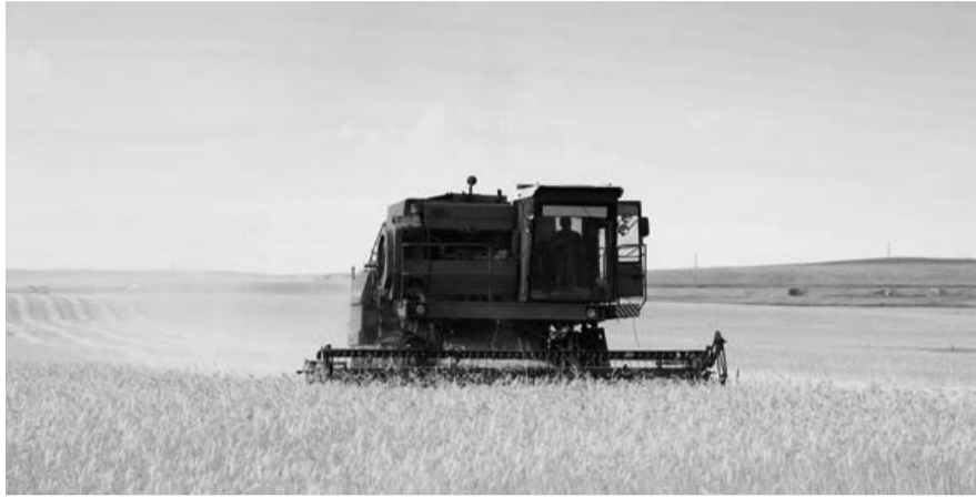
НА ФОТО: ЗАТРАТЫ НА УБОРКУ УРОЖАЯ ОГРОМНЫ, А САМ УРОЖАЙ — МАЛ

Как сообщил на заседании правительства Новосибирской области временно исполняющий обязанности министра сельского хозяйства Георгий ИВАЩЕНКО , в этом году уборочная кампания в регионе обойдется в 1,6 миллиарда рублей, в частности, 1,1 млрд. потребуются для приобретения 370 тыс. тонн горюче-смазочных материалов, 0,4 млрд. — для покупки запасных частей для сельхозтехники, 0,1 млрд. на прочие расходы. При этом основное финансирование уборочной кампании, по словам врио министра, должно осуществляться за счет собственных средств самих аграриев с учетом выделенных субсидий и дотаций из средств федерального и областного бюджетов — 1,038 млрд. рублей. — Что касается слов о «собственных средствах хозяйства», — говорит директор ЗАО «Агроферма «Рождественская», депутат Законодательного собрания области Сергей БАРАННИКОВ , — то это попытка всех «причесать под одну гребенку». У одних хозяйств эти средства есть, у других, особенно в южной части региона, их