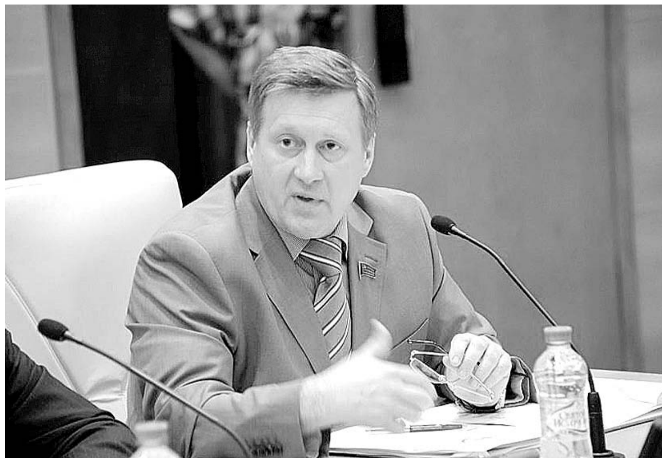
НА ФОТО: МЭР НОВОСИБИРСКА АНАТОЛИЙ ЛОКОТЬ