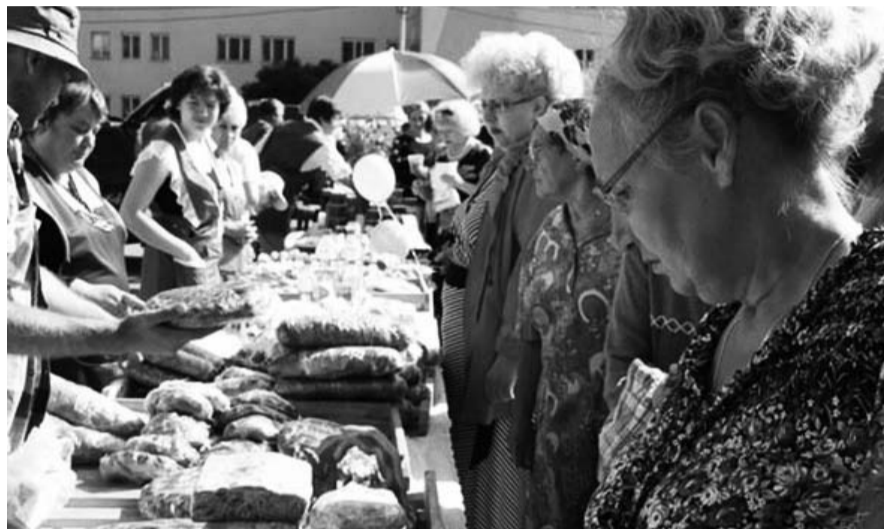
НА ФОТО: ЯРМАРКИ ОБЕСПЕЧАТ ГОРОЖАН ПРОДОВОЛЬСТВЕННЫМИ ТОВАРАМИ

Из-за введения правительством России санкций на ряд ввозимых из стран ЕС и США продуктов в некоторых регионах отмечается рост цен на различные виды продуктов до 50%. Мэрия Новосибирска сразу же взяла ситуацию под контроль и уверила жителей, что не допустит скачка цен на продовольствие.