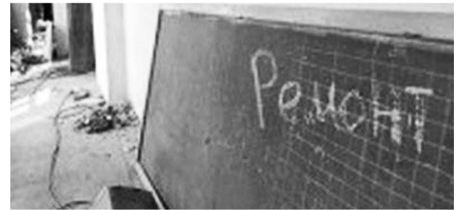
НА ФОТО: КОГДА ШКОЛЬНИКИ СМОГУТ ПРИСТУПИТЬ К УЧЕБЕ?