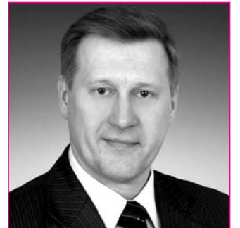
НА ФОТО: АНАТОЛИЙ ЛОКОТЬ

Первый секретарь Новосибирского обкома КПРФ, мэр Новосибирска Анатолий ЛОКОТЬ