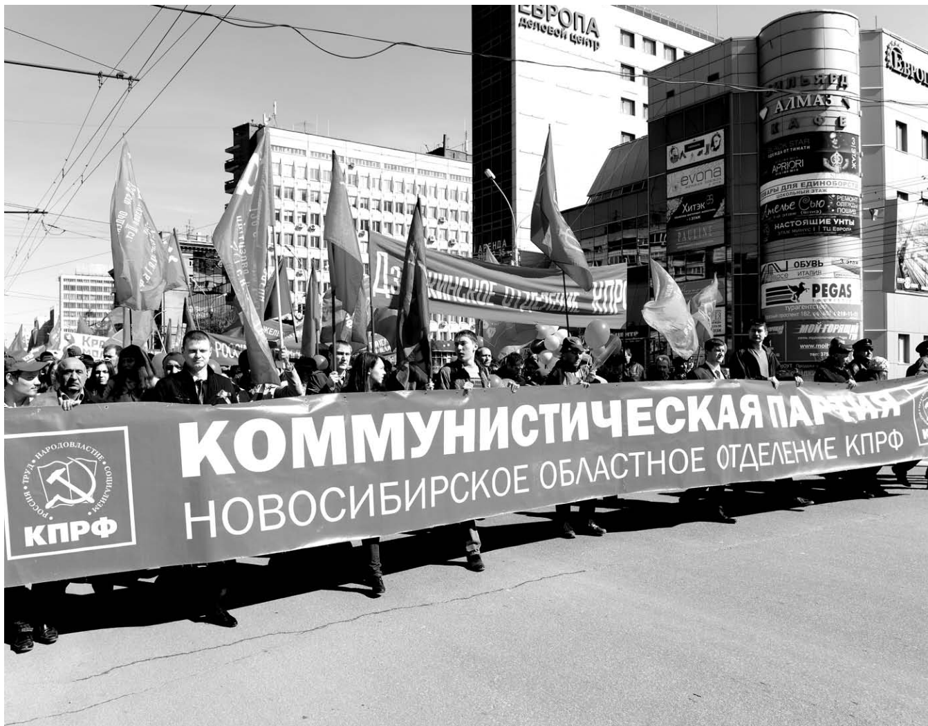
НА ФОТО: КОЛОННА КПРФ ПРОШЛА ПО КРАСНОМУ ПРОСПЕКТУ