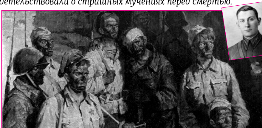
НА ФОТО: ЗАЩИТНИКИ АДЖИМУШКАЯ