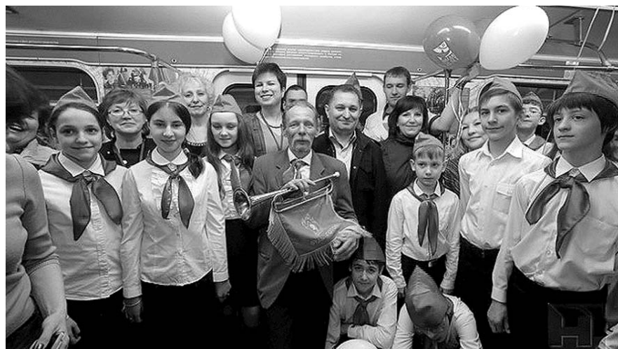
НА ФОТО: НА ОТКРЫТИИ ВЫСТАВКИ В ВАГОНЕ ПОЕЗДА-МУЗЕЯ

Борис ТРОПИНИН по материалу сайта «Новосибирские новости»