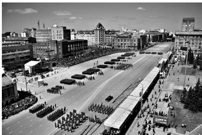
НА ФОТО: ПАРАД ПОБЕДЫ В НОВОСИБИРСКЕ

В 18.00 пройдет городской велопробег «Победа».