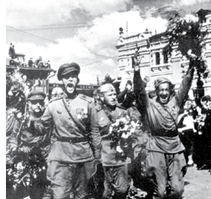
НА ФОТО: ПОБЕДА!

Деятели литературы и искусства опровергли латинскую поговорку: «Когда гремит оружие, музы молчат». Советские музы не молчали. Наши писатели, художники, музыкальные деятели,