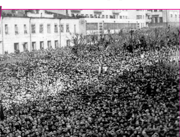
НА ФОТО: ПЛ. СВЕРДЛОВА В НОВОСИБИРСКЕ, 9 МАЯ 1945г.

— Вы участвовали в митинге, посвященном Победе 9 мая 1945 года в Новосибирске ранним утром. Расскажите подробнее об этом.