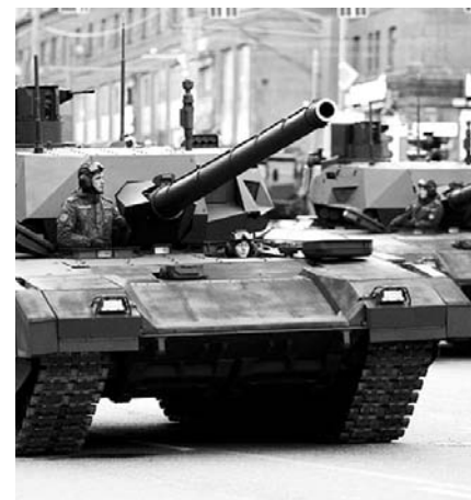
НА ФОТО: ТАНК Т-14 «АРМАТА»

применения электронно-компонентной базы нового поколения и некоторых других технических решений. Не секрет, что значительная часть работы танкистов на современных танках носит механический характер. Например, чтобы перевести вооружение из походного в боевое положение, наводчик-оператор выполняет около трех десятков операций, командир танка — около двух десятков. На «Армате» все это будет автоматизировано и роботизировано, человеку останется только верно оценивать обстановку, а также решать такие интеллектуальные задачи, как, допустим, распознавание образов. Автоматика пока не умеет это делать так, как может человек.