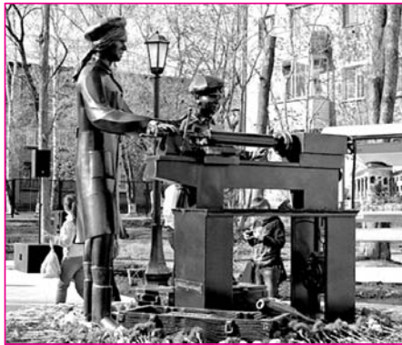
НА ФОТО: ОНИ ТРУДИЛИСЬ В ТЫЛУ

5 мая в честь 70-летия Победы в Дзержинском районе был открыт сквер, главным объектом которого стал памятник «Труженикам тыла». Это скульптурная композиция из металла, кото-