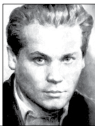
Николай МАЙОРОВ (1919-1942 г.г.)

Им не воздвигли мраморной плиты. На бугорке, где гроб землей накрыли. Как ощущение вечной высоты Пропеллер неисправный положили. И надписи отгранивать им рано — Ведь каждый небо видевший читал, Когда слова высокого чекана Пропеллер их на небе высекал. И хоть рекорд достигнут ими не был, Хотя мотор и сдал на полпути, Остановись, взгляни прямее в небо И надпись ту, как мужество, прочти. О, если б все с такою жадной жили! Чтоб на могилу им взамен плиты Как память взятой ими высоты Их инструмент разбитый положили И лишь потом поставили цветы.