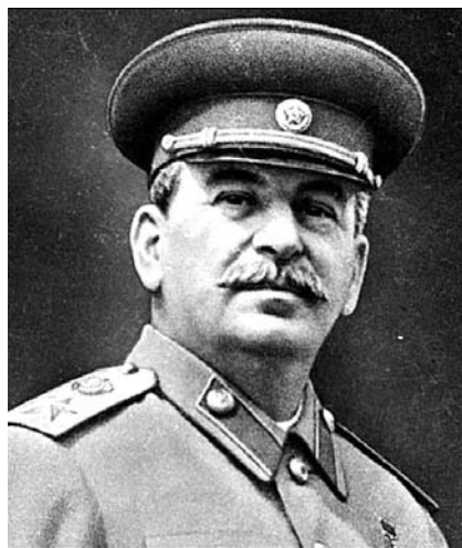
НА ФОТО: ИОСИФ ВИССАРИОНОВИЧ СТАЛИН

Одним словом, под каким углом ни пытайся прикинуть либеральную вер-