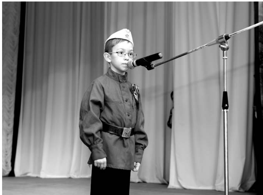
НА ФОТО: ИСКРЕННО И ЗВОНКО ЗВУЧАЛИ СО СЦЕНЫ СТИХИ

— Мы никогда не думали, что юбилей Победы будет иметь такой глубокий политический смысл. Распад Советского государства, отказ от Советского прошлого в союзных республиках, стремление перечеркнуть историю — все это привело к тяжелейшим событиям. Самый яркий пример является Украина. Если забудем историю, если не впечатаем в генетическую память уважение к Советскому Союзу, к подвигу нашего народа — у нас будет так же, как и там. Стремление переписать историю может дорого обойтись и нам. Сейчас вспомнили о Знамени Победы, произносят имена советских полководцев, Верховного