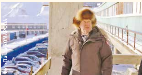
НА ФОТО: МЭР НОВОСИБИРСКА АНАТОЛИЙ ЛОКОТЬ НА СТРОЙКЕ НОВОЙ СТАНЦИИ МЕТРО «СПОРТИВНАЯ»

Во время пресс-подхода на Пленуме ЦК КПРФ лидер партии Геннадий ЗЮГАНОВ напомнил, что сегодня страна находится в очередном экономическом кризисе. Он подчеркнул, что «красные» руководители не дают своим городам и регионам остановиться в развитии, и привел в пример Новосибирск.