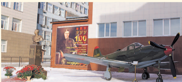
НА ФОТО: ПАМЯТЬ О ЗЕМЛЯКЕ УВЕКОВЕЧАТ В НОВОСИБИРСКЕ