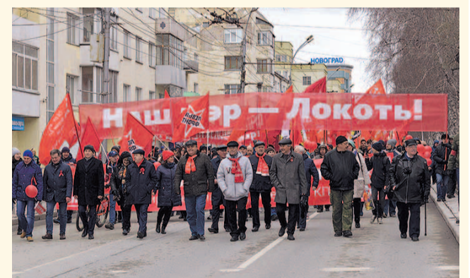
НА ФОТО: НОВОСИБИРСЦЫ ПОДДЕРЖИВАЮТ СВОЕГО МЭРА