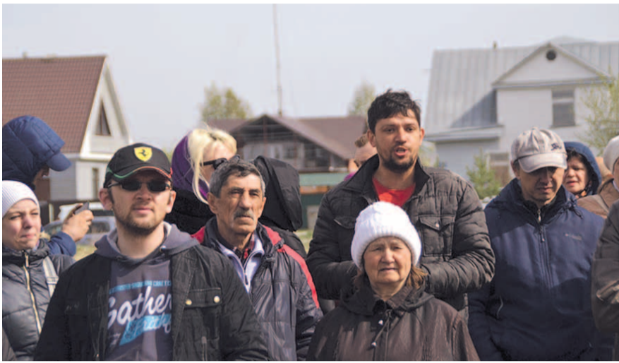
НА ФОТО: ЗАЩИТНИКИ ПАРКА НА МИТИНГЕ

На митинге выступили депутаты бердского Горсовета. Они отмечают, что, по генплану, вокруг строящихся школы и детского сада в Южном должен быть парк. Именно под школу перевели участок в зону Ж-3, предусматривающую жилищное строительство.