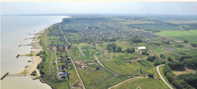
НА ФОТО: ПОСЕЛОК МОРСКОЙ