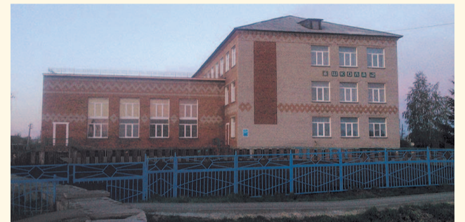
НА ФОТО: ШКОЛА №2, ГДЕ ОТРАВИЛИСЬ ДЕТИ