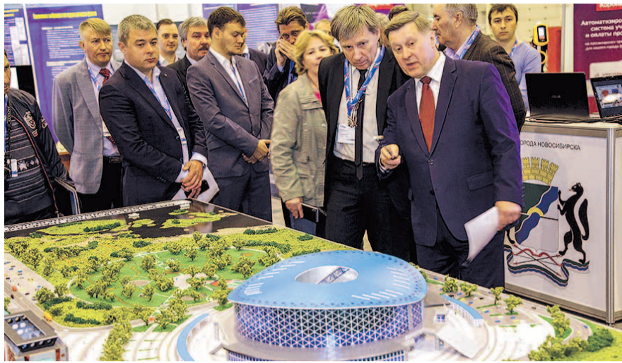
НА ФОТО: ВО ВРЕМЯ ПРЕЗЕНТАЦИИ ПРОЕКТА

— Мы готовы объявить тендеры на все шесть объектов. В ближайшее время рассчитываем получить экономическую экспертизу по проекту станции метро «Спортивная». Через несколько месяцев будем готовы объявить тендер, чтобы привлечь инвесторов. Уже