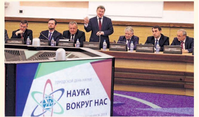
НА ФОТО: ПОДДЕРЖИВАТЬ НАУКУ НЕОБХОДИМО!