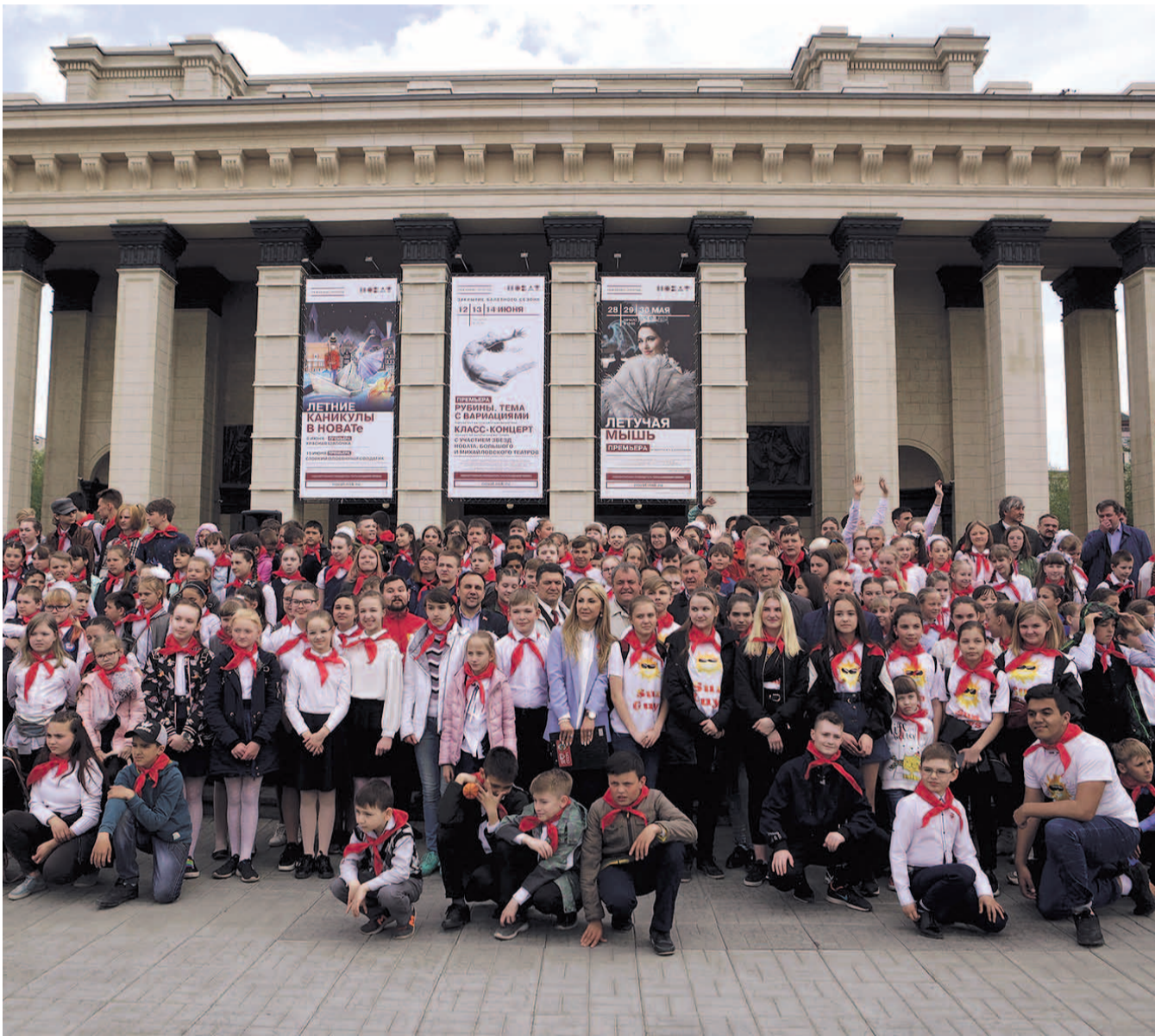
НА ФОТО: СЛАВНЫЕ ТРАДИЦИИ ПИОНЕРСКОГО ДВИЖЕНИЯ ВОЗРОДИЛИ В НОВОСИБИРСКЕ