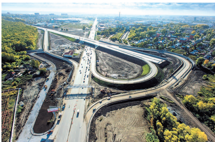
НА ФОТО: НОВЫЕ ДОРОГИ — АРТЕРИИ ГОРОДА