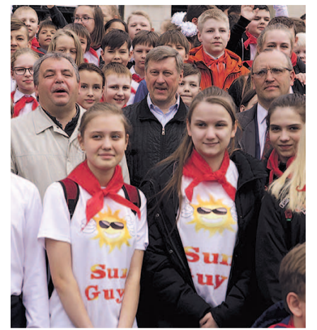
НА ФОТО: КОММУНИСТЫ ПОВЯЗАЛИ РЕБЯТАМ ПИОНЕРСКИЕ ГАЛСТУКИ