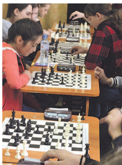
НА ФОТО: НА ТУРНИРЕ

19 мая в Куйбышевском доме детского творчества шахматисты со всего района выясняли, кто из них сильнейший. Изначально соревнования должны были проходить на приз мэра города, но, к сожалению, у главы Куйбышева на шахматистов денег не нашлось. Средства на проведение мероприятия пришлось срочно изыскивать депутатам-коммунистам. А желающих принять участие в турнире на этот раз оказалось рекордно много: