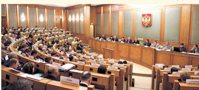
НА ФОТО: КОМИССИЯ ОТКЛОНИЛА ЗАКОНОПРОЕКТ КПРФ