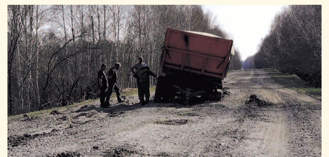
НА ФОТО: НЕПРОЕЗЖАЯ ДОРОГА

Жители Убинского района бьют тревогу: местный участок южной трассы — дорога между населенными пунктами Раисино и Убинка — пришел в полнейшую негодность, здесь практически ежедневно проваливаются автомобили. Капитального ремонта здешние дороги не видели уже несколько десятилетий.