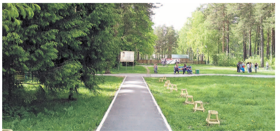
НА ФОТО: ПАРК «СОСНОВЫЙ БОР»

Рядом с будущим аквапарком — пихтовая аллея, посаженная еще в 2013 году. За шесть лет деревья, конечно, прижились, однако ухода за ними не было. Сейчас ситуация изменилась —