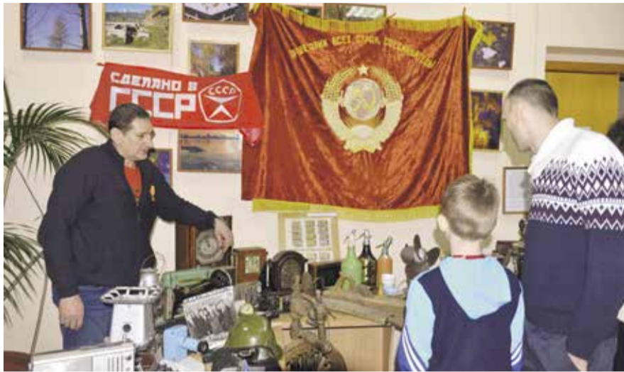
НА ФОТО: ВЫСТАВКА ПРЕДМЕТОВ БЫТА, СВЯЗАННЫХ С СОВЕТСКИМ СОЮЗОМ

— Коллекция собиралась 40 лет, значки покупались в магазинах, киосках, появлялись в период моей пионерской, комсомольской деятельности. Помню, как приобрел