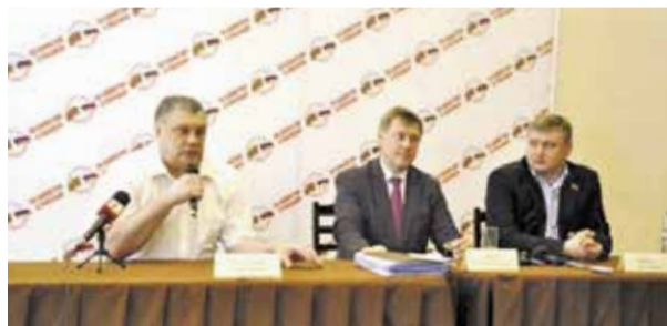
НА ФОТО: ПЕРВЫЙ СЕКРЕТАРЬ НОВОСИБИРСКОГО ОБКОМА КПРФ АНАТОЛИЙ ЛОКОТЬ НА ПРЕСС-КОНФЕРЕНЦИИ ПО ИТОГАМ ВИЗИТА В ПРИДНЕСТРОВЬЕ. ДВОРЕЦ КУЛЬТУРЫ ГОРОДА ТИРАСПОЛЯ.

6 декабря председатель ЦК Приднестровской коммунистической партии Олег ХОРЖАН вышел на свободу спустя 4,5 года после того, как был несправедливо осужден Верховным судом Приднестровской Молдавской Республики. Все это время за его освобождение боролись российские коммунисты.