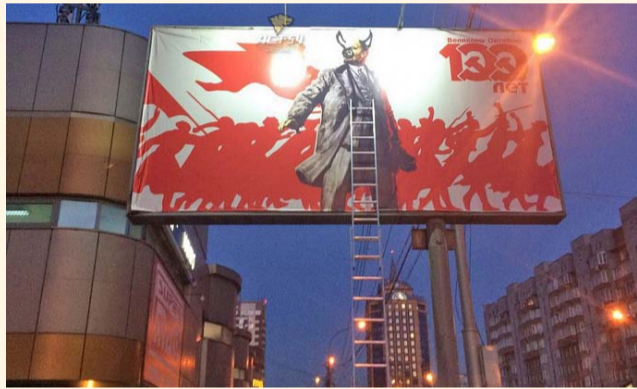
НА ФОТО: БДИТЕЛЬНЫЕ ГОРОЖАНЕ ОСТАНОВИЛИ НАРУШИТЕЛЯ