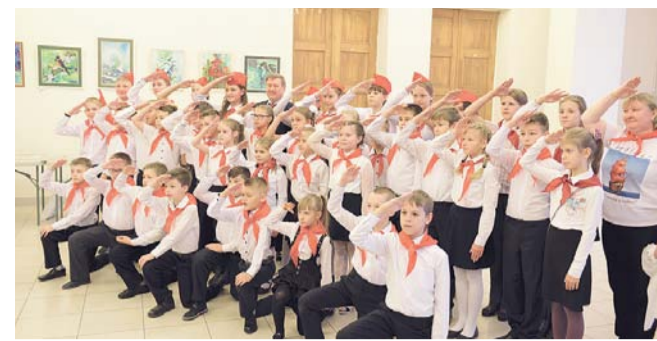
НА ФОТО: «БУДЬ ГОТОВ!». «ВСЕГДА ГОТОВ!»

Программу гала-концерта завершал ансамбль СибГУТИ «Воляр». Энергич-