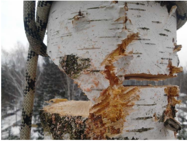
НА ФОТО: ЗАГОТОВКА ДРОВА — НЕПРОСТАЯ ЗАДАЧА

Откуда дровишки? — «Из лесу, вестимо; Отец, слышишь, рубит, а я отвожу». (В лесу раздавался топор дровосека...)