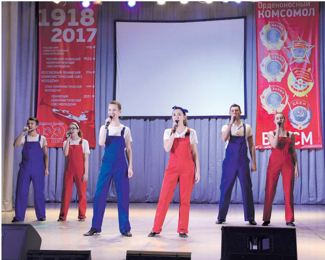
НА ФОТО: НА ГАЛА-КОНЦЕРТЕ ВЫСТУПИЛИ ПОБЕДИТЕЛИ ФЕСТИВАЛЯ КОМСОМОЛЬСКОЙ ПЕСНИ