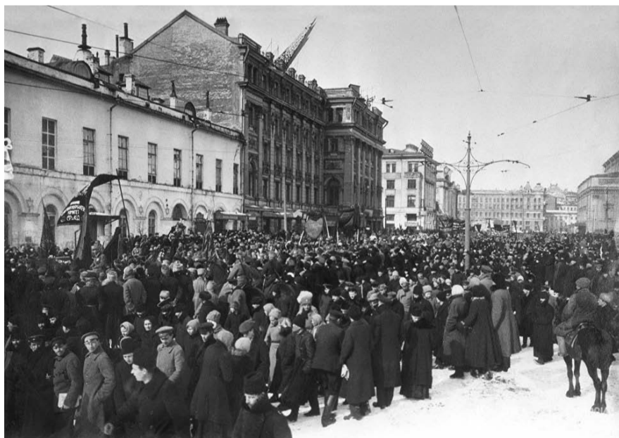
НА ФОТО: «КУЧКА ГОЛОДРАНЦЕВ» — НАРОДНЫЕ МАССЫ В ЕДИНОМ РЕВОЛЮЦИОННОМ ПОРЫВЕ

Один из известных стереотипов, который удалось услышать недавно, о том, что, дескать, ЛЕНИН собрал кучку «голодранцев» и совершил переворот. Во-первых, историки и политологи даже либерального толка, на днях обсуждая эту тему за «круглым столом» на центральном ТВ, пришли к выводу, что Октябрьская революция вполне закономерно называется Великой, как и французская, именно по количеству участвующей в ней массе народа и по своим результатам. Великий Октябрь совершил прорыв в будущее. Доселе человечество не знало такого строя, где трудящиеся путем участия в Советах могли управлять государством, были ликвидированы классовые сословия, народ получил невиданные ранее социальные завоевания — право на труд,