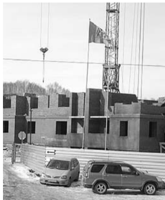
НА ФОТО: С ТАКИМ БЮДЖЕТОМ РАЗВИТИЕ ПОД ВОПРОСОМ