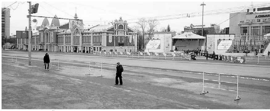
НА ФОТО: ВТОРОЙ ДЕНЬ ПРОНОСА ОГНЯ. РАДИ КОГО ПЕРЕКРЫВАЛИ ПЛОЩАДЬ?

Олимпийский факел, путешествующий в преддверии Олимпиады и прославившийся количеством «затуханий», в конце прошлой недели посетил Новосибирск, где, по подсчетам народных наблюдателей, потух в 65-й раз. На пронос главного спортивного огня по Новосибирской области было потрачено 24 млн рублей.