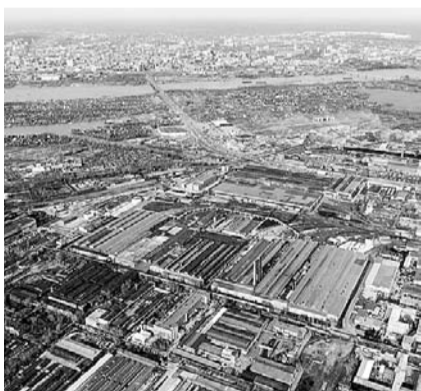
НА ФОТО: ТЕРРИТОРИЯ ЗАВОДА — 80 ГА

Руководство металлургического завода им. Кузьмина подало заявление в арбитраж с просьбой признать предприятие банкротом, так как оно не в состоянии погасить долги одновременно с выплатами 1,6 млрд рублей по мировому соглашению, которым закончилось предыдущее банкротство. Работники завода обратились к депутатам-коммунистам с просьбой помочь защитить их трудовые права в процессе сокращения.