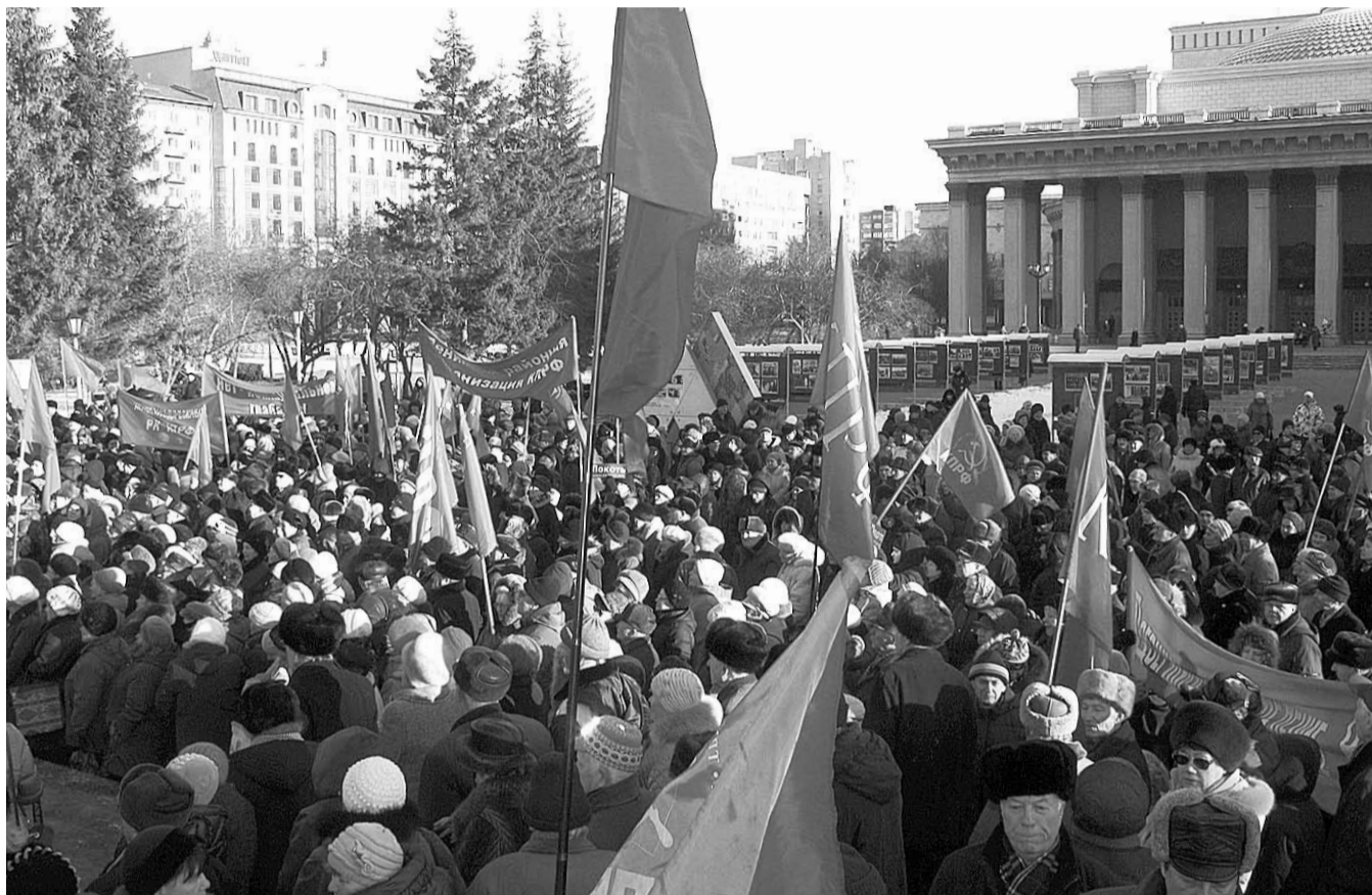
НА ФОТО: НА МИТИНГ 8 ДЕКАБРЯ ПРИШЛО БОЛЕЕ 3,5 ТЫСЯЧИ НОВОСИБИРЦЕВ