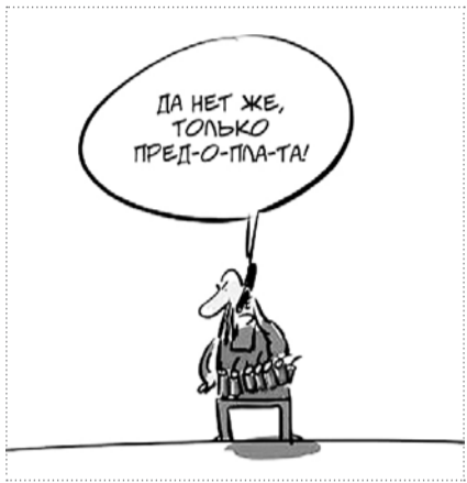
НА РИС.: ДЕНЬГИ ВПЕРЕД!

Считалось, что это экономично, программа широко пропагандировалась. Но, по словам депутата Законодательного собрания Новосибирской области Вадима АГЕЕНКО, депутаты-коммунисты говорили, что не нужно топиться переходить на газ, и были