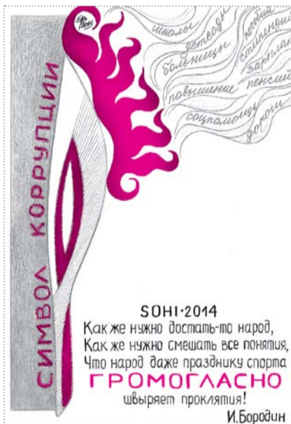
Карикатура Елены Влазневой

С работы отпустили пораньше, чтобы я могла проскочить из центра — с метро «Красный проспект» на свой Западный жилмассив. Благополучно проехав в переполненных вагонах до станции «Карла Маркса», я так же благополучно, облегченно вздохнув, погрузилась в автобус №1137. Автобусов в нашем направлении, надо сказать, скопилось много. Не доехав квартала полтора до «Площади им. Станиславского», автобус остановился. Пассажиры начали выглядывать в окна и обнаружили, что вся улица запружена транспортом, движущимся в