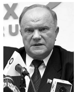
НА ФОТО: ЛИДЕР КПРФ

10 декабря Государственная дума обсудила проект заявления «О ситуации на Украине». При обсуждении документа в зале заседаний выступил Председатель ЦК КПРФ, лидер фракции КПРФ Геннадий ЗЮГАНОВ. Предлагаем вашему вниманию текст его выступления.