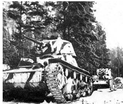
НА ФОТО: ТАНКИ Т-26 ИЗ СОСТАВА 20-Й ТАНКОВОЙ БРИГАДЫ НА ПОДСТУПАХ К МОСКВЕ. НОЯБРЬ 1941 ГОДА

ных подступах к Москве. На севере же немцам удалось приблизиться к городу на 25-30 км, выйдя в район Крюкова и Красной Поляны.