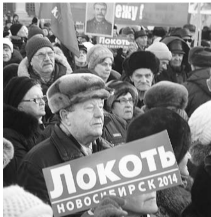
НА ФОТО: ЛЮДИ ПРИШЛИ НА МИТИНГ С ТАБЛИЧКАМИ «ЛОКОТЬ. НОВОСИБИРСК. 2014»

— Именно это правительство Российской Федерации преподнесло жителям страны очередной «новогодний подарок». Недобирают, оказывается, управляющие компании, монополисты в ходе оплаты ЖКХ, поэтому придумали новую идею. Давайте платить за услуги ЖКХ авансом! Услуга не оказана, а за нее уже требуют плату, — раскритиковал Анатолий Локоть инициативу председателя правительства Дмитрия МЕДВЕДЕВА . — Дома из-за аварий и