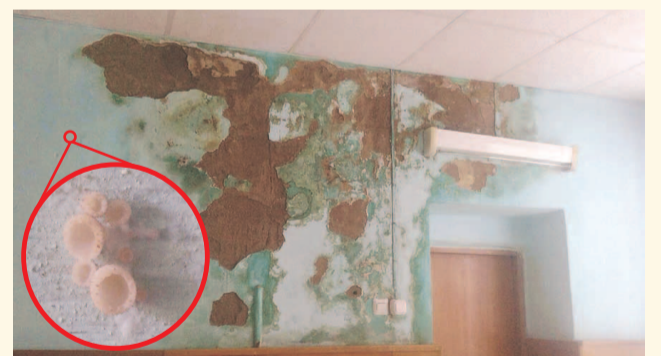
НА ФОТО: «УРОЖАЙ» НА СТЕНАХ АМБУЛАТОРИИ

В ФАПе села Елбань Маслянинского района можно собирать грибы, не выходя из помещения амбулатории.