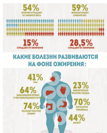
НА ФОТО: РОССИЯ ЗАНИМАЕТ 5 МЕСТО ПО УРОВНЮ ОЖИРЕНИЯ

Ожирение, конечно, старо, как само человечество, но только сейчас эта болезнь цивилизации приобрела харак-