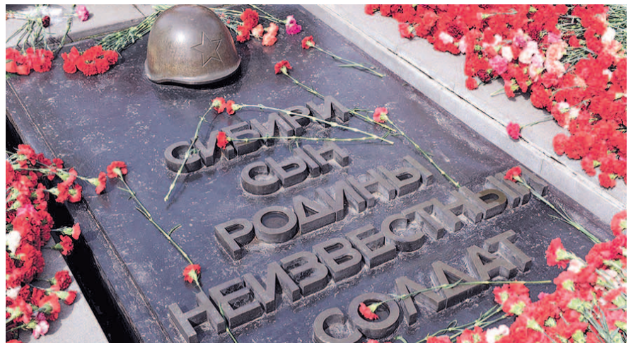
НА ФОТО: ГОРОЖАНЕ ПРИНЕСЛИ ГВОЗДИКИ ДЛЯ ПОБЕДИТЕЛЕЙ

— Уважаемые товарищи новосибирцы! Дорогие ветераны! 51 год подряд жители города приходят сюда, в это святое для нас место для того, чтобы