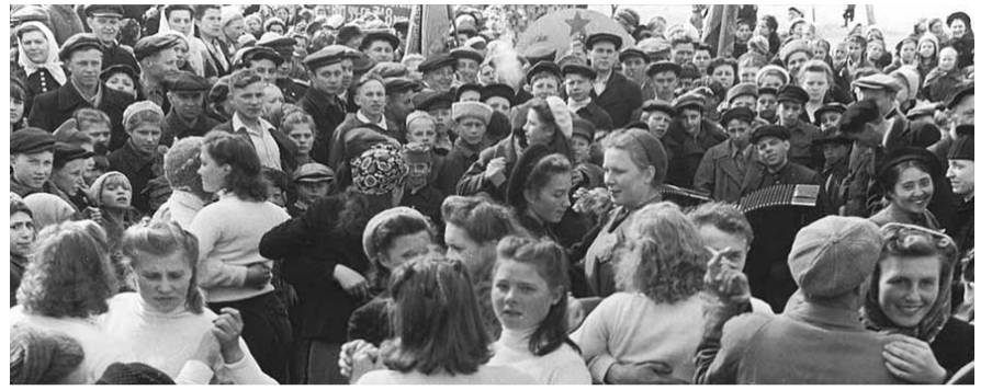
НА ФОТО: ПОБЕДНЫЙ ВАЛЬС В НОВОСИБИРСКЕ 9 МАЯ 1945 ГОДА

Как встречали утро Победы в Новосибирске