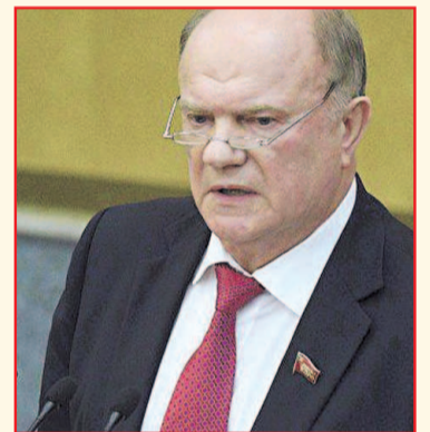
НА ФОТО: ГЕННАДИЙ ЗЮГАНОВ

— Для того, чтобы реализовать эту программу, требуется дополнительно минимум десять триллионов рублей уже завтра. Где они возьмут эти деньги? Это наш главный вопрос, на который мы так и не услышали ответа ни от Президента, ни от кандидата в премьеры. Без этих денег невозможно провести модернизацию, решить социальные проблемы, совершить прорыв в области инноваций, — заметил лидер российских коммунистов.