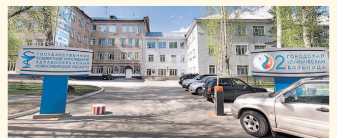
НА ФОТО: поликлиники должны контролироваться городом