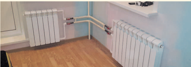
НА ФОТО: ОТОПЛЕНИЕ ОТКЛЮЧАТ, КОГДА СТАНЕТ ТЕПЛО