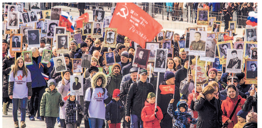
НА ФОТО: НОВОСИБИРСКИЙ БЕССМЕРТНЫЙ ПОЛК

Чтобы дождаться движения колонны и не замерзнуть, новосибирцы пели песни и играли на музыкальных инструментах.