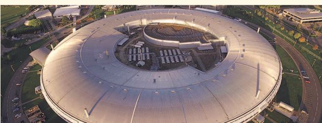
НА ФОТО: БРИТАНСКИЙ СИНХРОТРОН «DIAMAND». СКОРО ПОДОБНАЯ УСТАНОВКА ПОЯВИТСЯ В НОВОСИБИРСКЕ