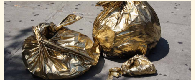
НА ФОТО: для кого дно мусорной ямы — золотое?