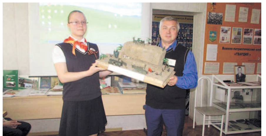
НА ФОТО: МАКЕТ ДИОРАМЫ «ЗАЙЦЕВА ГОРА. ИСТОРИЯ ШТУРМА»

Учитель ОБЖ из этой школы уже несколько лет принимает участие во всероссийских вахтах памяти, из которых привозит много интересных предме-