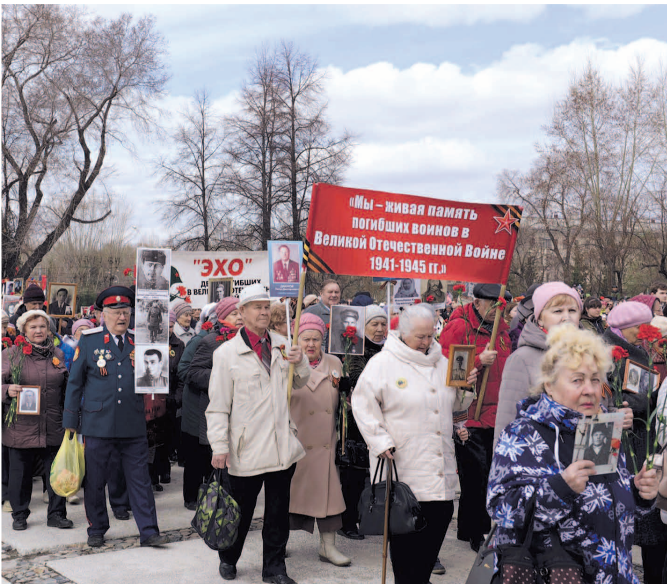
НА ФОТО: В ДЕНЬ ПОБЕДЫ НОВОСИБИРЦЫ ОТДАЛИ ДАТЬ ПАМЯТИ ВОИНАМ, ЗАЩИТИВШИМ НАШУ СТРАНУ ОТ ФАШИСТСКИХ ЗАХВАТЧИКОВ