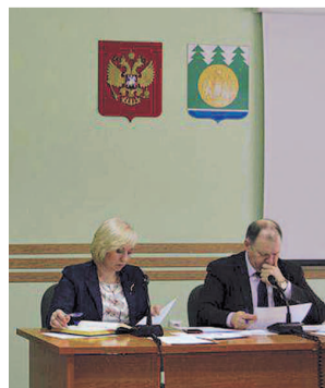
НА ФОТО: В ХОДЕ СОВЕЩАНИЯ

— При этом сумма субсидий зачастую очень маленькая, в некоторых хозяйствах сумма выплаченных налогов превышает ее в 1,5-2 раза, — отмечали выступавшие руководители сельскохозяйственных предприятий района, — существует и большая проблема с ценой на топливо. Если динамика роста цен останется на таком же высоком уровне, то уборочная кампания может оказаться под угрозой срыва.