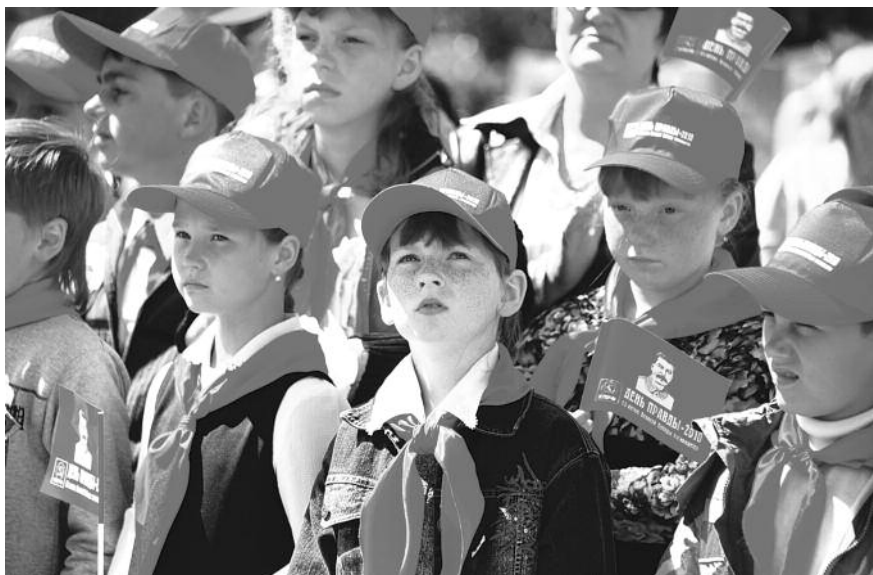
● НА ФОТО: ПИОНЕРЫ НОВОСИБИРСКОЙ ОБЛАСТИ НА «ДНЕ ПРАВДЫ-2010»

Первый секретарь Новосибирского обкома КПрФ, депутат Госдумы Анатолий ЛОКОТЬ отмечает, что «День правды» — это не столько политическое мероприятие, сколько праздник для всех новосибирцев.