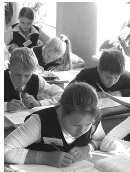
● НА ФОТО: ШКОЛУ №74 ОСТАВИЛИ В ПОКОЕ. НАДОЛГО ЛИ?