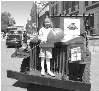
● НА ФОТО: «ДЕНЬ ПРАВДЫ» — ПРАЗДНИК ДЛЯ ВСЕЙ СЕМЬИ

Первый секретарь Новосибирского обкома КПрФ, депутат Госдумы Анатолий ЛОКОТЬ отмечает, что «День правды» — это не столько политическое мероприятие, сколько праздник для всех новосибирцев.