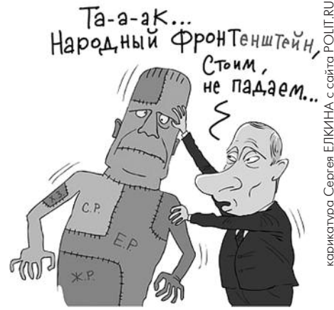
● НА РИС.: ЛЕПЯТ ИЗ ТОГО, ЧТО БЫЛО

Под Обращением перечислены всего лишь небольшие общественные организации. Здесь, в частности, нет таких извест-