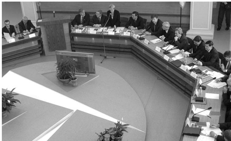
● НА ФОТО: ИДЕТ СЕССИЯ СОВЕТА ДЕПУТАТОВ ГОРОДА НОВОСИБИРСКА