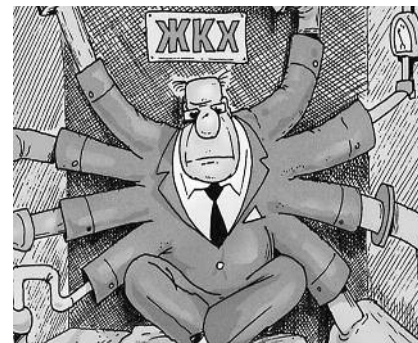
● НА РИС.: ДЕНЬГИ, КОТОРЫЕ ТРАТЯТ ЖИЛИЩНИКИ ОТСЛЕДИТЬ НЕ ТАК ПРОСТО