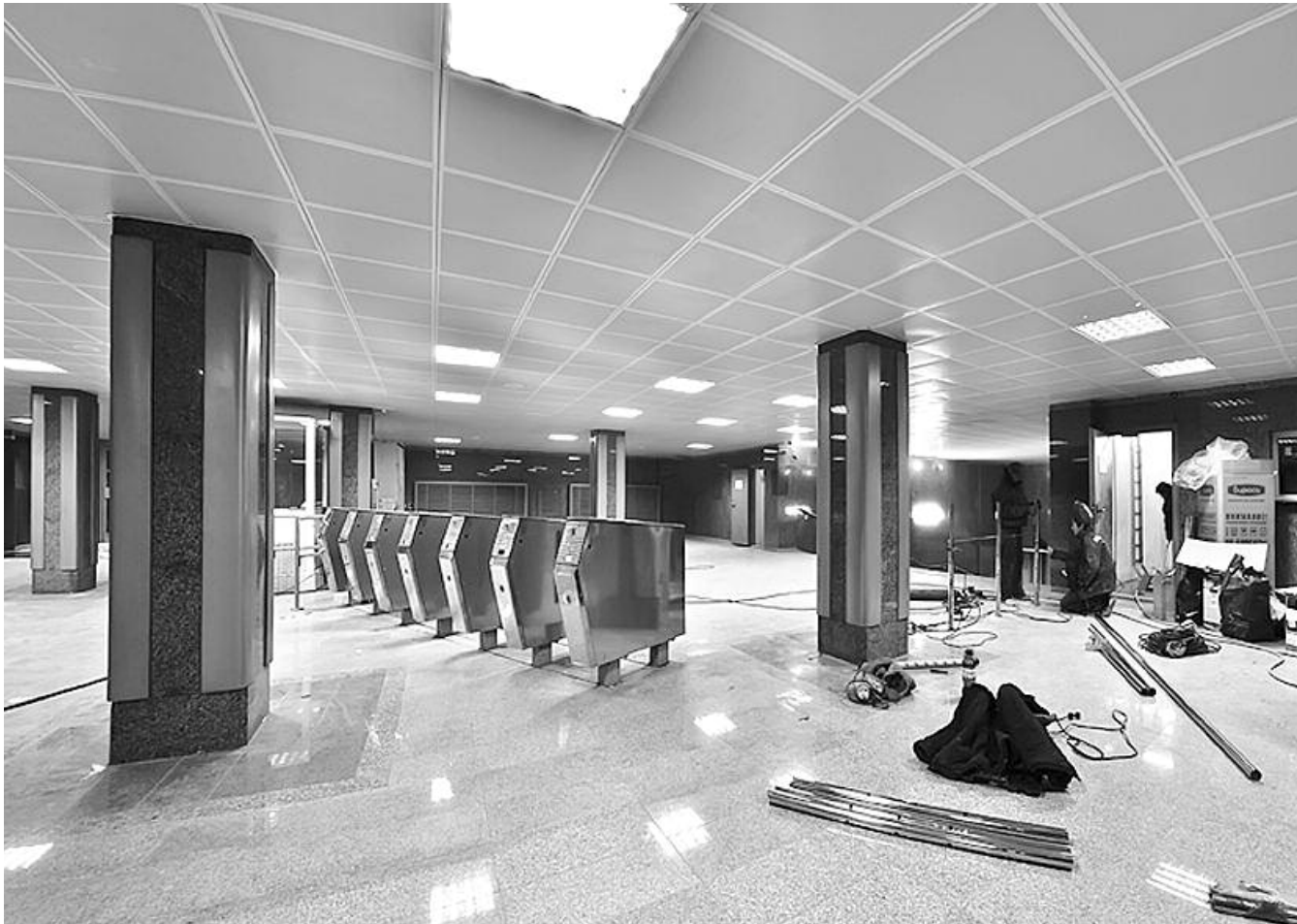
● НА ФОТО: СТАНЦИЯ МЕТРО «ЗОЛОТАЯ НИВА» РАБОТАЕТ, ОДНАКО ДЕНЬГИ ПОДРЯДЧИКИ ТАК ДО СИХ ПОР И НЕ УВИДЕЛИ