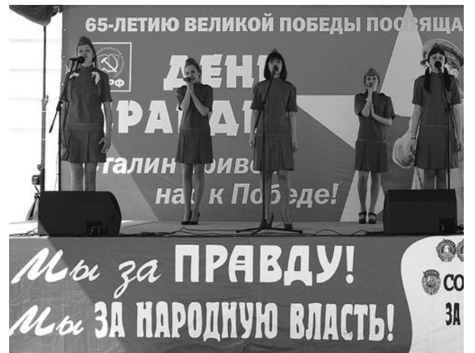
● НА ФОТО: ГЛАВНАЯ СЦЕНА ФЕСТИВАЛЯ «ДЕНЬ ПРАВДЫ—2010»

4 июня в центре Новосибирска, в Первомайском сквере пройдет очередной, уже 4-й фестиваль. Традиционно весь день на всей территории сквера будет работать десяток различных площадок, где каждый новосибирец может найти себе занятие по интересу.