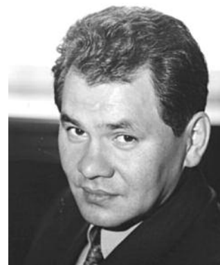
● НА ФОТО: ХОЗЯИН «КОЛЕСНИЦЫ»