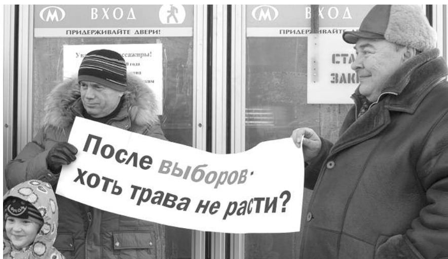
● НА ФОТО: ПИКЕТ У ЗАКРЫТОЙ СТАНЦИИ «ЗОЛОТАЯ НИВА» 28 НОЯБРЯ 2010 ГОДА