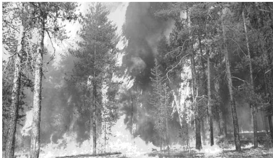
● НА ФОТО: ПОЖАРЫ БЕЗЖАЛОСТНО УНИЧОЖАЮТ СИБИРСКИЙ ЛЕС