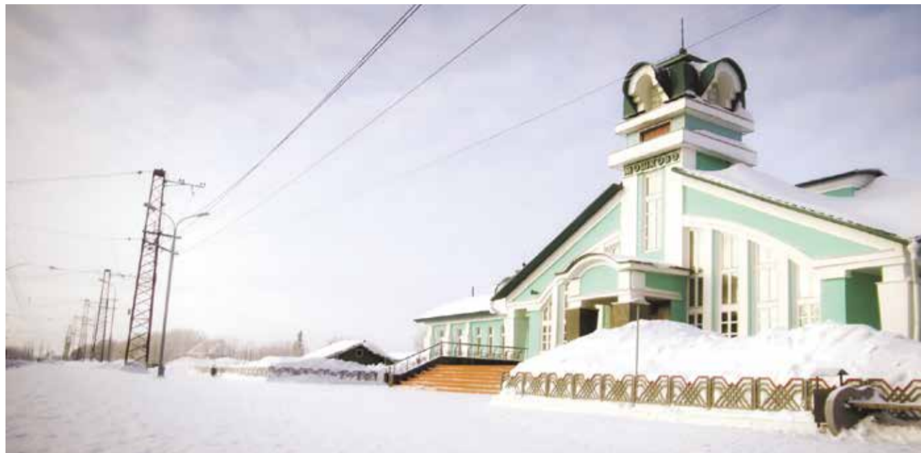
НА ФОТО: ЖЕЛЕЗНОДОРОЖНАЯ СТАНЦИЯ В ПОСЕЛКЕ МОШКОВО

Пять лет назад жители Мошково попросили депутата Госдумы от «Единой России» Александра Жукова помочь построить стадион в центре поселка. Под площадку вырубил парк, засыпали щебнем, и на этом дело остановилось. Дальше началась череда обещаний.