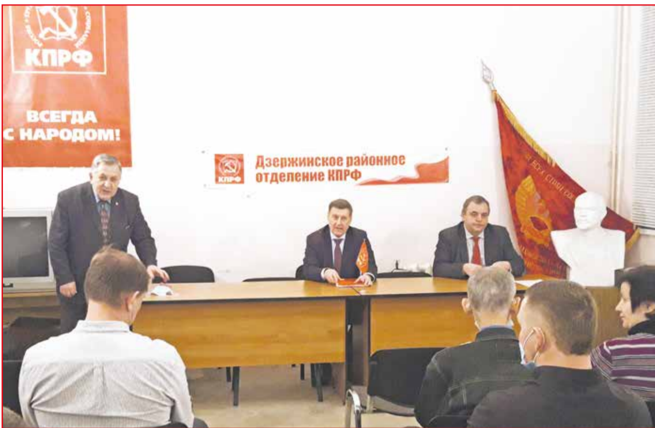
НА ФОТО: ВСТРЕЧА ПЕРВОГО СЕКРЕТАРЯ НОВОСИБИРСКОГО ОБКОМА КПРФ АНАТОЛИЯ ЛОКТА С ПАРТИЙНЫМ АКТИВОМ ДЗЕРЖИНСКОГО РАЙОНА