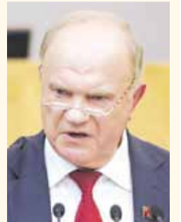
НА ФОТО: ПРЕДСЕДАТЕЛЬ ЦК КПРФ ГЕННАДИЙ ЗЮГАНОВ

— Новый президент США Байден приступил к работе, и первый его шаг — обращение в Госдепе к международной общественности — широко освещали мировые СМИ. Как и первый договор, который Байден подписал, — о продлении СНВ-3: он считает, что это соответствует американскими интересам и дает ему время для раскручивания своей политики.