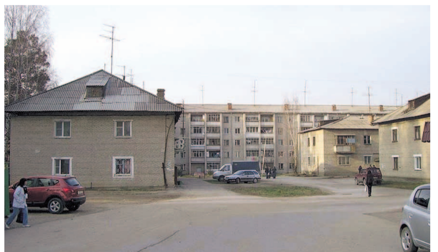
НА ФОТО: ПОСЕЛОК ОСТАЛСЯ БЕЗ ГАЗА, А ЗНАЧИТ, БЕЗ ТЕПЛА

— А поставщик газа сказал: «Все, ребята, деньги не перечисляете, задолженность большая», и перекрыл маги-