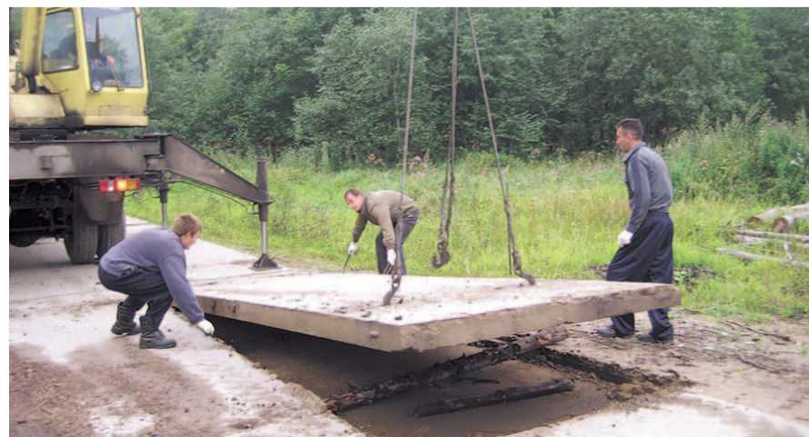
НА ФОТО: КОММЕРСАНТЫ РАЗБИРАЮТ ГОССОБСТВЕННОСТЬ НА ПРОДАЖУ

В конце 80-х годов прошлого века в трех километрах от Чистоозерного воинской летной частью из города Камень-на-Оби был построен аэродром военного и гражданского назначения. Активно функционировал по прямому назначению объект совсем недолго: часть свернулась и передислоцировалась обратно в Камень-на-Оби. Но территория аэродрома, являвшегося собственностью Министерства обороны, охранялась.