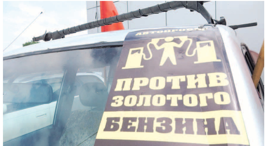
НА ФОТО: НОВОСИБИРЦЫ ТРЕБУЮТ ОСТАНОВИТЬ РОСТ ЦЕН НА БЕНЗИН