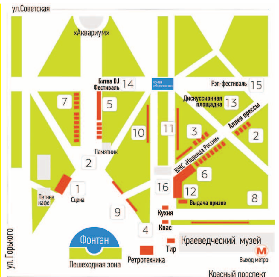
НА ФОТО: СХЕМА ПЛОЩАДОК ФЕСТИВАЛЯ «ДЕНЬ ПРАВДЫ» В ПЕРВОМАЙСКОМ СКВЕРЕ