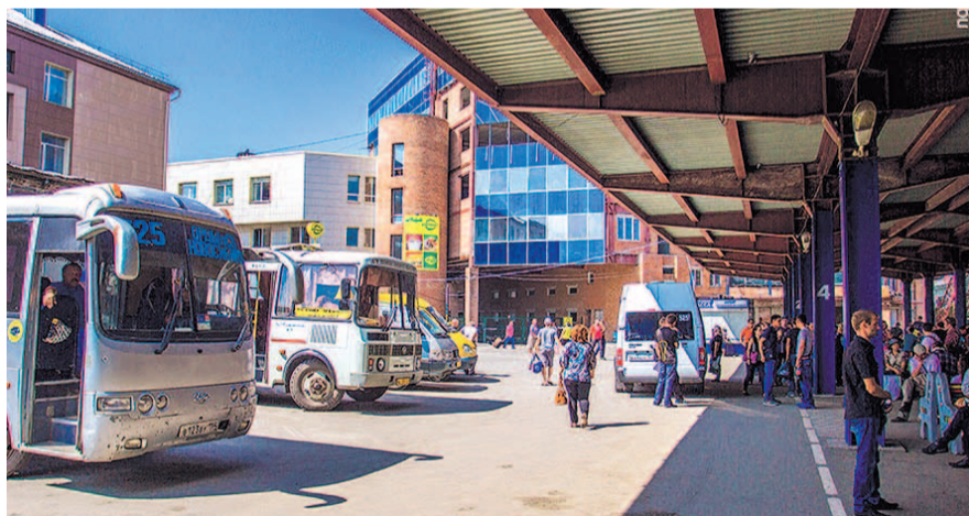
НА ФОТО: СТАРЫЙ ВОКЗАЛ ТАК И НЕ ДОЖДАЛСЯ ОКОНЧАНИЯ РЕКОНСТРУКЦИИ

Перед посещением объекта Анатолий Локоть провел работу с картой: автовокзал — стратегический городской объект, строительство которого кардинально изменит городскую транспортную сетку. Планируется организация экспресс-маршрутов для автобусов и трамваев, которые свяжут объект со станциями метро, кроме того, дальнейшее развитие получат остановочные пункты, на которых пассажиры получают возможность приобрести би-