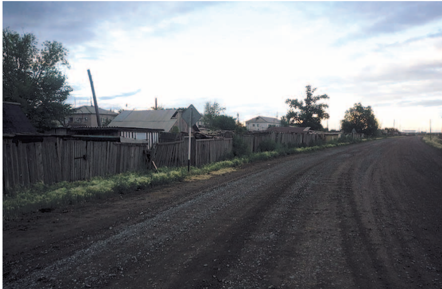
НА ФОТО: ШЕБЕНОЧНЫЕ И ГРУНТОВЫЕ ДОРОГИ НЕ ГОДЯТСЯ ДЛЯ РЕЙСОВОГО АВТОБУСА

— Глава района нам сразу отписался, что ширина дорожного полотна не