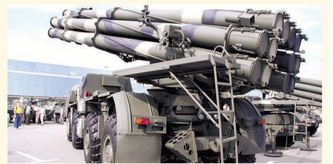
НА ФОТО: УСТАНОВКА «ТОРНАДО-С»