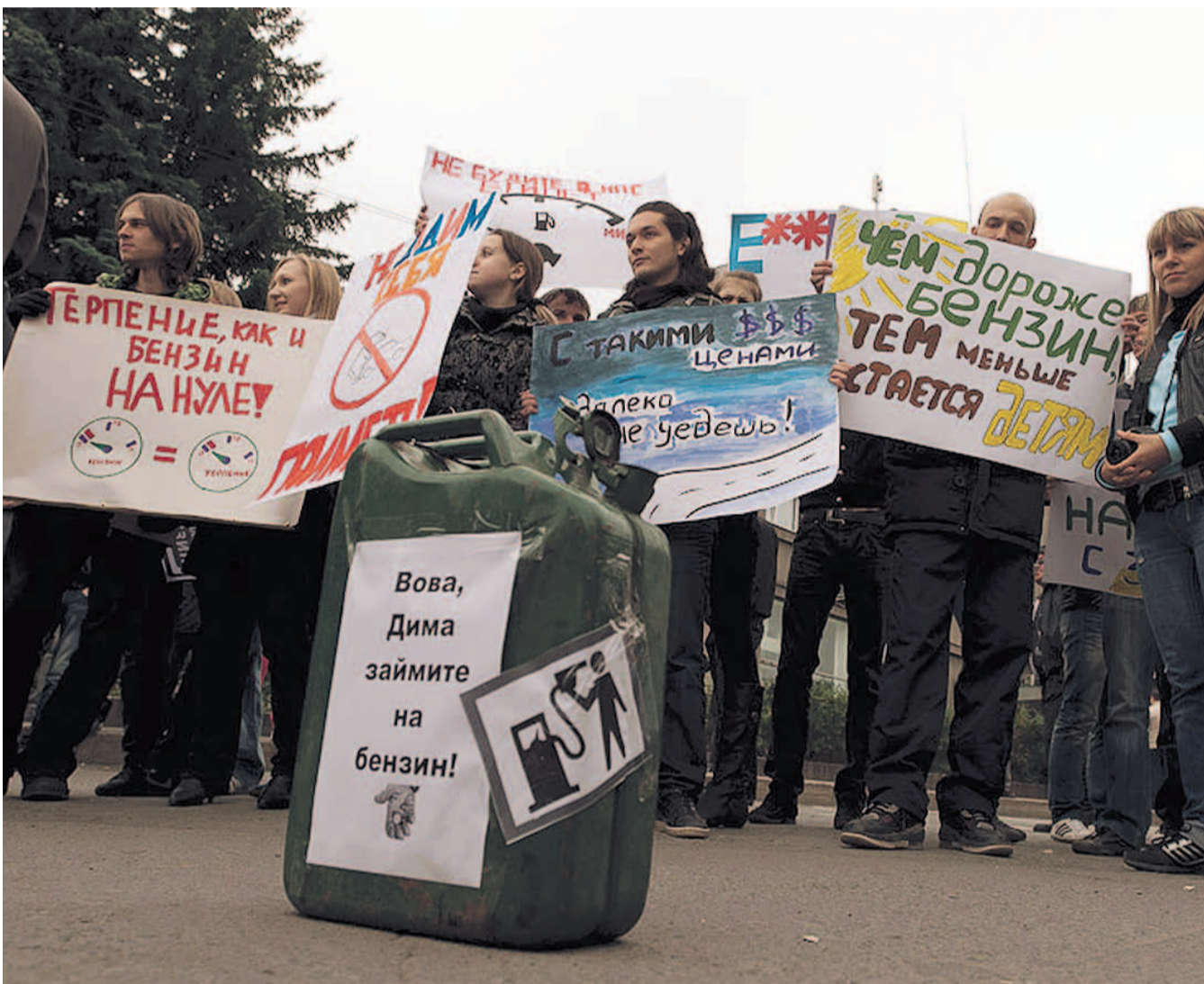
НА ФОТО: РОСТ ЦЕН НА БЕНЗИН РАЗГОНЯЕТ ИНФЛЯЦИЮ