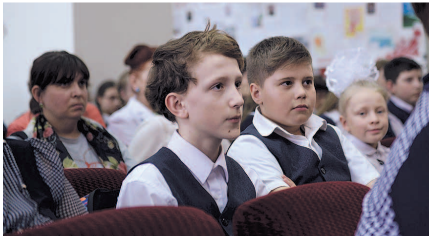
НА ФОТО: НА КОНКУРСЕ, ПРОВЕДЕННОМ ВЖС «НАДЕЖДА РОССИИ»

В эпоху СССР страны с социалистическим курсом развития активно подержали нововведенный праздник. С