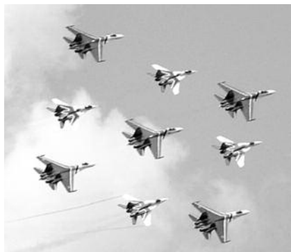
● НА ФОТО: «СТРИЖИ» ДОЛЕТАЛИСЬ...

— При таких методах от авиации скоро ничего не останется. Благодаря министру