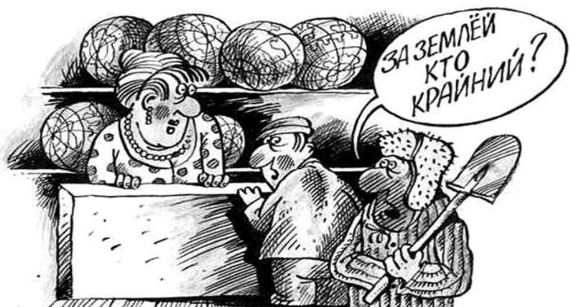
● НА РИС.: В ОЧЕРЕДЬ, СУКИНЫ ДЕТИ!

Жители села Александровка Маслянинского района