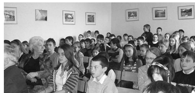
● НА ФОТО: «УРОК МУЖЕСТВА» В ШКОЛЕ №47

Готовиться к этому уроку мы начали заранее. Выучили стихи, тексты и всем классом спели песню «Прощайте, скалистые горы!». Посмотрели очень познавательный видеоклип и репортаж об этом городе. Мурманск знаменит тем, что за всю войну на его землю не ступал фашистский сапог, хотя вся земля усеяна останками его защитников. При подготовке к уроку мы посетили Музей водного транспорта при Речном училище. Мы узнали, что наши комсомольцы во время войны собрали средства на постройку подводной лодки, которую назвали «Новосибирский комсомолец». Они подарили ее Северному флоту. Экипаж этой лодки совершил много героических подвигов. И самое интересное, что эта подводная лодка до сих пор служит нашему Отечеству и держит связь с нашим городом.