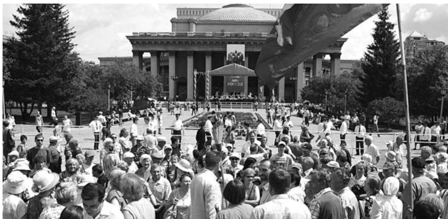
■ НА ФОТО: ПРОТЕСТУЮЩИХ НОВОСИБИРСЦЕВ (НА ПЕРЕДНЕМ ПЛАНЕ) ОКАЗАЛОСЬ В РАЗЫ БОЛЬШЕ ПРАЗДНУЮЩИХ ГОРОЖАН, ПРИШЕДШИХ НА КОНЦЕРТ У ОПЕРНОГО ТЕАТРА (НА ЗАДНЕМ ПЛАНЕ)