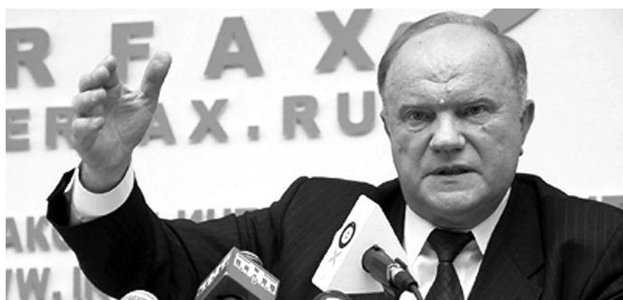
● НА ФОТО: ПРЕДСЕДАТЕЛЬ ЦК КПРФ ГЕННАДИЙ ЗЮГАНОВ

Новый цикл федеральных выборов начнется вслед за существенным осложнением социально-экономической ситуации в стране. Удары мирового экономического кризиса исключительно болезненно сказались на положении дел в России. При этом наиболее комфортно чувствует себя в этих условиях группа лиц, скопивших басно-