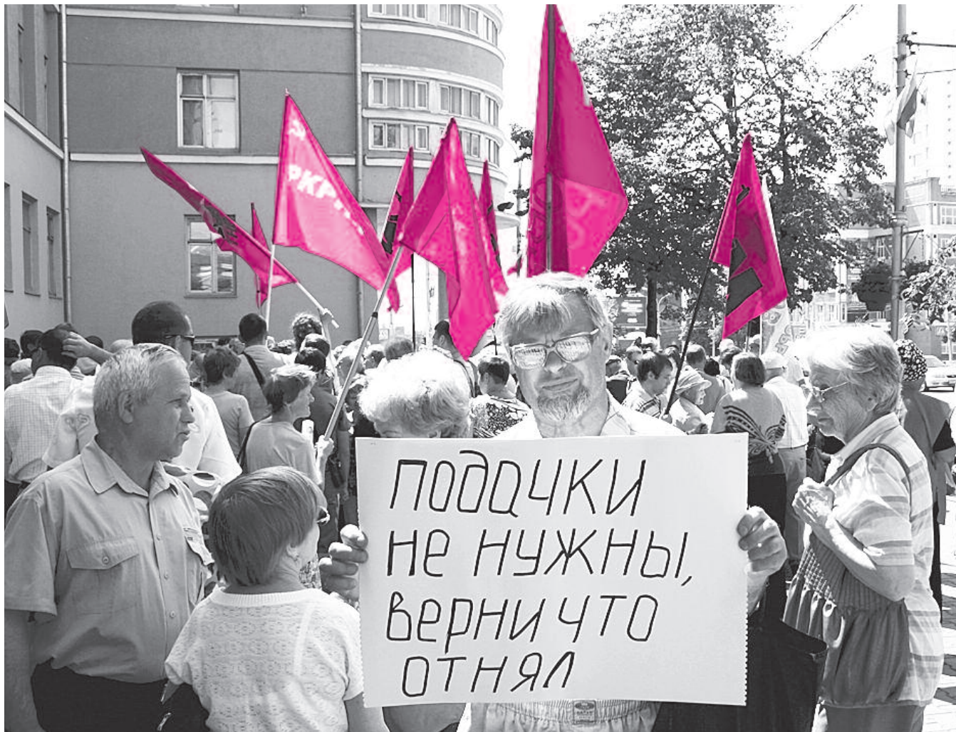
● НА ФОТО: ПЕНСИОНЕРЫ НОВОСИБИРСКА ПРОДОЛЖАЮТ ОТСТАИВАТЬ ПРАВО НА БЕЗЛИМИТНЫЙ ЛЬГОТНЫЙ ПРОЕЗД