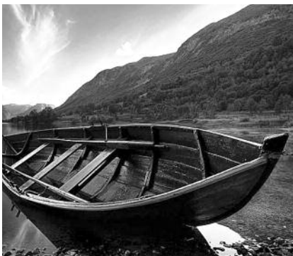
● НА ФОТО: БРАТЬЯ РАНО НАУЧИЛИ СЕСТРЕНКУ УПРАВЛЯТЬ ЛОДКОЙ-ОБЛАСКОМ

Братья рано научили сестренку плавать, управлять маленькой лодкой-обласком.