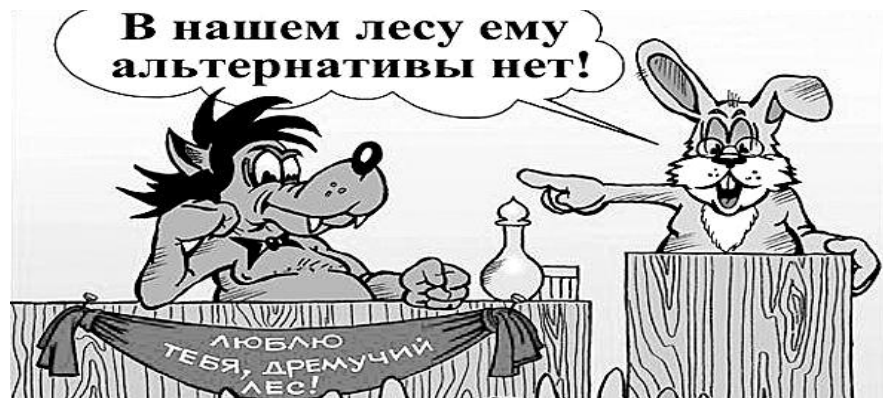
● НА РИС.: ГРАЖДАНЕ РОССИИ НЕ ВЕРЯТ В ЧЕСТНЫЕ И СВОБОДНЫЕ ВЫБОРЫ

— В 1995 году наступило полное разочарование реформами, ЕЛЬЦИНЫМ , несоответствие ожиданий тому, что уже произошло, — говорит Лев Гудков. — Отсутствие людей, которые могли бы помочь понять, что происходит. И главное — это впервые начавшаяся тогда работа PR. Пошла массовая накачка, манипулирование общественным мнением, и люди поняли, что их помимо воли заставляют что-то делать. И президентские выборы