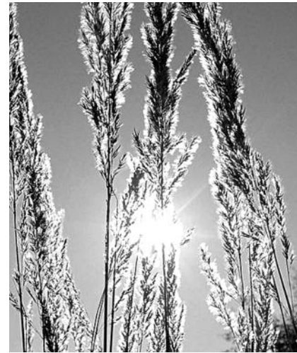
● НА ФОТО: СИБИРСКИЙ ВАСИЛЬКОВЫЙ ЛЕН