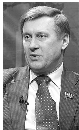
● НА ФОТО: АНАТОЛИЙ ЛОКОТЬ

Эксперт в области российско-белорусских отношений, член Парламентского Собрания Белоруссии и России, депутат Госдумы, член фракции КПРФ Анатолий ЛОКОТЬ рассказал в интервью газете «За народную власть!» о причинах экономических проблем в Белоруссии, о возможных вариантах развития событий и о позиции и поведении России по отношению к союзной Белоруссии.