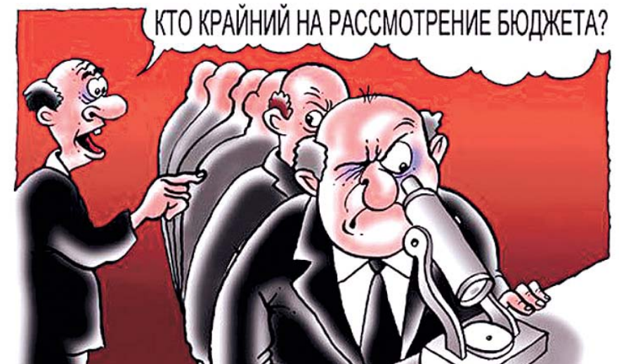
НА ФОТО: ОБЯЗАННОСТИ ЕСТЬ, А СРЕДСТВ НА ИХ ИСПОЛНЕНИЕ — НЕТ