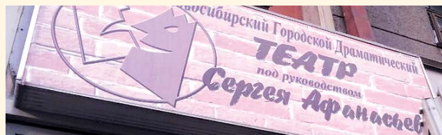
НА ФОТО: У ТЕАТРА НАКОНЕЦ-ТО ПОЯВИТСЯ СВОЕ ЗДАНИЕ