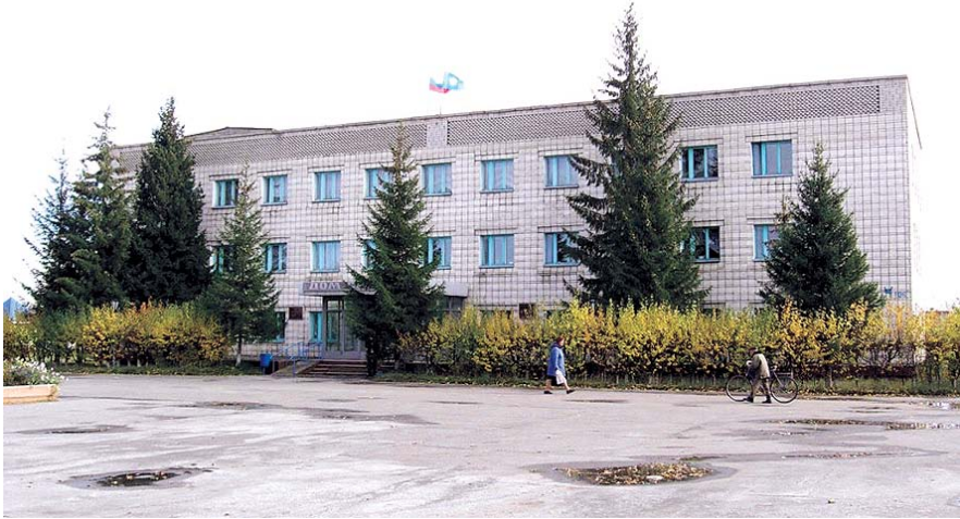
НА ФОТО: АДМИНИСТРАЦИЯ ДОВОЛЕНСКОГО РАЙОНА

Когда председатель Комиссии по бюджету предложил администрации рассказать о принимаемых мерах по стабилизации экономики в районе, это даже замешательства не вызвало. Председатель предложила это сделать на следующей сессии, т.е. на данный момент