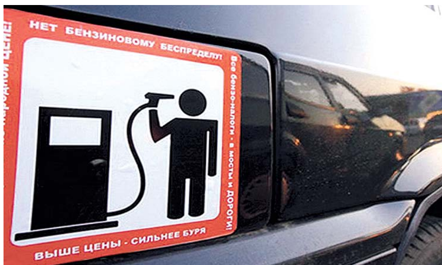
НА ФОТО: РОСТ ЦЕН НА ТОПЛИВО ПРОВОЦИРУЕТ ОЧЕРЕДНОЙ ВИТОК ИНФЛЯЦИИ

Подчеркнем: речь идет о средней стоимости бензина по стране. В ряде