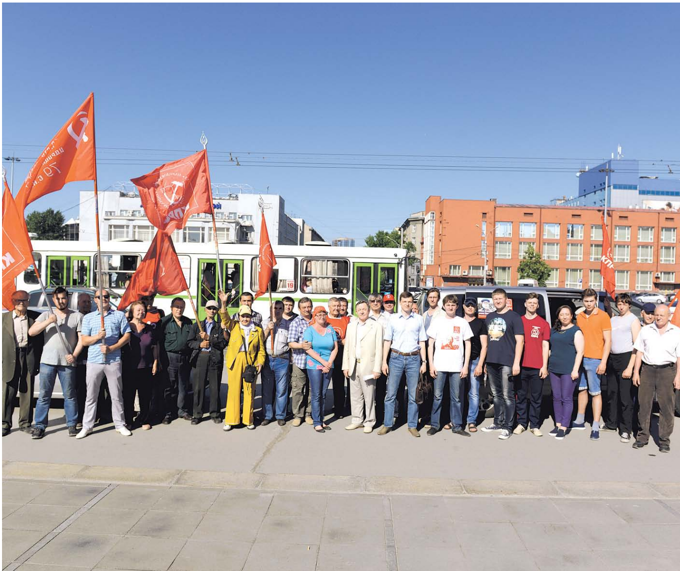
НА ФОТО: АВТОПРОБЕГ СТАРТОВАЛ С ПЛОЩАДИ ЛЕНИНА В НОВОСИБИРСКЕ