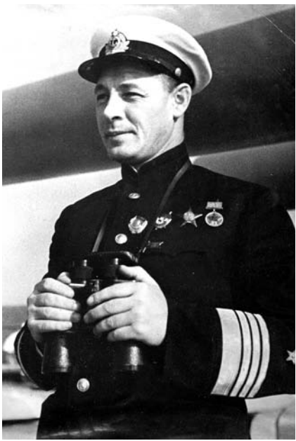
НА ФОТО: АДМИРАЛ КУЗНЕЦОВ

Военные моряки сыграли важную роль при обороне Моонзундских островов, военно-морских баз Ханко и Таллина. Уже в августе 1941 года авиация Балтийского флота бомбила Берлин и другие города фашистской Германии. Славой покрыли себя моряки и морские пехотинцы при защите Ленинграда, Сталинграда, Мурманска, Одессы,