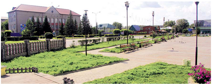
НА ФОТО: ГОРОДСКОЙ ПАРК КУЙБЫШЕВА

градоначальника Алика АНДРОНОВА , что администрация, идя навстречу куйбышевцам, частично присоединит участок к территории парка.