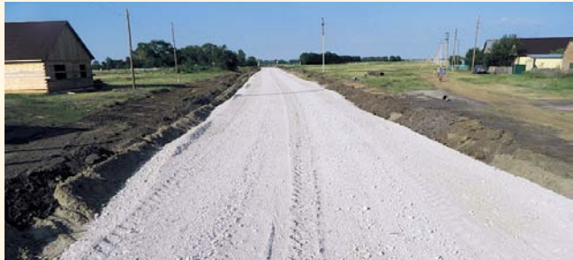
НА ФОТО: СЮДА ЗАКОПАЛИ 15 МИЛЛИОНОВ