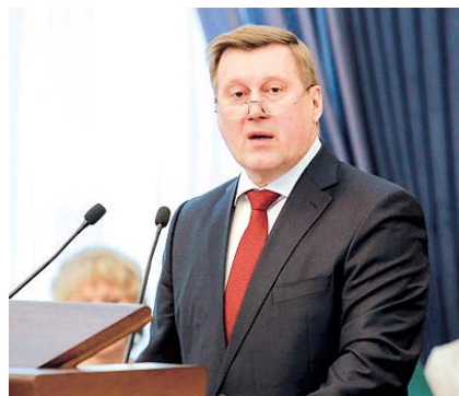
НА ФОТО: ВЫСТУПАЕТ АНАТОЛИЙ ЛОКОТЬ

Особое внимание в работе городских властей уделяется социальной сфере. Так, в Новосибирске полным ходом идет подготовка к новому учебному году. К 1 сентября планируется запустить две новые школы — №213 в микрорайоне «Березовый» и №155