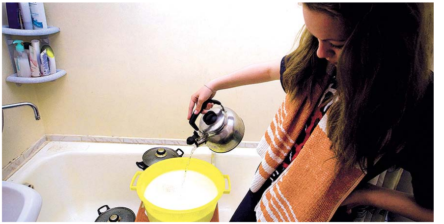
НА ФОТО: ГОРЯЧАЯ ВОДА — РОСКОШЬ, А НЕ ПРЕДМЕТ ПЕРВОЙ НЕОБХОДИМОСТИ

терпеть», но вот вопрос о том, можно ли было провести работы поэтапно, отключая воду в районах постепенно, остался без ответа. Кроме того, заявление, что людей предупреждали с нового года, также вызвало недоумение.