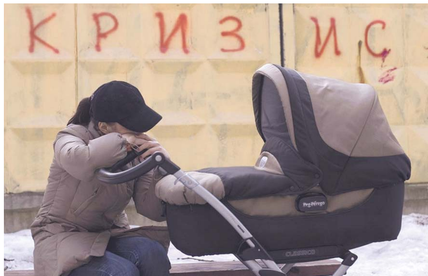
НА ФОТО: СОКРАЩЕНИЕ РАСХОДОВ СОЗДАЕТ ИЛЛЮЗИЮ ПРЕОДОЛЕНИЯ КРИЗИСА

— Граждане считают, что адаптировались к кризису, и дела обстоят не так плохо, но в реальности ситуация