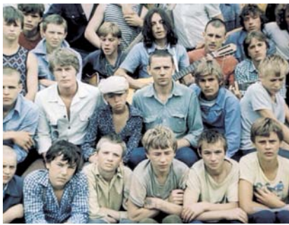
НА ФОТО: КАДР ИЗ Х/Ф «ПАЦАНЫ»

В своих фильмах Динара Асанова рассказывала о проблемах подрастающего поколения, затрагивала и другие явления современной действительности. Из дневников Динары Асановой: «Я поняла, чем так привлекает меня работа над фильмами о подростках: они постоянно находятся в поиске, в поиске ответов на многочисленные вопросы, в поиске самого себя. Вот это путь становления личности я прохожу вместе с ними. Детство, молодость — не островок, не отрывок от жизни, не