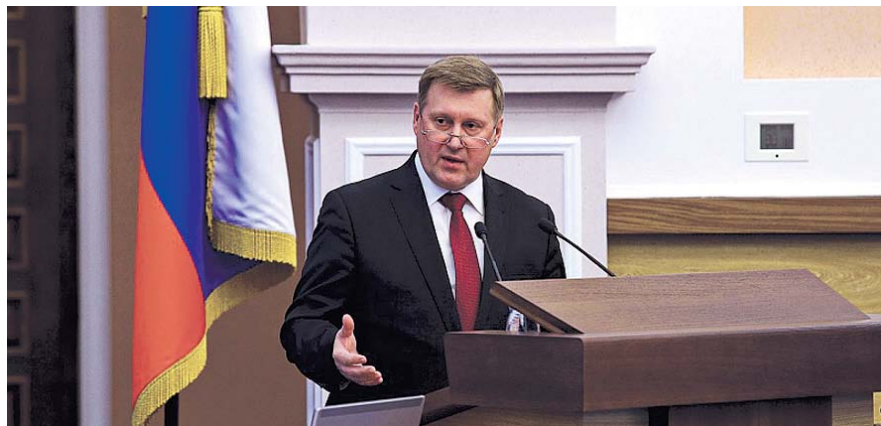
НА ФОТО: АНАТОЛИЙ ЛОКОТЬ НА СОБРАНИИ ГОРОДСКОЙ ОБЩЕСТВЕННОСТИ

Первым пунктом стало развитие городской среды и зеленых территорий. Глава города подчеркнул, что первые шаги в этом направлении уже сделаны: приняты новые правила застройки и землепользования, концепция развития