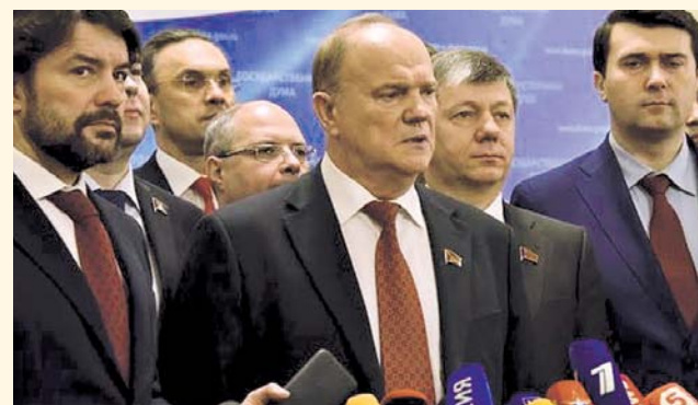
НА ФОТО: ГЕННАДИЙ ЗЮГАНОВ РАССКАЗАЛ О БЮДЖЕТЕ

9 ноября, предваряя пленарное заседание в Госдуме, перед журналистами выступил Председатель ЦК КПРФ, руководитель фракции КПРФ в Госдуме Геннадий ЗЮГАНОВ .