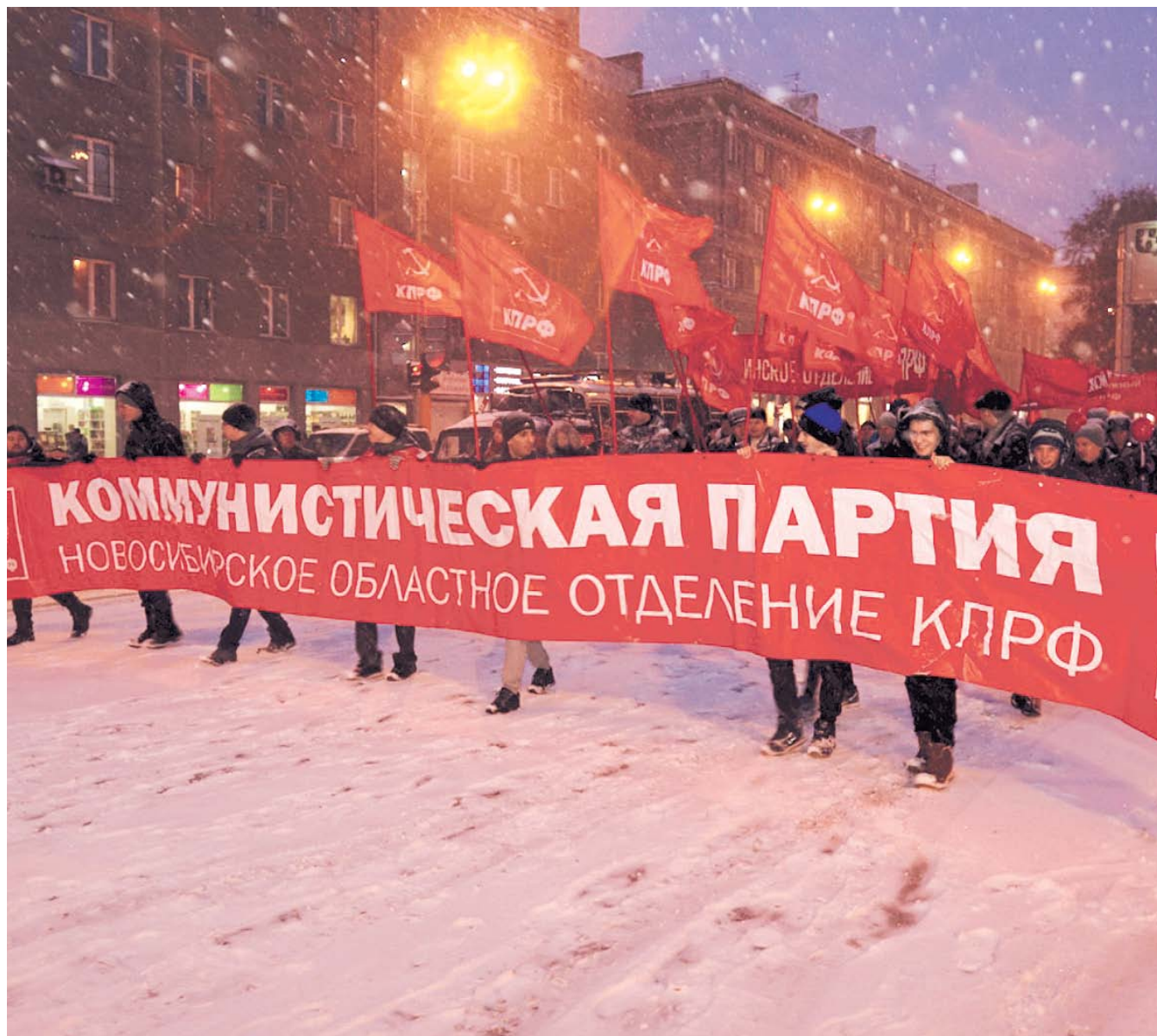
НА ФОТО: БОЛЕЕ ТЫСЯЧИ НОВОСИБИРЦЕВ ПРОШЛИ В КОЛОННЕ КПРФ ПО КРАСНОМУ ПРОСПЕКТУ