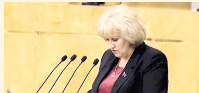
НА ФОТО: ВЕРА ГАНЗЯ ВЫСТУПАЕТ В ГОСДУМЕ