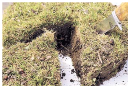
НА ФОТО: ХОТИТЕ КУСОЧЕК?