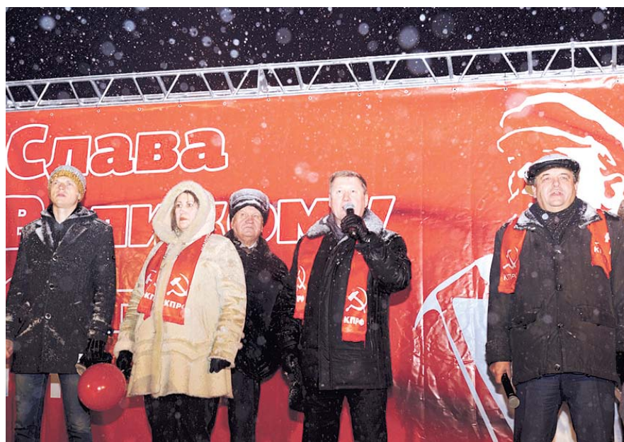
НА ФОТО: МЭР УВЕРЕН — 7 НОЯБРЯ ДОЛЖНО БЫТЬ ГОСУДАРСТВЕННЫМ ПРАЗДНИКОМ!

— 7 ноября — это 1917 год, когда изменила свой ход мировая цивилизация. 7 ноября — это 1941 год, когда по Красной площади шли наши великие предки, солдаты, красноармейцы. Без Ленина, без исторической роли Коммунистической партии не было бы этого великого парада, не было победного Красного знамени над рейхстагом. Именно наше великое социалистическое прошлое позволило создать Новосибирск таким, какой он есть сейчас, создать мощный промышленный, на-