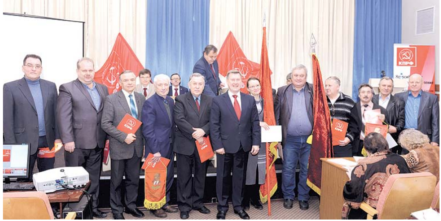
НА ФОТО: ПОБЕДИТЕЛИ СОЦСОРЕВНОВАНИЯ

На состоявшемся в минувшие выходные пленуме Новосибирского обкома КПРФ были награждены местные и первичные партийные отделения области: среди городов области — Обской ГК КПРФ, среди районов — Куйбышевский РК КПРФ, среди первичных отделений — Ташаринское ПО КПРФ Мошковского района. Победители поделились с редакцией секретом успеха.