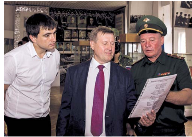
НА ФОТО: АНАТОЛИЙ ЛОКОТЬ В МУЗЕЕ ВОИНСКОЙ ЧАСТИ

Так, градоначальник предложил предприятиям приехать на новосибирскую ярмарку сельхозпродукции, мясоконсервной, плодоовощной, легкой промышленности и представить свою продукцию на ярмарочной торговле, которая пользуется популярностью у новосибирцев. Мэр пообещал создать все условия для комфортной торговли.