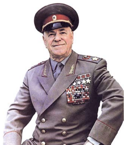
НА ФОТО: ГЕОРГИЙ ЖУКОВ

Оборонительные рубежи оказались недоступными для врага. А в начале декабря 1941 года войска Западного фронта севернее и южнее Москвы перешли в решительное контрнаступление. Враг был отброшен на 100, местами на 250 километров.