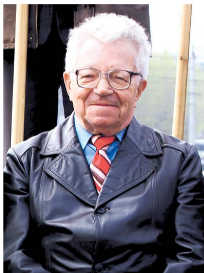
НА ФОТО: ВЛАДИМИР БОКОВ

— Вы — тот человек, благодаря которому Новосибирская область сейчас развивается. Вы по праву являетесь одним из самых уважаемых нами руководителей. Мы уверены, что Вы и дальше