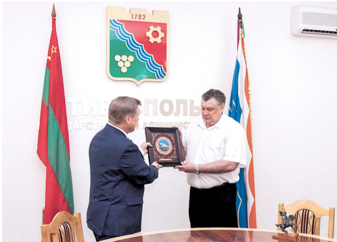
НА ФОТО: МЭР НОВОСИБИРСКА АНАТОЛИЙ ЛОКОТЬ И ГЛАВА АДМИНИСТРАЦИИ ТИРАСПОЛЯ АНДРЕЙ БЕЗБАБЧЕНКО