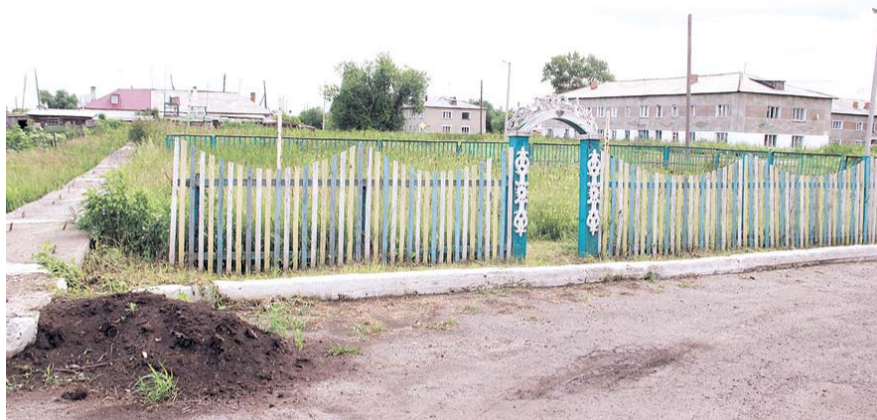
НА ФОТО: ОТ ДЕТСКОЙ ПЛОЩАДКИ ОСТАЛСЯ ЛИШЬ ЗАБОР