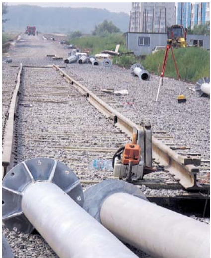
НА ФОТО: ИДЕТ УКЛАДКА ПУТИ

Анатолия Локтя интересовало буквально все: какова протяженность маршрута, его стоимость. Градоначальника порадовал тот факт, что насыпь из щебня выдержала проливные дожди, которые шли несколько дней подряд, — несмотря на то, что здесь очень слож-