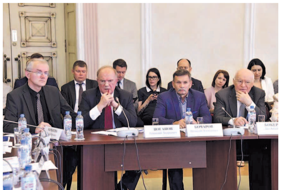
НА ФОТО: ГЕННАДИЙ ЗЮГАНОВ ВО ВРЕМЯ ОБСУЖДЕНИЯ ПРОЕКТА ПЕНСИОННОЙ РЕФОРМЫ

«Самое удивительное, — отметил Г.А. ЗЮГАНОВ , — что в жутком положении оказываются женщины. В силу того, что я много лет курировал Москву, мне приходится заниматься вопросами трудоустройства. Мне это