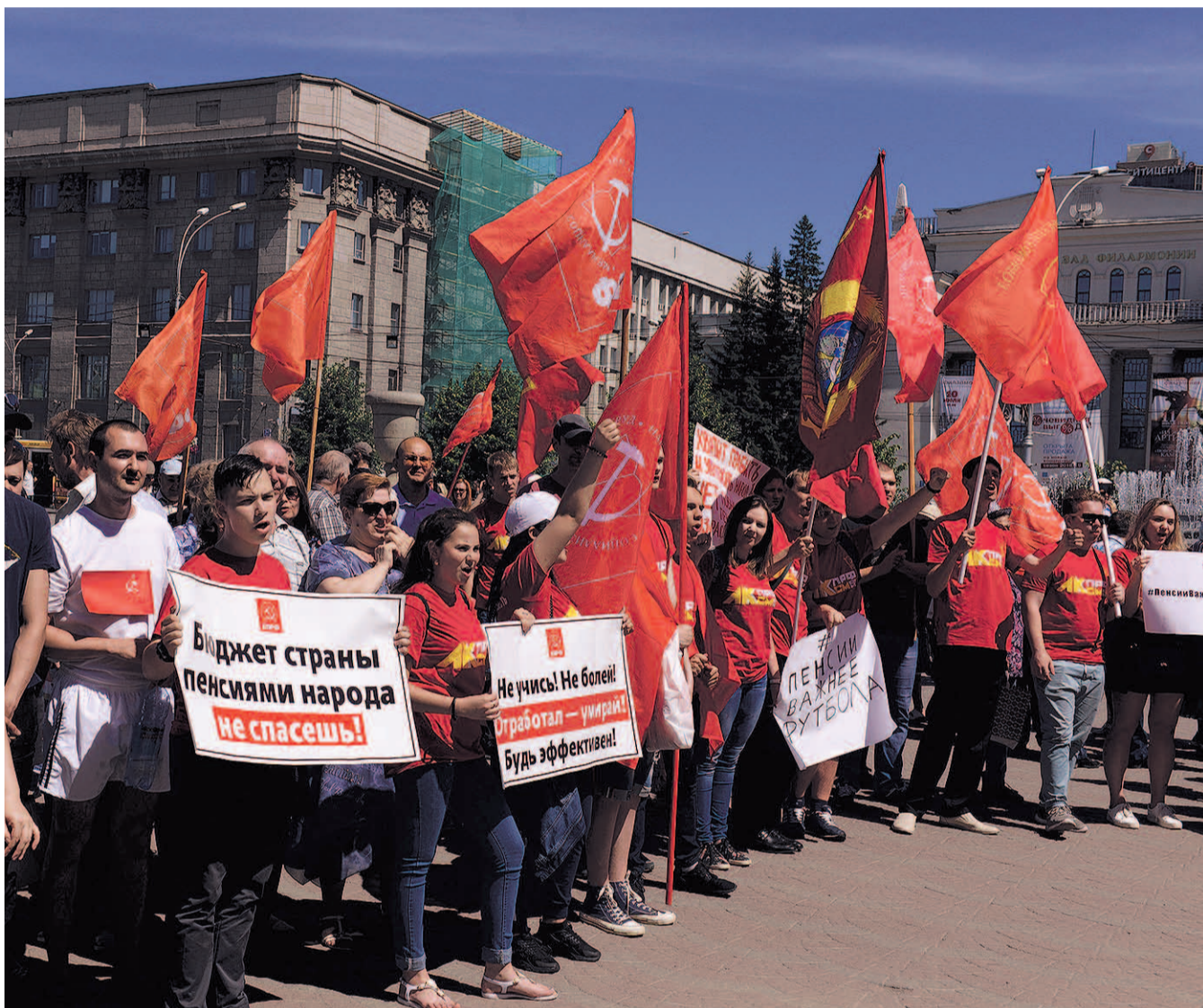
НА ФОТО: УЧАСТНИКИ КОМСОМОЛЬСКОГО СЛЕТА «ТОРНАДО» ПРОВЕЛИ МИТИНГ В ЦЕНТРЕ НОВОСИБИРСКА