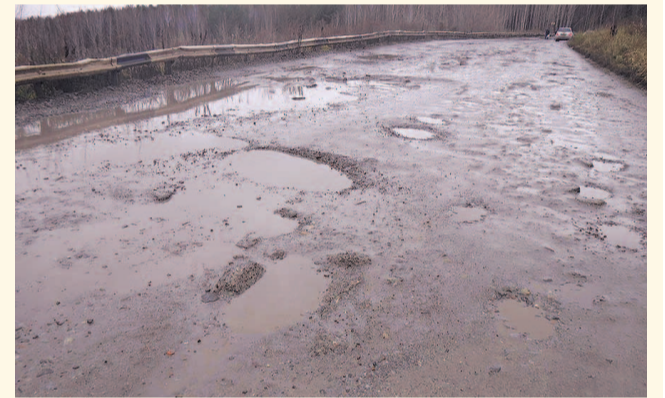
НА ФОТО: ЛИШЬ НЕЗНАЧИТЕЛЬНАЯ ЧАСТЬ ДОРОГ ПОДДЕРЖИВАЕТСЯ В ДОЛЖНОМ СОСТОЯНИИ, ОСТАЛЬНЫЕ — В ПЛАЧЕВНОМ