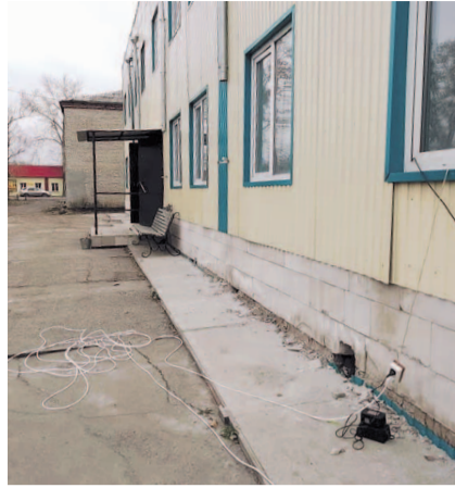
НА ФОТО: САЙДИНГ КРЕПЯТ ПРЯМО К СТЕНЕ

При этом рядом стоит дом, которому уже более 45 лет, его фундамент находится в гораздо лучшем состоянии, чем в том, который приняли четыре года назад, а теперь усердно пытаются