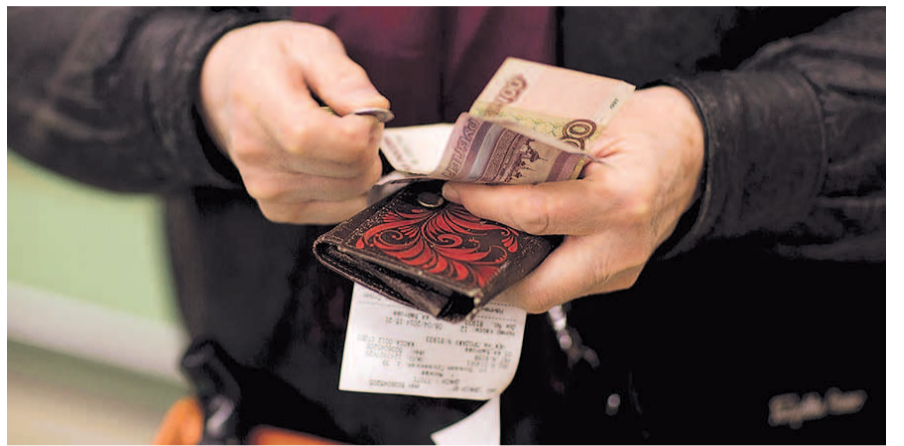
НА ФОТО: ПРАВИТЕЛЬСТВО УБЕЖДЕНО — ЗАРПЛАТЫ В СТРАНЕ РАСТУТ!

То есть, одни продолжают богатеть, другие с тем же успехом нищать. Что, кажется, ничуть не смущает министра