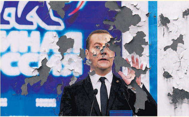
НА ФОТО: ФАСАД ПУТИНСКОЙ РОССИИ