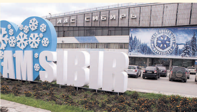
НА ФОТО: ЛЕДОВЫЙ ДВОРЕЦ БУДЕТ ОБНОВЛЕН