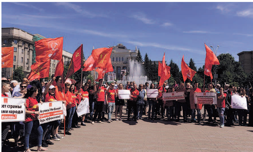
НА ФОТО: ЛКСМ ОТСТАИВАЕТ СОЦИАЛЬНЫЕ ПРАВА ГРАЖДАН РОССИИ