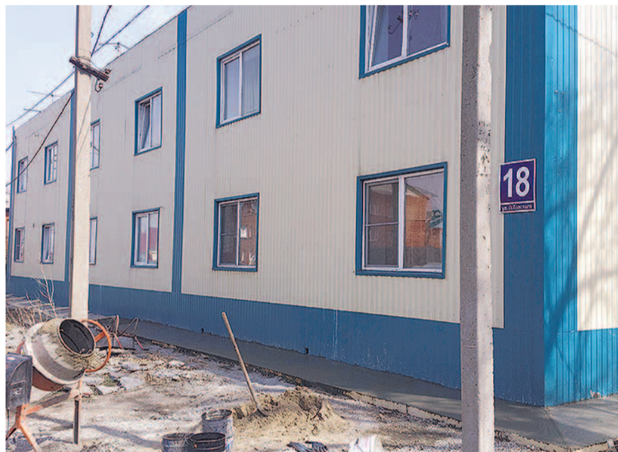
НА ФОТО: ВМЕСТО НЕОБХОДИМОГО РЕМОНТА — ДЕКОРАТИВНАЯ «КОСМЕТИКА»