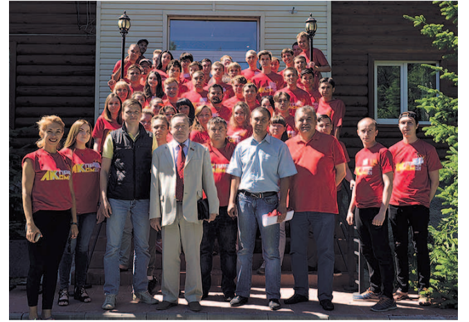
НА ФОТО: УЧАСТНИКИ КОМСОМЛЬСКОГО СЛЕТА «ТОРНАДО»