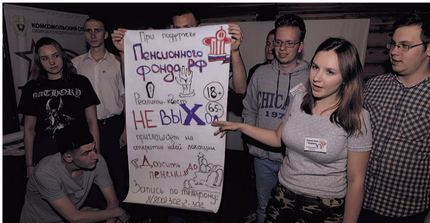
НА ФОТО: КОМСОМЛЬЦЫ ОТТАЧИВАЮТ НАВЫКИ СОЗДАНИЯ ПОЛИТИЧЕСКОГО ПЛАКАТА