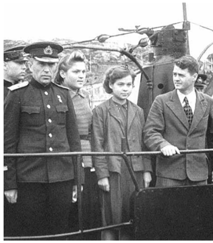
НА ФОТО: КОМСОМОЛЬЦЫ ПЕРЕДАЮТ ПОДВОДНУЮ ЛОДКУ МОРЯКАМ-СЕВЕРОМОРЦАМ

На торжество поднятия флага прибыли командующий флотом, делегация комсомольцев Новосибирской обла-