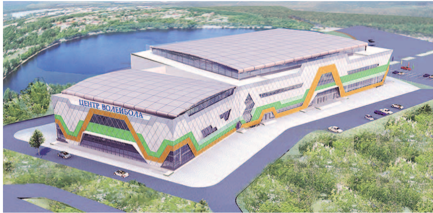
НА ФОТО: ПРОЕКТ ЦЕНТРА ВОЛЕЙБОЛА В НОВОСИБИРСКЕ

стративных барьеров для бизнеса — в электронной системе «Мой Новосибирск» указаны свободные торговые места для предпринимателей. Чиновникам установлены жесткие, более короткие сроки для выдачи разрешений предпринимателям, желающим открывать объекты нестационарной торговли.