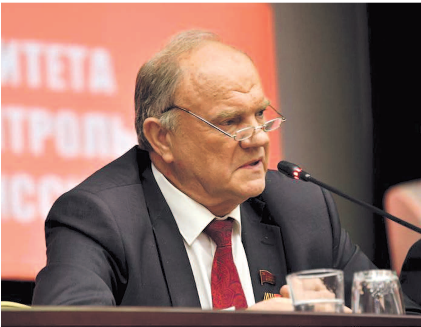
НА ФОТО: КОММУНИСТЫ БОРЮТСЯ ЗА ЗАЩИТУ СОЦИАЛЬНО-ЭКОНОМИЧЕСКИХ ПРАВ ТРУДЯЩИХСЯ