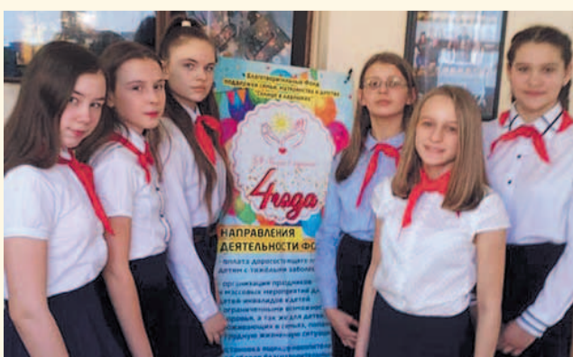
НА ФОТО: УЧАСТНИКИ ФЕСТИВАЛЯ