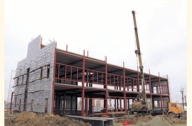
НА ФОТО: ВОКЗАЛ ВВЕДУТ В ЭКСПЛУАТАЦИЮ В 2019 ГОДУ