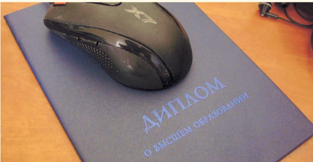
НА ФОТО: КОМУ-ТО УДАЕТСЯ НАЙТИ ПРИМЕНЕНИЕ ДИПЛОМУ