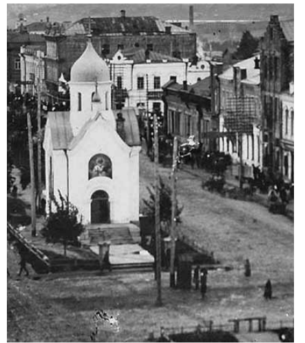
НА ФОТО: НОВОСИБИРСК 100 ЛЕТ НАЗАД

И хоть линия железной дороги прошла несколько южнее Московско-Сибирского тракта, но все по такой же равнине — болотистой, с массой озер, с редкими березовыми колками.