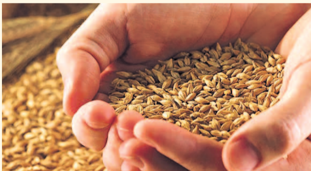
НА ФОТО: ПОСЕВНОЙ МАТЕРИАЛ ПРИЗНАН НЕКАЧЕСТВЕННЫМ