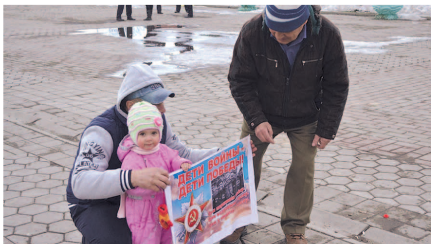
НА ФОТО: НА ПИКЕТЕ В КУЙБЫШЕВЕ