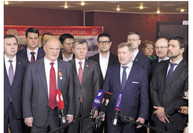
НА ФОТО: АНАТОЛИЙ ЛОКОТЬ ОТВЕЧАЕТ НА ВОПРОСЫ ЖУРНАЛИСТОВ

В ходе брифинга журналистами был задан вопрос о скандальном решении Центризбиркома, отказавшегося передать вакантный мандат депутата Государственной думы П.Н. ГРУДИНИНУ.