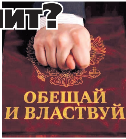
НА ФОТО: ЗАБОТА ПРАВИТЕЛЬСТВА