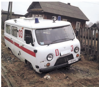
НА ФОТО: НЕТ НИ КОЛЕС, НИ ДОРОГ

Жители Северного района Новосибирской области жалуются на неприемлемое состояние медицинского обслуживания.