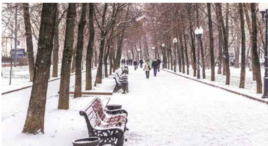
НА ФОТО: СТРОЙКИ В ПЕРВОМАЙСКОМ СКВЕРЕ НЕ БУДЕТ

— Я хочу подтвердить, ни один из документов строительного регулирования не допускает осуществления капитального строительства или застройки скверов и парков Новосибирска. В документах закреплено рекреационное