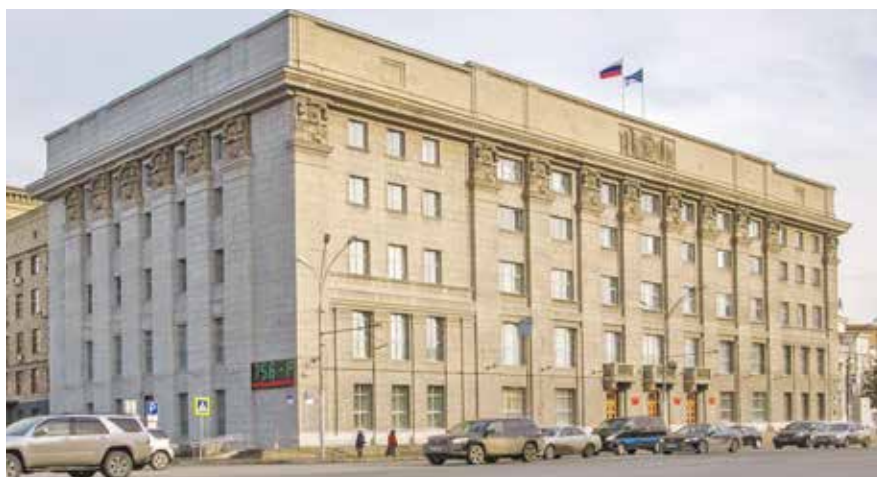
НА ФОТО: МЭРИЯ ГОРОДА НОВОСИБИРСКА

На 6 сессии Горсовета депутаты приняли Генеральный план развития Новосибирска. К 2030 году в городе должны появиться 6 новых станций метро, 100 тысяч новых мест в детских садах и школах и десятки новых дорог и проекты по реконструкции старых.