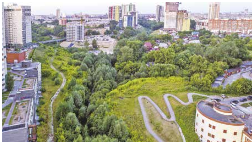
НА ФОТО: ПАРК НА ДАННОЙ ТЕРРИТОРИИ — НЕ РОСКОШЬ, А ЖИЗНЕННАЯ НЕОБХОДИМОСТЬ

Между тем еще в сентябре 2020 года депутат Совета депутатов Новосибирска в 2015–2020 годах,