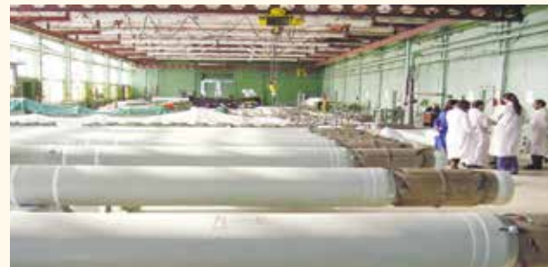
НА ФОТО: НА ОБОРОННОМ НОВОСИБИРСКОМ ЗАВОДЕ ИСКУССТВЕННОГО ВОЛОКНА (НЗИВ)

Три года назад деловое сообщество следило за ситуацией на оборонном Новосибирском заводе искусственного волокна (НЗИВ), расположенном в Искитиме, когда директора предприятия обвинили в растрате. Сейчас, по словам жителей, ситуация если и изменилась, то в худшую сторону.