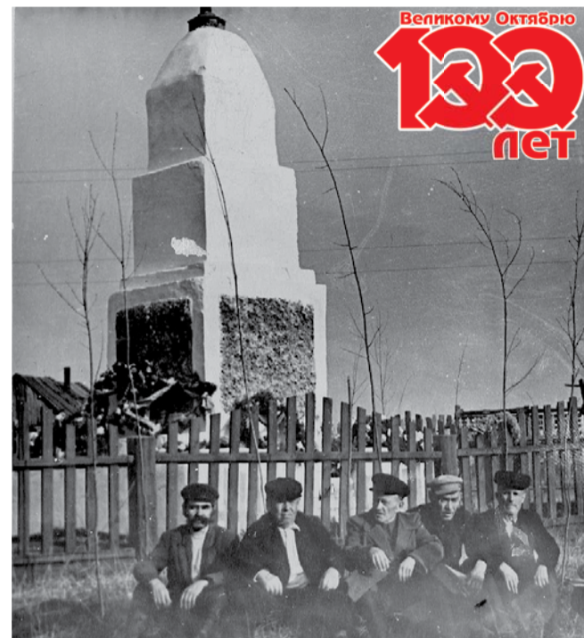
НА ФОТО: ПАМЯТНИК СУЗУНСКИМ ПАРТИЗАНАМ В 40-Е ГОДЫ

Белогвардейцы и чехи пробыли в Сузуне двое суток, разогнали Совет,