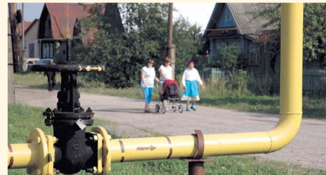
НА ФОТО: ГОЛУБОЕ ТОПЛИВО — КАК ГОЛУБАЯ МЕЧТА