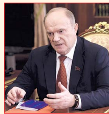
НА ФОТО: ГЕННАДИЙ ЗЮГАНОВ

Все ближе 100-летний юбилей Великой Октябрьской социалистической революции. И все историчнее и бессовестнее звучат обвинения в адрес российских коммунистов со стороны либеральных пропагандистов, которые мнят себя носителями «общечеловеческих ценностей» и поборниками «подлинной демократии».