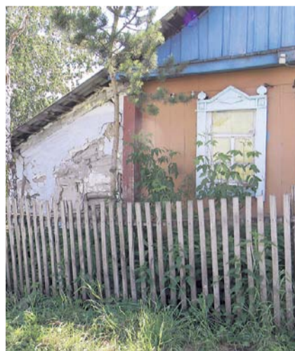
НА ФОТО: ДОМ ГРОЗИТ РУХНУТЬ

— Нужно найти возможность обеспечения ветеранов жильем, — гово-