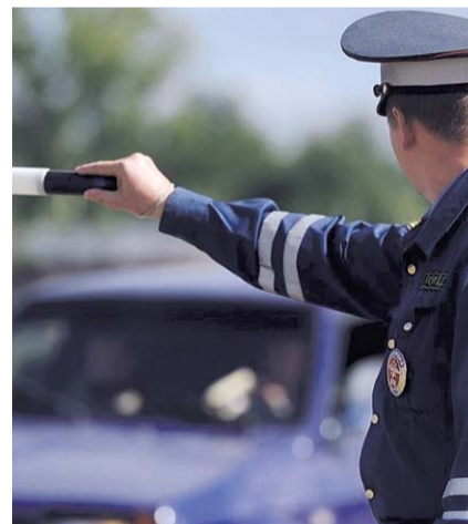
НА ФОТО: ЗАБОТА О БЕЗОПАСНОСТИ ИЛИ ГРАБЕЖ?

Слава богу, в органах ГИБДД в большинстве своем работают люди, понимающие, как и мы, что правила нужны, жесткие правила, но имеющие смысл только для предотвращения ДТП. Поэтому за свет, ремни, фаркоп чаще всего предупреждают, объясняют, до-