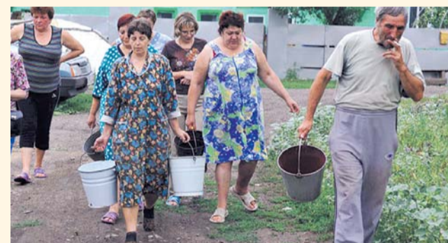
НА ФОТО: ПРОБЛЕМА ЧИСТОЙ ВОДЫ ДО СИХ ПОР НЕ РЕШЕНА

После остановки водонапорной башни около 200 жителей деревни Алексеевка Здвинского района оказались без питьевой воды.