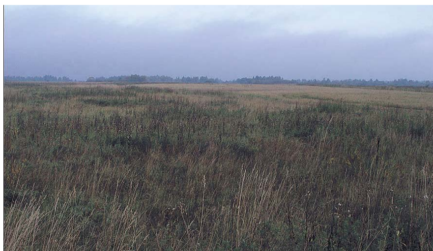
НА ФОТО: РЕАЛЬНОСТЬ РАЗИТЕЛЬНО ОТЛИЧАЕТСЯ ОТ ПРЕДСТАВЛЕНИЙ МИНИСТРА

Вместе с тем ослабление конкуренции в 2015-2016 годах привело к существенному росту цен, а по молоку и молочным продуктам зависимость от импорта все еще остается достаточно высокой.