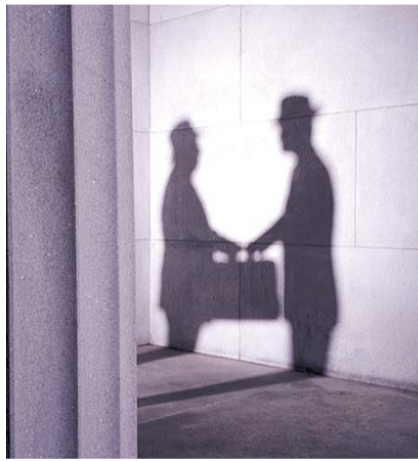
НА ФОТО: ТЕНЕВЫЕ РАССЧЕТЫ

Но это проблема, скорее, криминальная, чем экономическая. А вот проблема экономическая, это когда в «тень» уходят предприятия, которые могли бы быть легальными, если бы государ-