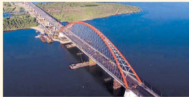
НА ФОТО: ЗА МОСТ УПЛАЧЕНО СПОЛНА