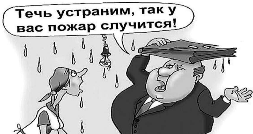
● НА РИС.: ЖЕЛЕЗНАЯ ЛОГИКА ЖИЛИЩНИКОВ

картинка Сергея КОРСУНА с сайта CARICATURA.RU