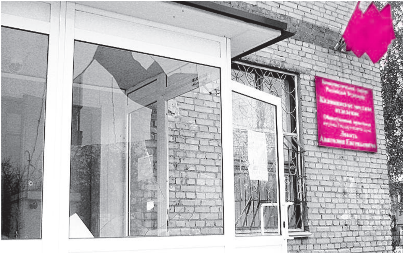
● НА ФОТО: НЕИЗВЕСТНЫЕ НАПАЛИ НА ПРИЕМНУЮ ДЕПУТАТА ГОСДУМЫ АНАТОЛИЯ ЛОКТЯ УЖЕ ТРЕТИЙ РАЗ ЗА ПОСЛЕДНИЕ ПОЛГОДА