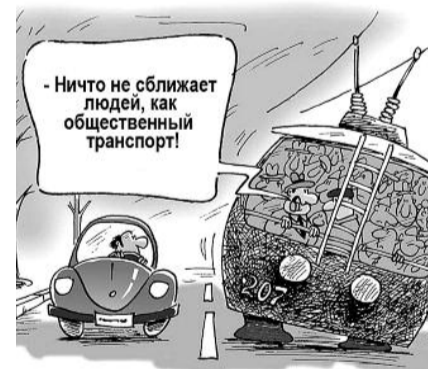
● НА РИС.: В ТЕСНОТЕ И В ОБИДЕ

Заработная плата работников муниципальных предприятий и муниципальных учреждений транспорта в муниципальном секторе экономики является одной из самых низких и составляет около 14 000 руб. Депутатское объединение КПРФ считает