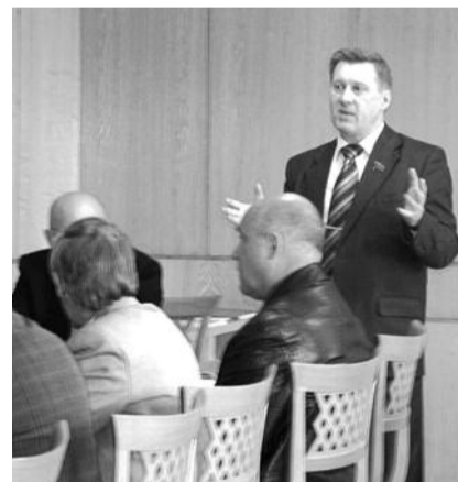
■ НА ФОТО: АНАТОЛИЙ ЛОКОТЬ НА ВСТРЕЧЕ С ЛИДЕРАМИ ПРОФСОЮЗОВ

нулся в своем докладе тех трагедий, что еще недавно случились в нашей стране, — упавшем самолете ЯК-42, затонувшем судне «Булгария» и др. Почему его не отправили в отставку, затормозив этот процесс? Потому, что отправить сейчас любого министра в отставку, — это значит для власти признать накануне выборов собственную политическую несостоятельность.