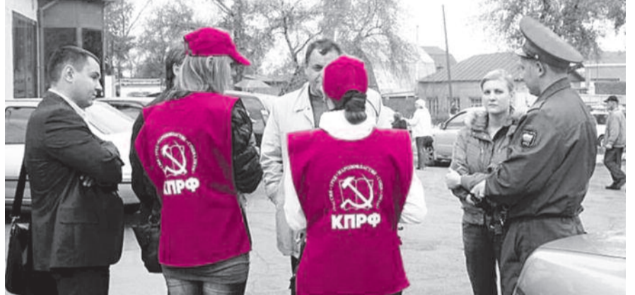
■ НА ФОТО: 5 ОКТЯБРЯ У ДЕВУШКИ-АКТИВИСТКИ НЕИЗВЕСТНЫЕ СИЛОЙ ОТОБРАЛИ БЮЛЛЕТЕНИ

— Игорь Левитин настолько был уверен в своей безнаказанности, что даже не кос-