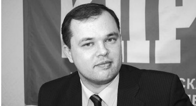
■ НА ФОТО: ИЛЬЯ ПОТАПОВ В ДОЛЖНОСТИ МЭРА БЕРДСКА УЖЕ ПОЛГОДА

Полгода назад вступил в должность новый глава городской администрации Бердска Илья ПОТАПОВ . Новый глава города начал свою работу с проверки деятельности ряда чиновников на ключевых постах и обновления команды. Глава Бердской городской администрации Илья Потапов рассказал об итогах полугодового пребывания в должности и основных задачах на текущий момент.