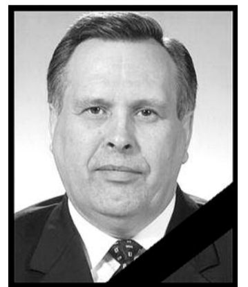
● НА ФОТО: ВИКТОР ИЛЮХИН

В Европейском суде по правам человека прошли открытые слушания по одному из самых громких дел последних лет — «катынскому», сообщает сайт «Свободная пресса».