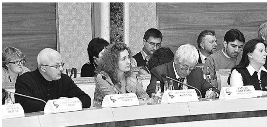
■ НА ФОТО: СВЫШЕ 90 ЖУРНАЛИСТОВ ПОСЕТИЛИ РЕСПУБЛИКУ БЕЛАРУСЬ 3-8 ОКТЯБРЯ

— Есть научные работы, — комментирует основные требования участников акции член Президиума объединенного комитета