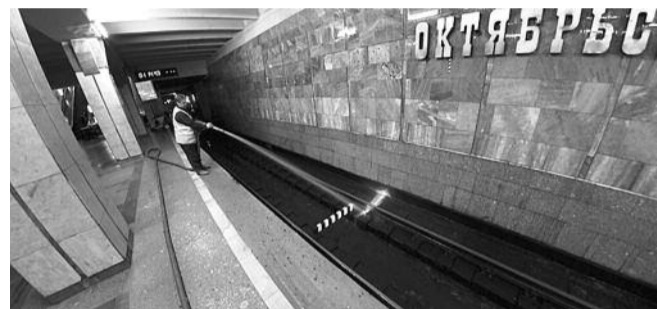
● НА ФОТО: ПОЛТОРА ГОДА НАЗАД МОЛОДОЙ НОВОСИБИРЕЦ БРОСИЛСЯ ПОД ПОЕЗД НА СТАНЦИИ МЕТРО «ОКТАБРИ»