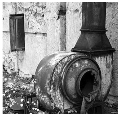
● НА ФОТО: ЗАВОД «СИБСЕЛЬМАШ» ПРОИЗВОДИЛ БОЕПРИПАСЫ И СЕЛЬХОЗТЕХНИКУ

Производил прицепную сельхозтехнику и боеприпасы. Работало более 30 тыс. человек. Награжден тремя орденами СССР. Поставлял продукцию в 35 стран. Имел свой санаторий, пионерский лагерь, базу отдыха. В настоящее время распался на три предприятия с общей численностью сотрудников до 3 тыс. человек. На головном предприятии с численностью 1 500 человек не выплачивается зарплата, долг более 1 млрд. рублей, введено внешнее управление.