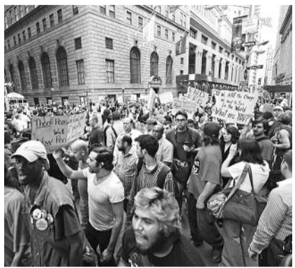
● НА ФОТО: АКЦИЯ «ЗАХВАТИ УОЛЛ-СТРИТ»

Протесты, начавшиеся в США 22 дня назад, в последние дни распространяются по всей стране. За последнюю неделю демонстрации охватили Вашингтон, Бостон, Чикаго, Хьюстон, Сан-Франциско, Филадельфию, Солт-Лейк-Сити и Лос-Анджелес. Митинги с участием недовольных ситуацией в стране прошли и даже в самом северном административном центре США — городе Анкоридж на Аляске.