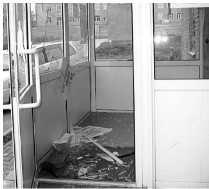
■ НА ФОТО: ПОСЛЕДСТВИЯ АТАКИ НА ПРИЕМНУЮ ЛОКТЬЯ В КАЛИНИНСКОМ РАЙОНЕ

5 октября трое молодых людей, представившись членами партии «Единая Россия», применив физическую силу, отобрали у девушек-активисток КПРФ агитационные материалы. Как рассказал в интервью нашему корреспонденту активист, проводивший голосование по вопросам Народного референдума, молодые люди, представившиеся членами партии «Единая Россия», хотели получить бюллетень для голосования в качестве образца. Получив отказ, они удалились. Приблизительно через полчаса, вернувшись с подмогой в виде крепкого телосложения индивида, у которого отсутствовала половина левого уха, хулиганы силой отобрали у девушки бюллетени, плакат Народного референдума и урну для голосования и скрылись на белых «Жигулях».