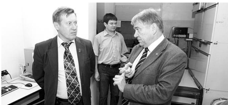
■ НА ФОТО: АНАТОЛИЙ ЛОКОТЬ НА ВСТРЕЧЕ С ДИРЕКТОРОМ ИНСТИТУТА КАТАЛИЗА СО РАН, АКАДЕМИКОМ ВАЛЕНТИНОМ ПАРМОНОМ. КОММУНИСТЫ ВСЕГДА ПОДДЕРЖИВАЮТ УЧЕНЫХ