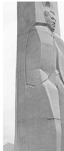
● НА ФОТО: ПАМЯТНИК ЕЛЬЦИНУ В ЕКАТЕРИНБУРГЕ ДАЛ ТРЕЩИНУ

Памятник Борису ЕЛЬЦИНУ в Екатеринбурге дал трещину — чтобы устранить дефекты, пришлось вызывать профессиональных реставраторов. Напомним, монумент был установлен в уральской столице 1 февраля текущего года. Но уже в сентябре горожане заметили, что памятник стремительно приходит в негодность — на нем появились трещины, места соединений блоков пожелтели.