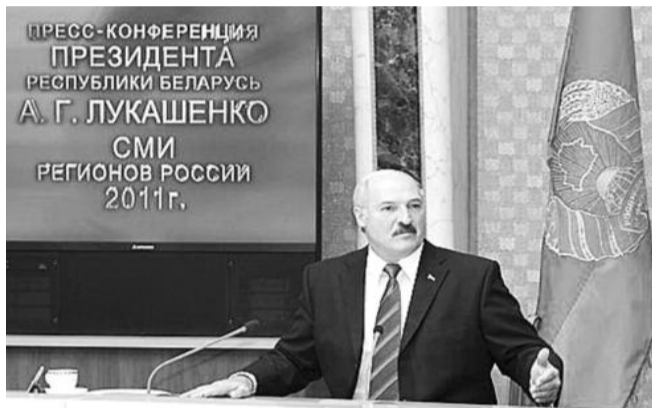
■ НА ФОТО: ПРЕСС-КОНФЕРЕНЦИЯ АЛЕКСАНДРА ЛУКАШЕНКО

3-8 октября делегация представителей российских СМИ посетила Республику Беларусь. В ее составе было свыше 90 журналистов более чем из 40 регионов России. Об увиденном можно рассказывать долго, но легче и проще сказать, чего не удалось увидеть в Белоруссии. Не удалось увидеть нищих, собирающих милостьню, бомжей, автомобильных пробок на дорогах и мусора на улицах. Также автор этих строк из общения с жителями республики вынес представление, что, например, наркомания там — это медицинская, а не острейшая социальная проблема, как мы это имеем в нашем Отечестве.