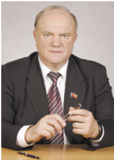
НА ФОТО: ЗЮГАНОВ ГЕННАДИЙ АНДРЕЕВИЧ, ПРЕДСЕДАТЕЛЬ ЦК КПРФ, РУКОВОДИТЕЛЬ ФРАКЦИИ КПРФ В ГОСДУМЕ ФС РФ

Как в практической, так и в теоретической деятельности Сталина мы находим ответ на вопрос о жизнеспособности социализма, о том, насколько оптимистична его историческая перспектива. Люди невольно сравнивают происходящее сейчас с тем, как менялась жизнь к лучшему в прежние времена. И потому далеко не случайно, что и Сталин, и Ленин уверенно лидировали в интернет-опросе россиян в рамках проекта «Имя России», который проводили государственный телеканал «Россия», Институт российской истории РАН и фонд «Общественное мнение». Пока отдельные ученые робко ставят вопрос о «политической и политологической реабилитации Сталина», в массовом сознании это давно уже произошло.