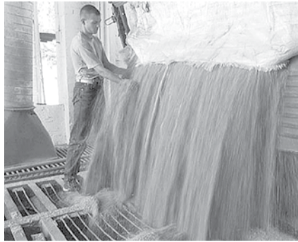
НА ФОТО: СДАВАТЬ ЗЕРНО НА ЭЛЕВАТОР В ТАКИХ УСЛОВИЯХ НЕВЫГОДНО

По итогам первого дня торгов было закуплено 28 тысяч тонн зерна при плане 29,7 тысячи тонн. Не состоялась аукционы по покупке 1,3 тысячи тонн пшеницы 5 класса в Новосибирской области, и не было закуплено два лота фуражного ячменя в Алтайском крае. Самый большой объем зерна был при-