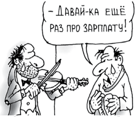
НА РИС.: СРЕДНИЙ ДОЛГ ПО ЗАРПЛАТЕ — 24 397 РУБЛЕЙ

Долги по заработной плате в Новосибирской области за месяц увеличились на 60%