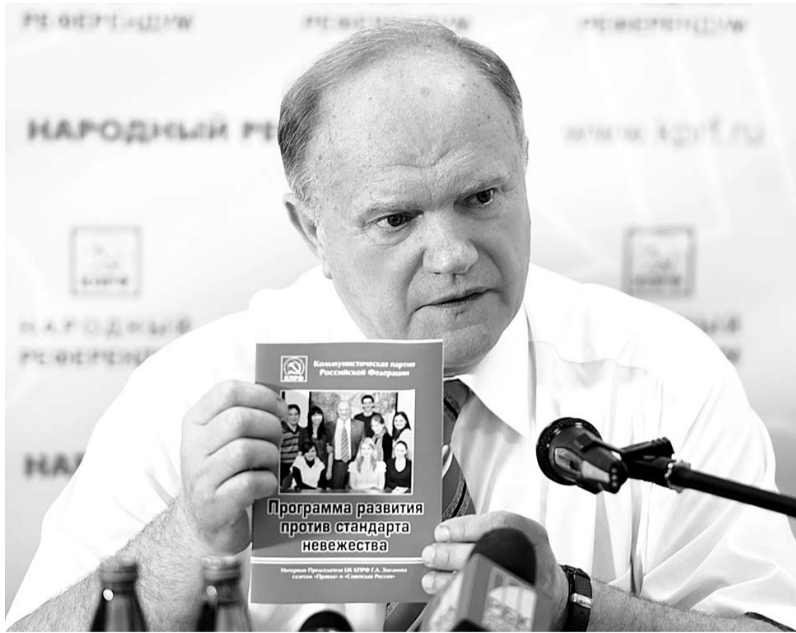
НА ФОТО: ПРЕДСЕДАТЕЛЬ ЦЕНТРАЛЬНОГО КОМИТЕТА КПРФ ГЕННАДИЙ ЗЮГАНОВ

ВТОРОЕ. Обострение кризиса капитализма делает ситуацию на планете все более взрывоопасной. Для разжигания войны мировая олигархия активно использует национальную карту. Публикуя пичкают рассказами о «войне цивилизаций» и призывами к борьбе с «мировым терроризмом». Но эта «дымовая завеса» не мешает глобалистам поддерживать крайне реакционные силы фундаменталистского и откровенно бандитского толка. Реализация стратегии «глобального хаоса» порождает все больше «горячих точек». Империалисты используют данную ситуацию для вмешательства в дела других стран. За счет этого они усиливают контроль над целыми регионами, решают для себя проблему энергоносителей, провоцируют бегство капиталов из «зон нестабильности» в США и Европу. Долг КПРФ — настойчиво вскрывать подноготную действий тех сил, мировым жандармом которых