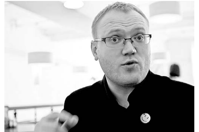
НА ФОТО: ЗАМЕСТИТЕЛЬ МИНИСТРА РЕГИОНАЛЬНОЙ ПОЛИТИКИ

Чиновник из правительства Юрченко назвал придорожный туалет градообразующим предприятием Болотного