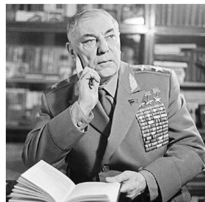
НА ФОТО: МАРШАЛ АВИАЦИИ

Я рассказал ему о планах постройки комплекса ДОСААФ в Тогучине. Александр Иванович спросил: «А где находится ваш город?» Я объяснил, что это железнодорожная станция на ветке Новосибирск-Новокузнецк. Тогда он вспомнил, что перед войной, году в 1939-1940-м он со своим другом, Иваном Никитовичем БУРКОВЫМ , летал к его родителям на ст. Курундус. А я вспомнил, что мои родственники, жившие в то время в Курундусе, рассказывали об этом факте, а еще о том, что Иван Никитович покатал детей на самолете над деревней. Александр Иванович подтвердил: «Да, это было...». После некоторого молчания он спросил: «О какой сумме идет речь?». Мы с Александром Семеновичем назвали ее. Покрышкин позвонил, вошел гене-