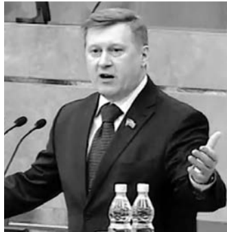
НА ФОТО: АНАТОЛИЙ ЛОКОТЬ В ГОСУДАРСТВЕННОЙ ДУМЕ

Государственная дума рассмотрит законопроект, предполагающий возвращение в избирательные бюллетени графы «Против всех», что позволит отобразить в избирательном процессе многообразие политических взглядов и общественных