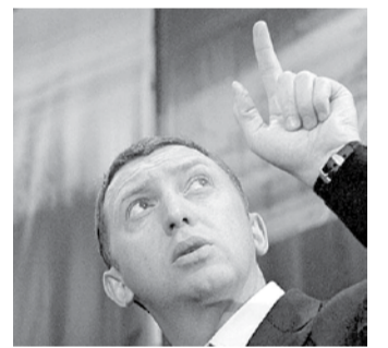
НА ФОТО: ДЕРИПАСКЕ НЕ УДАЛОСЬ ЗАСУДИТЬ ОБКОМ КПРФ

Арбитражный суд Новосибирской области в среду отклонил два иска — «РусАла» и его главы Олега ДЕРИПАСКИ — к депутату Госдумы от КПРФ Сергею ЛЕВЧЕНКО и Новосибирскому областному отделению КПРФ.