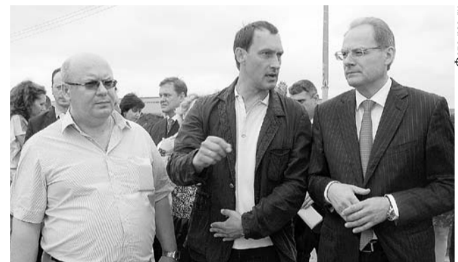
НА ФОТО: ВЫЕЗДНОЕ СОВЕЩАНИЕ НА ТЕРРИТОРИИ ПЛП (2011 ГОД)

ректор и его заместитель ПЛП, соответственно, 5 млн 232,6 тысячи. Если учесть, что в АИР и в ПЛП гендиректором и заместителем являются одни и те же лица, то в 2011-12 годах их заработки были в несколько раз выше зарплат федеральных министров.