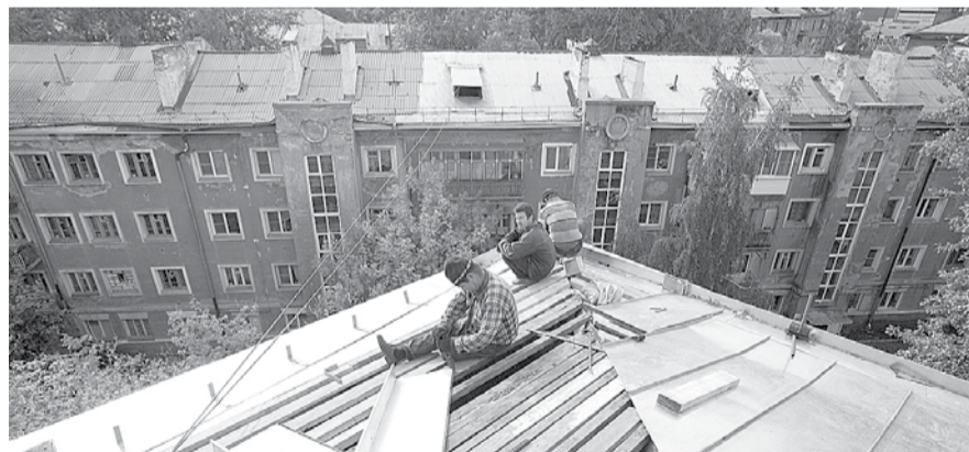
НА ФОТО: ЖИТЕЛИ МОГУТ НЕ ДОЖДАТЬСЯ КАПРЕМОНТА СВОИХ МНОГОКВАРТИРНЫХ ДОМОВ