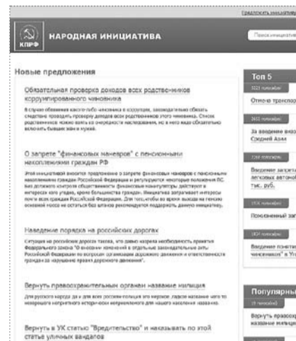
НА ФОТО: САЙТ «НАРОДНАЯ ИНИЦИАТИВА»

Например, относительно предложения о введении «сухого закона» в Российской Федерации ( www.ni.kprf.ru/n/101 ) мнения пользователей разделились почти поровну. При этом схо-