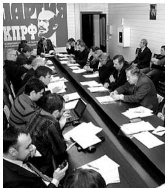
НА ФОТО: НА ЗАСЕДАНИИ БЮРО

Очередное заседание бюро областного комитета обсудило предстоящий пленум ЦК КПРФ, посвященный национальной политике.