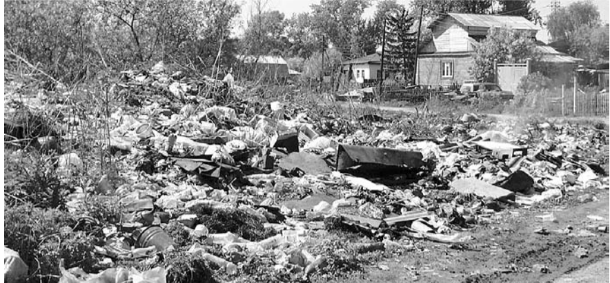
НА ФОТО: В ЧАСТНОМ СЕКТОРЕ ПРОБЛЕМА СТИХИЙНЫХ СВАЛОК СТОИТ КАК НИГДЕ ОСТРО

Для частного сектора проблема вывоза мусора всегда являлась одной из главных. Ни для кого не секрет, что некоторые жители отказываются оплачивать вывоз мусора и выбрасывают его на улицах, в зеленых зонах и речках, нанося тем самым серьезный ущерб экологии и благоустройству города. Для того, чтобы решить проблему с несанкционированными свалками, новосибирские депутаты решили предложить Государственной думе законодательно закрепить ответственность граждан за вывоз мусора.