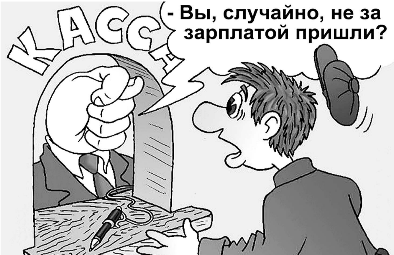
НА РИС.: СВОЕВРЕМЕННО ЗАРАБОТНУЮ ПЛАТУ НЕ ПОЛУЧИЛИ 3700 ЖИТЕЛЕЙ НОВОСИБИРСКОЙ ОБЛАСТИ