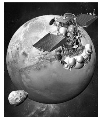
● НА ФОТО: ОПЯТЬ НЕ ДОЛЕТИТ?

Космический аппарат «Фобос-грунт» не смог выйти с околоземной орбиты и отправиться в сторону Марса. Если ситуацию не удастся изменить за ближайшие три дня, то первая межпланетная миссия России за последние почти 15 лет окажется сорванной. В случае успеха станция через три года должна была доставить на Землю около 200 граммов грунта Фобоса — спутника Марса, пишет «Газета.ru».