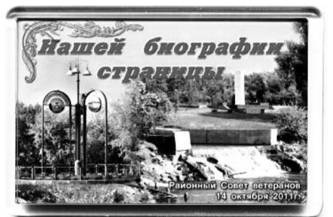
■ НА ФОТО: СУВЕНИР-МАГНИТИК ВСТРЕЧИ

В фойе Культурно-досугового центра были организованы разного рода выставки, характеризующие деятельность ветеранской организации, представлены альбомы, отражающие разные стороны жизни, многочисленные Почетные грамоты областного Совета ветеранов, подшивка районной газеты, материалы районного музея. Участники встречи с нескрываемым интересом рассматривали представленные материалы, часто узнавали себя на разных фотографиях, обменивались мнениями, вспоминая былые времена.