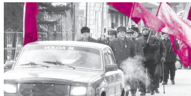
■ НА ФОТО: ПРАЗДНИЧНАЯ ДЕМОНСТРАЦИЯ В БОЛОТНОМ