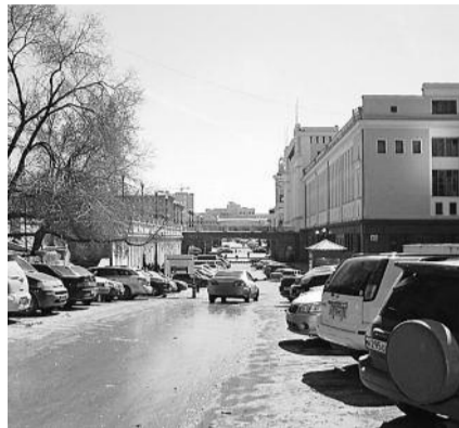
■ НА ФОТО: ДЕТСКИЙ КЛУБ РАСПОЛАГАЕТСЯ ПО СОСЕДСТВУ С ЗАВОРКАМИ Ж/Д ВОКЗАЛА

Родители стали писать многочисленные обращения в органы власти, в том числе главе района, с требованием вернуть клуб в старое помещение. Однако ни глава района, ни городские чиновники с возвращением здания детям не спешили.