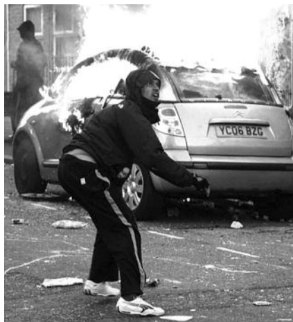
● НА ФОТО: АВГУСТОВСКИЕ БЕСПОРЯДКИ В СТОЛИЦЕ ВЕЛИКОБРИТАНИИ

Во Франции с понедельника бастуют железнодорожники, протестующие против планов Евросоюза привлечь новых игроков на рынок пассажирских перево-