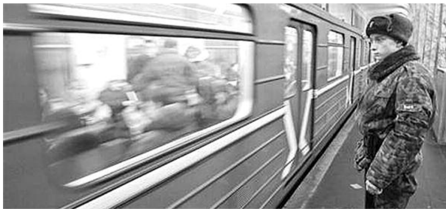
● НА ФОТО: СРОЧНИКОВ ЛИШАТ БЕСПЛАТНОГО ПРОЕЗДА В ОБЩЕСТВЕННОМ ТРАНСПОРТЕ?

Государство нашло и как «компенсировать» возросшие расходы. В 2012-м и в последующие три года, вопреки закону, в госбюджете не будет статьи на индексацию денежного довольствия и пенсий отставникам. То есть, целых четыре года инфляция будет жрать ту самую прибавку, которой решено обрадовать военных. Что от той надбавки останется к 2016 году? Но судьбоносные выборы депутатов Госдумы и президента будут, конечно, позади. Или вот такая странность. Раз жало-