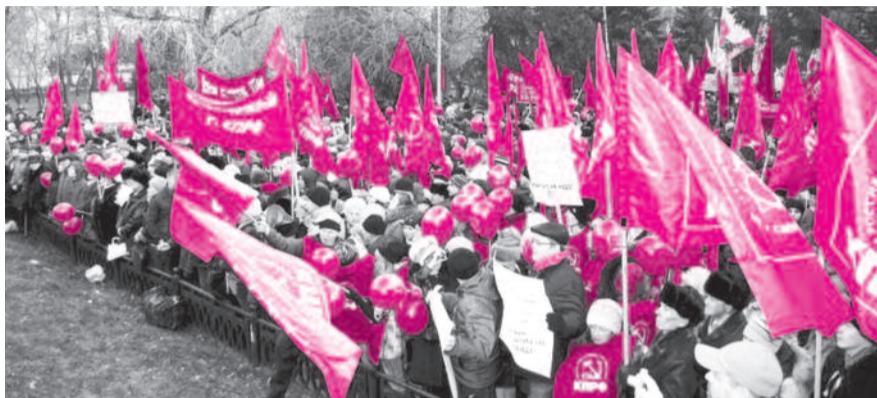
■ НА ФОТО: УЧАСТНИКИ ДЕМОНСТРАЦИИ ЗАПОЛНИЛИ СКВЕР ГЕРОЕВ РЕВОЛЮЦИИ

активисты «Справедливой России», «Патриотов России», «Трудовой России», РКРП-РПК, представители молодежных левых организаций — РКСМ, АКМ. К этому времени уже было известно, что площадь Ленина плотно «взята в осаду» властью: по периметру металлические ограждения и полиция, а внутри, на площадке перед оперным — «праздник» молодого гвардейцев-единоборцов. На него, впрочем, властям удалось выгнать не более 300 человек. И то в редакцию звонили представители спортивных организаций и возмущались методами власти — их обязали стоять на площади Ленина, чтобы не пустить туда КПРФ.