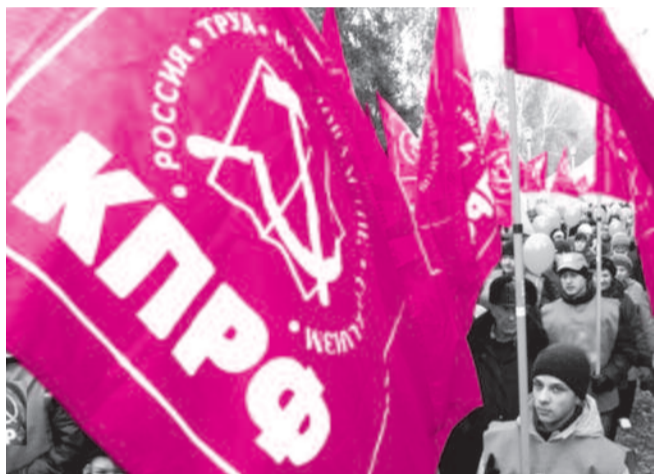
■ НА ФОТО: НОВОСИБИРСЦЫ НАМЕРЕНЫ ГОЛОСОВАТЬ ЗА КПРФ

Как сообщает сайт, на выборы собирается прийти 62% опрошенных избирателей. 35% от числа тех, кто намерен принять участие в выборах, пока не определились, за кого они будут голосовать. Далее проценты приводятся от числа определившихся.