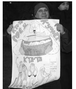
● НА ФОТО: СКАЗОЧКА ОТ ДОЛЬЩИКОВ

На площади Ленина состоялась пикет обманутых дольщиков недострой по ул. Тульская, 84. Молодые семьи потребовали от властей предоставить до конца недели письменные гарантии по выделению бесплатных техусловий, необходимых для возобновления строительства, и заверили, что в противном случае снова начнется голодовка, приостановленная 17 мая.