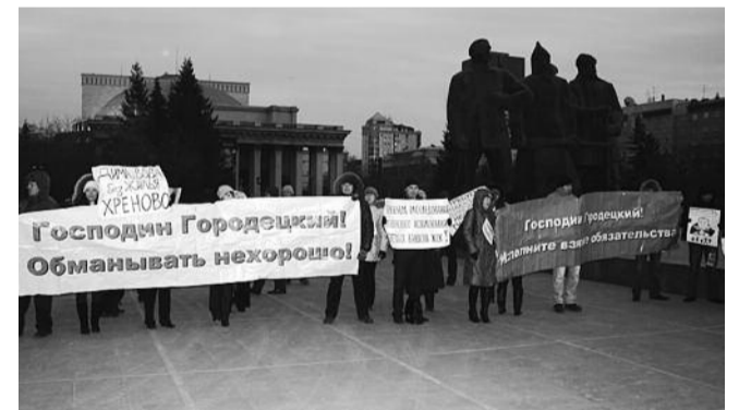
● НА ФОТО: ПИКЕТ ОБМАНУТЫХ ДОЛЬЩИКОВ НА ПЛОЩАДИ ЛЕНИНА