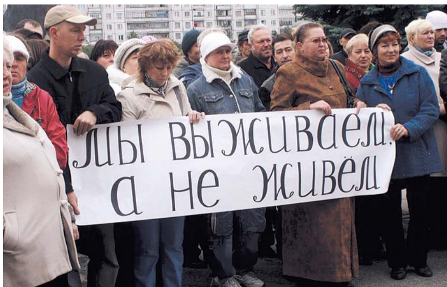
НА ФОТО: УРОВЕНЬ ЖИЗНИ В РОССИИ СОПОСТАВИМ С БЕДНЕЙШИМИ СТРАНАМИ АФРИКИ

По данным швейцарской бизнес-школы IMD, наша страна в рейтинге социального благополучия занимает место между Монголией и Колумбией. В медицине наше место еще ниже — между Нигером и Суданом.