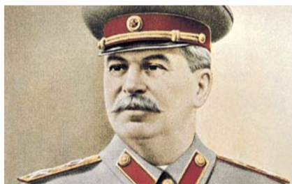
НА ФОТО: ИОСИФ ВИССАРИОНОВИЧ СТАЛИН

В справке Forbes о занявшем второе место Иосифе СТАЛИНЕ говорилось «...Активно использовал рабский труд...Организатор череды массовых репрессий против советского народа». И, тем не менее, даже посетители сайта журнала, ориентированного на либеральные ценности, вывели генералиссимуса на второе место, позволив ему