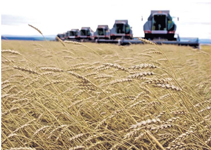
НА ФОТО: ВЫСОКИЙ УРОЖАЙ ПРИХОДИТСЯ ПРОДАВАТЬ ПО ЦЕНАМ НИЖЕ СЕБЕСТОИМОСТИ

— Не рады мы этому урожаю, потому что цены на зерно нет. Радости