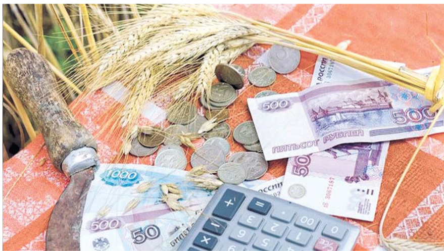
НА ФОТО: ЧЕТКИХ КРИТЕРИЕВ ЭФФЕКТИВНОСТИ ИСПОЛЬЗОВАНИЯ ГОСПОДДЕРЖКИ НЕТ

го распоряжения государственными деньгами, однако зачастую «корень зла» — в другом.