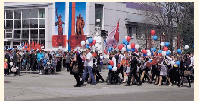
НА ФОТО: ШКОЛЬНИКИ КРАСНОЗЕРСКОГО РАЙОНА