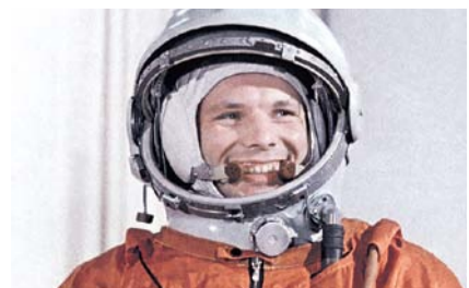
НА ФОТО: ЮРИЙ АЛЕКСЕЕВИЧ ГАГАРИН