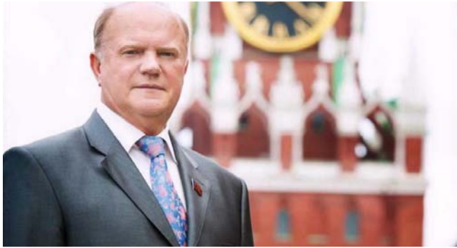
НА ФОТО: ЛИДЕР КПРФ ГЕННАДИЙ ЗЮГАНОВ