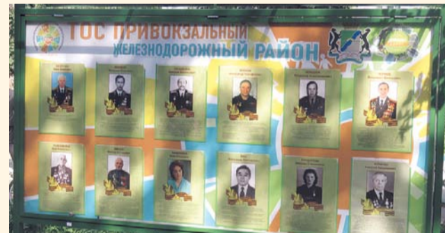
НА ФОТО: ДОСКА ПОЧЕТА