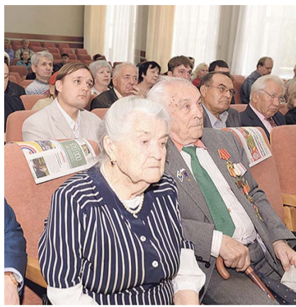
НА ФОТО: Вы

Но, пожалуй, самые впечатляющие успехи достигнуты в развитии социальной инфраструктуры. Мэрия Новосибирска выполнила программу по детским садам, обеспечив места всем детям от 3-х до 7 лет — более 15 тысяч путевок. В этом году в городе шло строительство 6 новых школ, 2 из них — в Первомайском и Октябрьском районах — открылись 1 сентября. Такого строительства школ в Новосибирске не было с Советского времени. Анатолий Локоть подчеркнул, что несмотря на финансовые трудности, город будет выполнять обязательства в сфере образования — ведь только в этом году в первый класс пошло более 20 тысяч детей, на 2 тысячи больше, чем в прошлом.