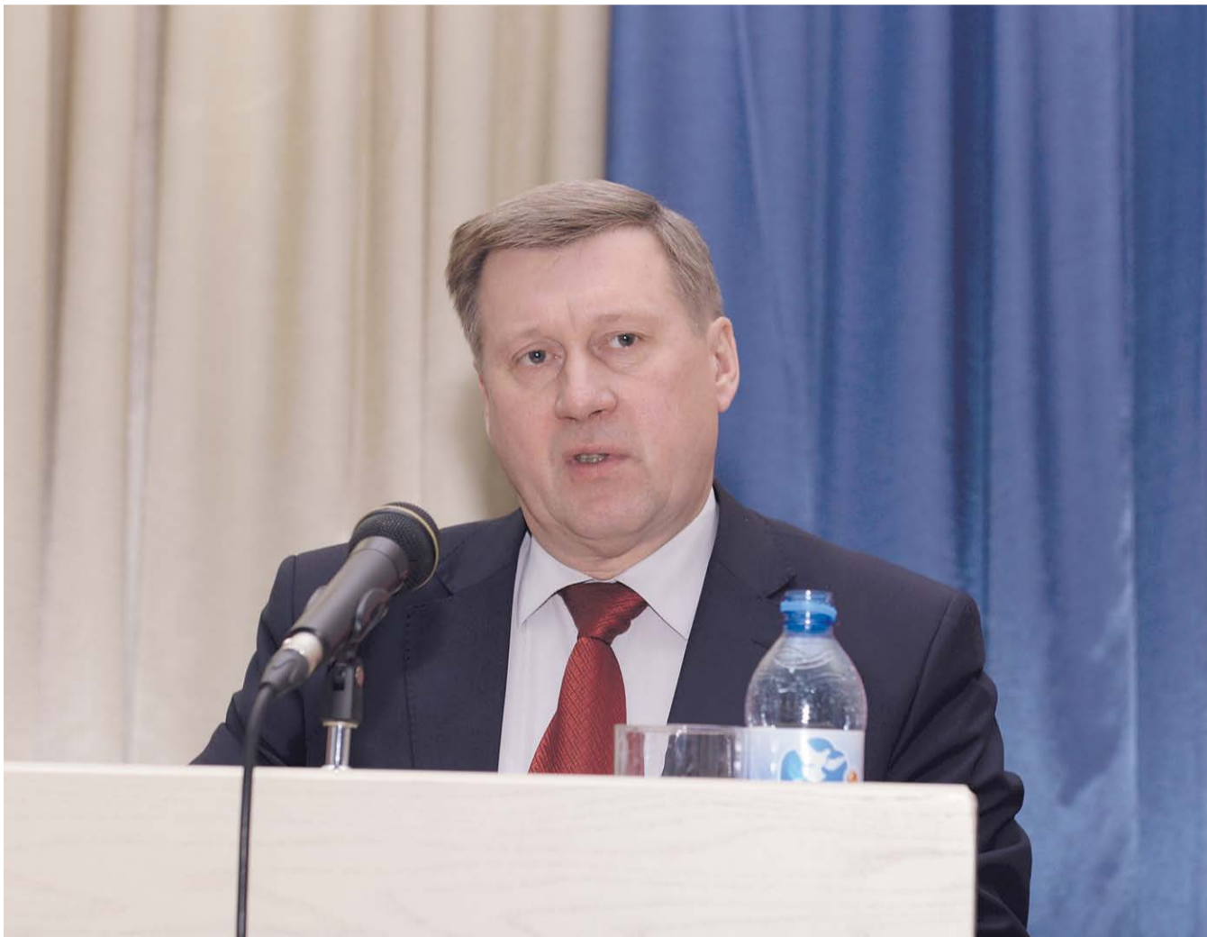
НА ФОТО: МЭР НОВОСИБИРСКА АНАТОЛИЙ ЛОКОТЬ РАССКАЗАЛ КОММУНИСТАМ О ДОСТИЖЕНИЯХ НА ПОСТУ ГЛАВЫ ГОРОДА