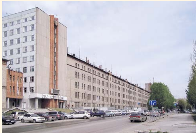
НА ФОТО: ПРОХОДНАЯ ПО «СЕВЕР»

В настоящее время решается судьба производственного объединения «Север» в Калининском районе и его коллектива.