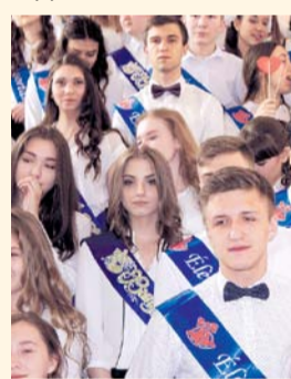
НА ФОТО: ВЫПУСКНИКИ