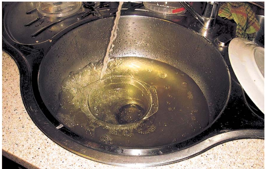
НА ФОТО: ЗА ТАКУЮ ВОДУ КОЛЫВАНЦЫ МОГУТ НЕ ПЛАТИТЬ, НО ЭТО НЕ РЕШЕНИЕ ПРОБЛЕМЫ