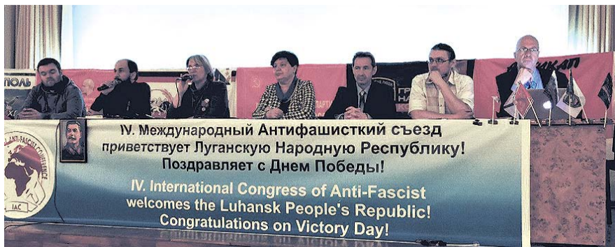
НА ФОТО: ПРЕЗИДИУМ АНТИФАШИСТСКОГО СЪЕЗДА

— В заявлении съезда четко указано, что открытая пропаганда фашизма стала возможной после Евромайдана, но проводилась и ранее. Героизация пособников фашистов во времена Великой Отечественной войны, переписывание истории с подменой понятий и исторических фактов о роли Советского народа в этой войне — все это вызывает неприятие во всем мире. Причем Украина после Евромайдана заняла позорное первое место в этом процессе, опередив даже страны Балтии. Ультра-