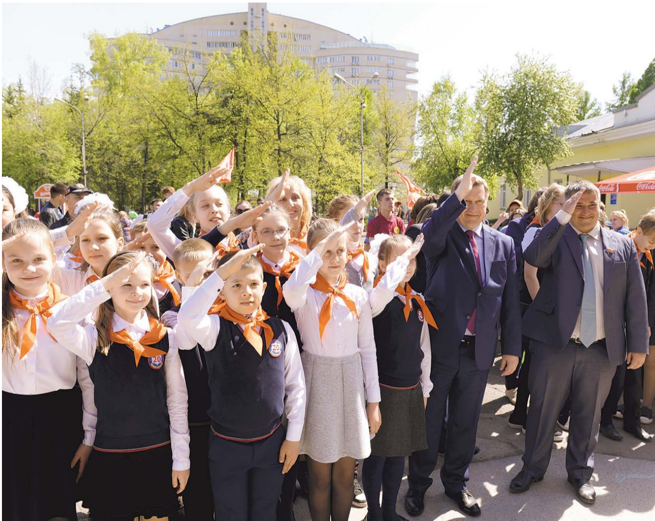
НА ФОТО: РЯДЫ ПИОНЕРОВ ПОПОЛНИЛИСЬ