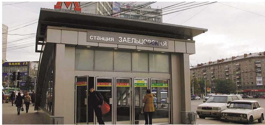
НА ФОТО: СТАНЦИЯ МЕТРО СОХРАНИЛА ПРЕЖНЕЕ НАЗВАНИЕ