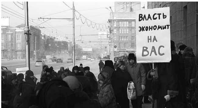
■ НА ФОТО: ПЕРВАЯ АКЦИЯ ЗАКОНЧИЛАСЬ «ШТУРМОМ» МЭРИИ

15 сентября около областной администрации пройдет акция протеста по поводу возврата безлимитного проезда пенсионерам. С декабря 2010 года акции проходят регулярно. И результаты уже есть. Власть пошла навстречу протестующим, вернув безлимитный проезд части льготников. Но люди продолжают требовать полного возврата льготы.