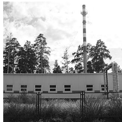
■ НА ФОТО: А ВЫГЛЯДИТ КАК НОВАЯ

Еще один вопрос, который возникает у депутатов и общественности — это эксплуатация объекта. Приемку котельной и ее «доводки» проводили муниципальные коммунальщики. Но обслуживать ее будет сторонняя коммерческая фирма. Это при том печальном опыте, когда в Мошковском районе одна из котельных была за бесценок продана коммерсантам, а после срыва