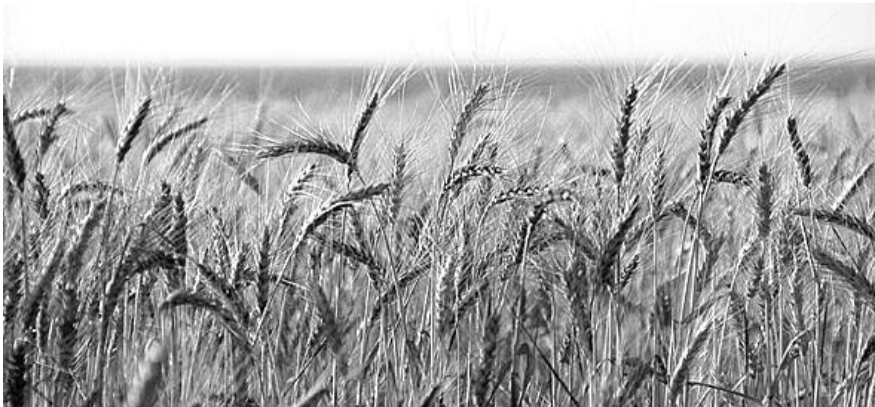
■ НА ФОТО: УБИРАТЬ БЫ ТО, ЧТО УДАЛОСЬ ВЫРАСТИТЬ