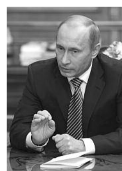
● НА ФОТО: ВЛАДИМИР ПУТИН

Лидер «Единой России» Владимир ПУТИН на межрегиональной конференции в Череповце раскрыл детали предвыборной экономической программы партии (ее примут 23-24 сентября на съезде «Единой России»). Главной инициативой будет среднесрочное увеличение госрасходов за счет роста дефицита бюджета и наращивания госзаимствований.