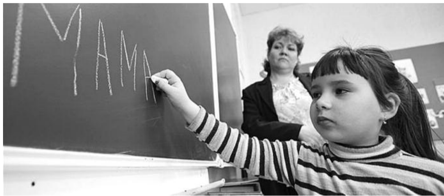
● НА ФОТО: ШКОЛУ В МАСЛЯНИНСКОМ РАЙОНЕ ОТСТОЯЛИ, А ВОТ В КОЧЕНЕВСКОМ — НЕТ

А 31 августа «Первый канал» показал проблемный сюжет о школе. В сюжете журналист рассказал о планируемом открытии гостиницы в помещении школы, дал высказаться возмущенным учителям, директору школы, а также получил подтверждение о планах на здание у местной чиновницы из райотдела образования. В сюжете показали и дорогу, по которой детям придется совер-