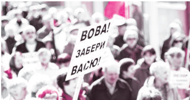
■ НА ФОТО: «БЕЗЛИМИТНЫЙ» МИТИНГ 15 АПРЕЛЯ 2011 ГОДА

Представители КПРФ принимают активное участие в протестных мероприятиях против уничтожения транспортных льгот. В частности, коммунисты Центрального райкома не пропускают ни одной акции протеста. Кроме КПРФ, в протесте против отмены безлимитного проезда принимают участие различные общественные силы. Людей не становится меньше, так как жители Новосибирска намерены отстаивать права представителей старшего поколения. Только «Единая Россия» идет против народа, отказываясь решать данную проблему.