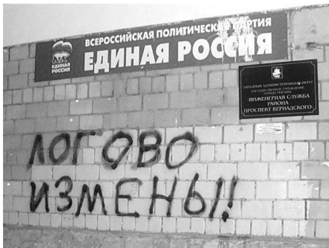
■ НА ФОТО: НАРОД НЕ ОБМАНУТЬ