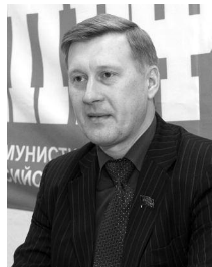
■ НА ФОТО: АНАТОЛИЙ ЛОКОТЬ

Серьезные споры предстоят вокруг закона «Об образовании». Наша фракция пред-