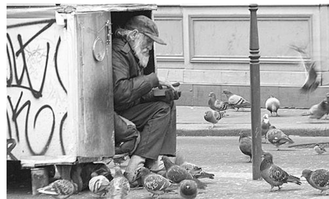
● НА ФОТО: ГОРОД СОЦИАЛЬНО НЕЗАЩИЩЕННЫХ ЛЮДЕЙ

На фоне пиара партии «Единая Россия» и правящего режима о «народном бюджете» и о «народной программе» незаметно прошла информация министерства экономи-