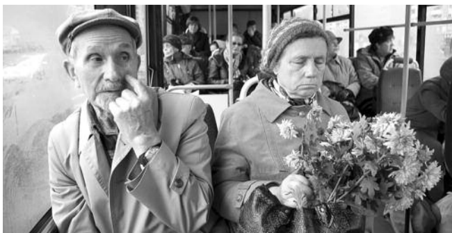
■ НА ФОТО: ОЧЕРЕДНАЯ АКЦИЯ СОСТОИТСЯ 15 СЕНТЯБРЯ