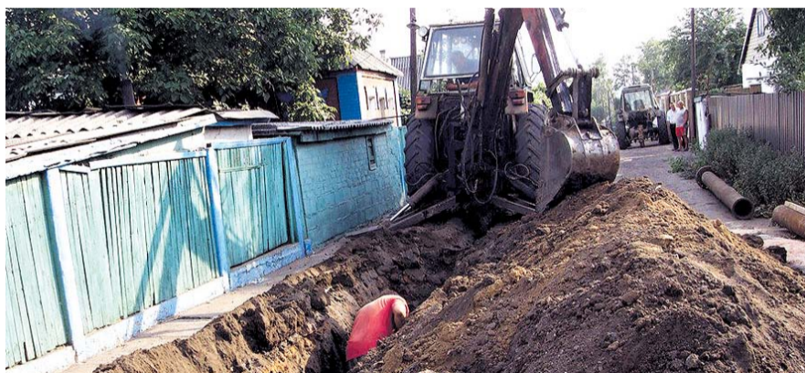
НА ФОТО: МНОГИЕ ПРОБЛЕМЫ ЖКХ В РАЙОНАХ ОБЛАСТИ НУЖНО РЕШАТЬ ЗАКОНОДАТЕЛЬНО

С тем, что надо учитывать областную специфику, депутаты могли согласиться, но опыт работы на сельских