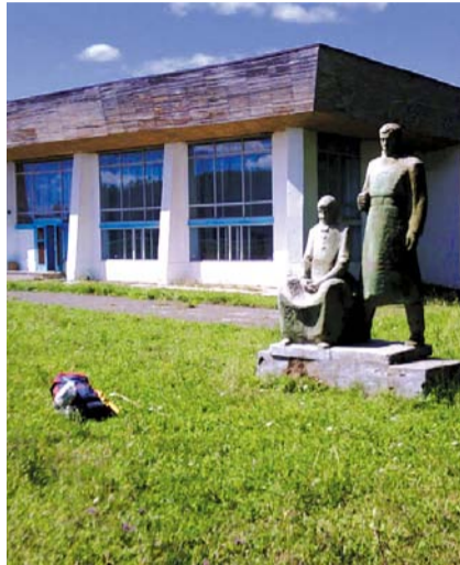
НА ФОТО: ШКОЛА В с. ВЕРХ-ИКИ

Та же участь, по словам верх-иковцев, ожидает и детский сад. Еще летом туда под разными предложениями