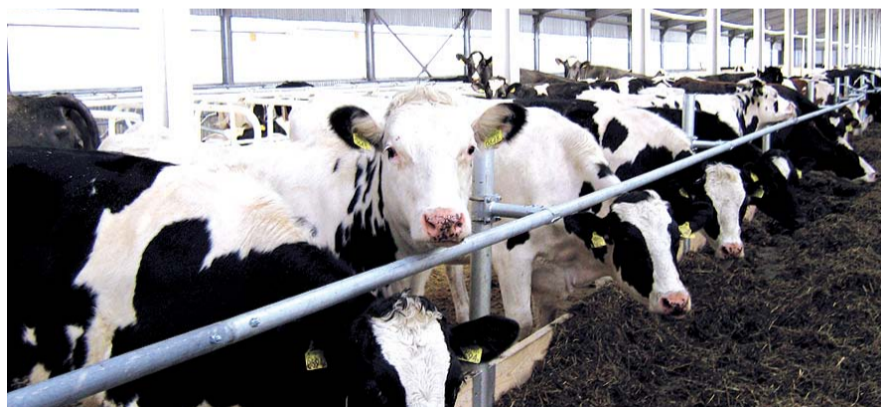
НА ФОТО: ПОКАЗАТЕЛИ РАСТУТ ЗА СЧЕТ ОДНОГО ХОЗЯЙСТВА, А ДЕСЯТКИ — ГИБНУТ