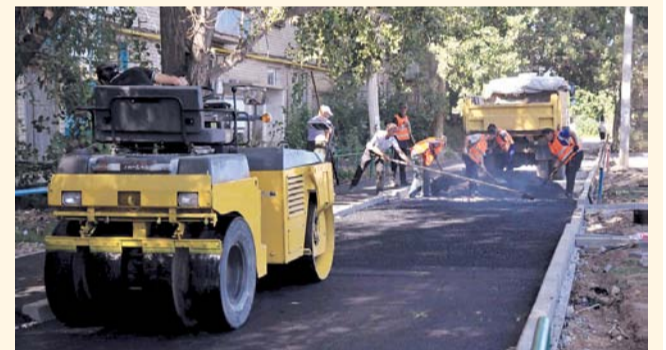
НА ФОТО: В СЛЕДУЮЩЕМ ГОДУ ОБЪЕМ РАБОТ БУДЕТ УВЕЛИЧЕН