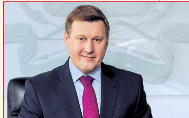
НА ФОТО: АНАТОЛИЙ ЛОКОТЬ

Мэр Новосибирска Анатолий ЛОКОТЬ заявил, что одной из приоритетных задач муниципалитета является попадание в федеральную программу «Безопасные и качественные дороги».