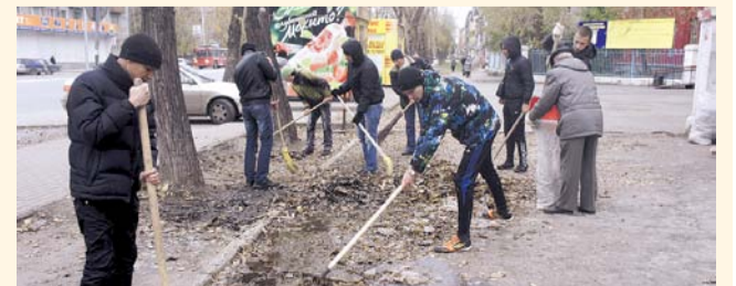
НА ФОТО: БЫЛО УБРАНО ПОЧТИ 5 ТЫСЯЧ ТОНН МУСОРА