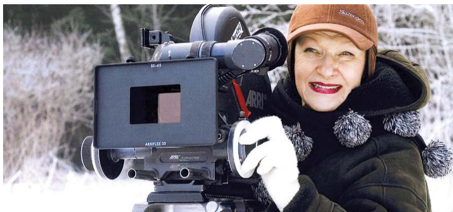
НА ФОТО: СВЕТЛАНА ДРУЖИНИНА

С детских лет жизнь Светланы Дружининой была связана с искусством. Вначале она училась в цирковом училище и даже немного выступала на арене, а затем 10 лет посвятила занятиям балетом. К сожалению, из-за травмы руки балеринной стать ей так и не удалось. Случайность привела Светлану Дружинину на съемочную площадку фильма «За витриной универмага». Поэтому учиться во ВГИК девушка пришла, уже будучи известной актрисой благодаря этому фильму. Самыми яркими актерскими работами в биографии Светланы Дружининой стали «Девчата» и «Дело было в Пенькове». Несмотря на успех и востребованность в этом качестве, она увидела свое предназначение совершенно в другом. Ради этого актриса снова начала учиться во ВГИКе, но уже на режиссерском отделении. Благодаря ей увидели свет такие полюбившиеся зрителям картины, как «Сватовство гусара», «Дульсинея Тобосская», «Принцесса цирка» и другие. С ней с удовольствием работали известные талантливые актеры Михаил БОЯРСКИЙ , Наталья ГУНДАРЕВА , На-