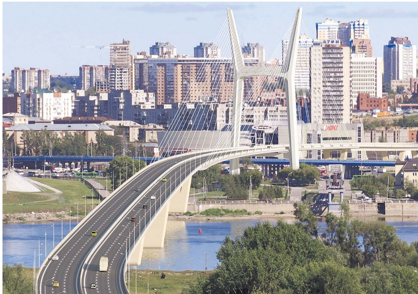
НА ФОТО: ЗА ЧЕЙ СЧЕТ БУДЕТ РЕАЛИЗОВАН ЭТОТ МАСШТАБНЫЙ ПРОЕКТ?