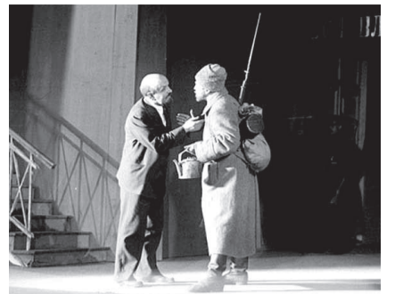
НА ФОТО: СЦЕНА ИЗ СПЕКТАКЛЯ «ЧЕЛОВЕК С РУЖЬЕМ»

В том, что театр обладает свойством, которого нет ни у одного из других искусств. В театре зрители общаются с живым человеком — актером, который прямо у них на глазах вдохновенно творит свое искусство.