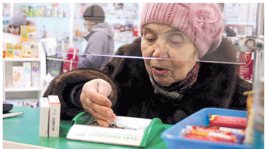
НА ФОТО: В СВОЕМ ОТЕЧЕСТВЕ НЕТ ЛЕКАРСТВ СОБСТВЕННОГО ПРОИЗВОДСТВА

Для краткости и пушего эффекта ее назвали «Фарма-2020». И она, в частности, предусматривала, что к 2020 году доля препаратов отечественного производства на рынке вырастет до 50% (правда, в денежном выражении). В реальности все с точностью до наоборот: российские заводы заявляют об