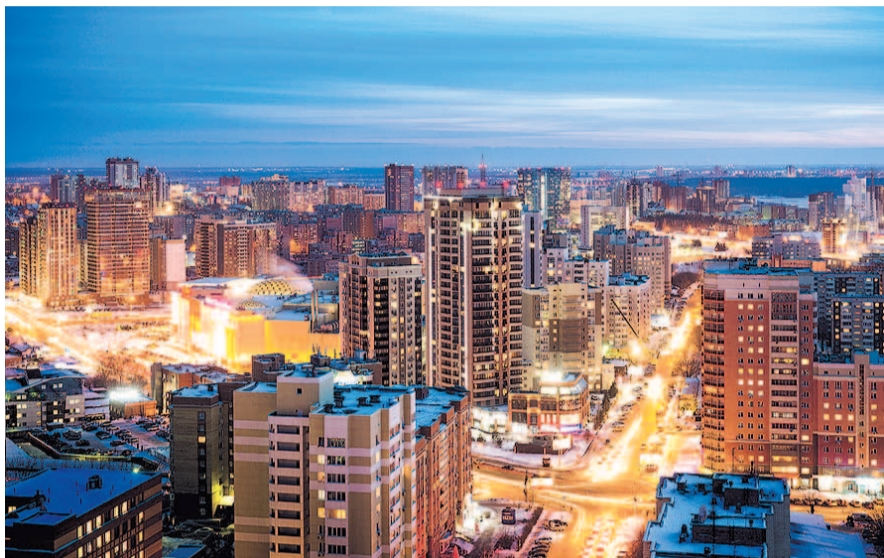
НА ФОТО: НОВОСИБИРСК — КРУПНЕЙШИЙ ЗА УРАЛОМ ГОРОД РОССИИ

25 февраля в концертном зале имени Арнольда КАЦА Новосибирской филармонии состоялось общегородское собрание, посвященное подведению итогов социально-экономического развития Новосибирска за пять лет. Мэр города Анатолий ЛОКОТЬ отметил, что для развития Новосибирска сделать удалось многое, но впереди предстоит еще много работы. Первые лица города и области пожелали Новосибирску пройти выборный год «без потрясений и перемен».