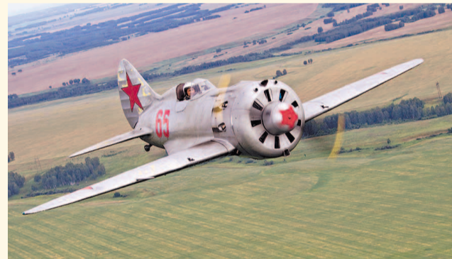
НА ФОТО: ПЕРВЫЙ В МИРЕ СЕРИЙНЫЙ ВЫСОКОСКОРНОСТНОЙ НИЗКОПЛАН С УБИРАЮЩИМСЯ ШАССИ