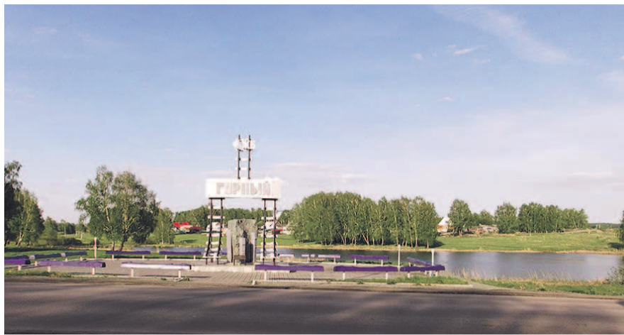
НА ФОТО: НЕКОТОРОЕ ВРЕМЯ НАЗАД В ГОРНОМ СОБИРАЛИСЬ МОДЕРНИЗИРОВАТЬ ВОДОЗАБОР, НО БЕЗ РЕШЕНИЯ ПРОБЛЕМЫ СТОКОВ ЭТО БУДЕТ БЕСПОЛЕЗНОЙ РАБОТОЙ

Отсутствие очистных — вроде бы для России обычное явление, но дело в том, что водозабор в Горном находится