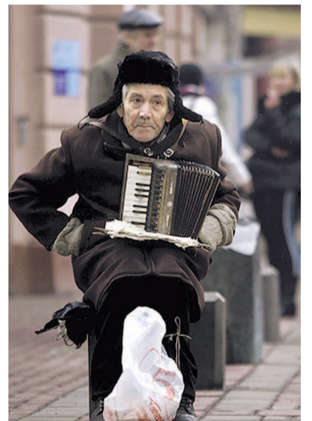
НА ФОТО: В СТРАНЕ БОРЮТСЯ НЕ С БЕДНОСТЬЮ, А С БЕДНЫМИ

«Чтобы избавиться от бедности и нищеты навсегда, людям нужно не раздавать деньги, которые на самом деле возьмут из их же карманов — с налогов (на бизнес тех же самих людей, акцизов и так далее), а ускорить — и не по-росстатовски, а по-настоящему — экономическое развитие страны», Эксперт считает, что бедность это «не счетный феномен», а социально-политический. Но нацпроекты, запущенные в стране, не предполагают комплексного решения этой проблемы. Не решит ее и разовая финансовая помощь в виде различных выплат.