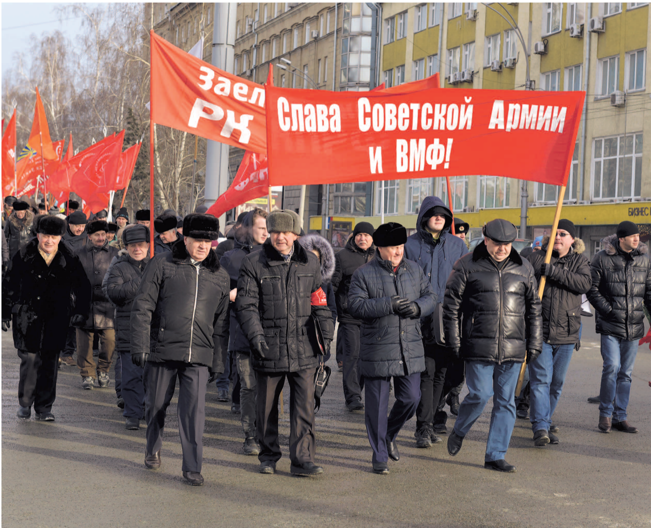
НА ФОТО: КОЛОННА ПОД КРАСНЫМИ ФЛАГАМИ, ВОЗГЛАВЛЯЕМАЯ МЭРОМ-КОММУНИСТОМ, ПРОШЛА МАРШЕМ ПО КРАСНОМУ ПРОСПЕКТУ