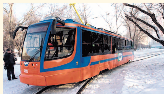
НА ФОТО: НОВЫЕ ТРАМВАИ В НОВОСИБИРСКЕ