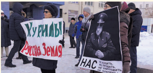
НА ФОТО: КУРИЛЫ — РУССКАЯ ЗЕМЛЯ!