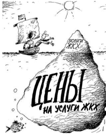
НА РИС.: ВОТ ЕСЛИ БЫ НАОБОРОТ!