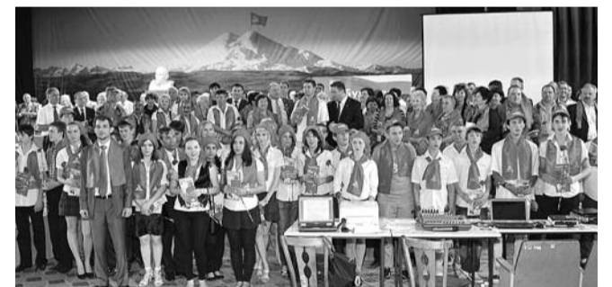
● НА ФОТО: ПАРТАКТИВ НА СЕМИНАРЕ-СОВЕЩАНИИ В ПЯТИГОРСКЕ

Как сообщает пресс-служба партии, эти слова участники семинара-совещания встретили аплодисментами. В зале, где проходило совещание, собралось, по утверждению пресс-службы, более 2 тысяч человек.