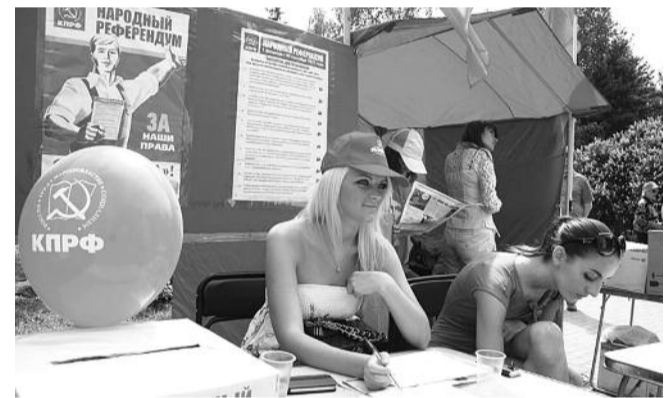
● НА ФОТО: ИДЕТ ГОЛОСОВАНИЕ ПО НАРОДНОМУ РЕФЕРЕНДУМУ