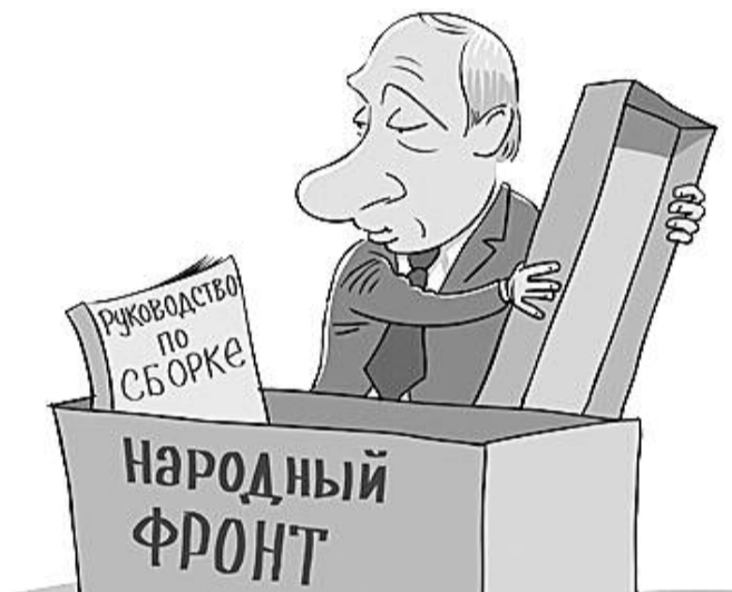
■ НА РИС.: ГЛАВНОЕ — ЧЕТКО СЛЕДОВАТЬ ИНСТРУКЦИИ

Фактически Исполком ФНПР выступил от имени всех членов профсоюзов России с решением вступить в «Общероссийский народный фронт», организуемый В.В. ПУТИНЫМ при поддержке политической партии «Единая Россия». Это новое «общественное объединение» создается в преддверии выборов в Государственную думу РФ и Президента РФ. В конечном итоге — с целью обеспечения победы указанной политической партии и себя лично. Ничего общего с интересами большинства членов профсоюза данное образование не имеет.