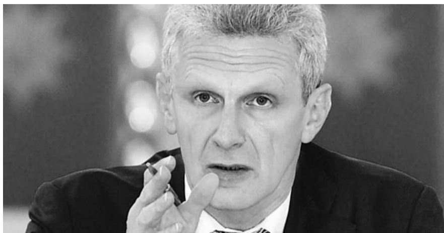
● НА ФОТО: МИНИСТР ФУРСЕНКО: «Я В ПОСЛЕДНЕЕ ВРЕМЯ ПИШУ ОДНИ РЕЗОЛЮЦИИ!»

А 6 июня, отмечая учрежденный праздник, президент Медведев в компании с министром образования оказались в Государственном институте русского языка имени Пушкина, где высоким гостям продемонстрировали технологич-