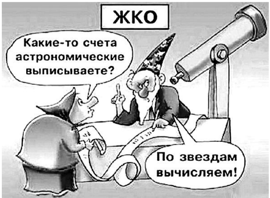
■ НА РИС.: ПОПРОБУЙ, РАЗГАДАЙ!

По материалу агентства «СВОБОДНАЯ ПРЕССА»