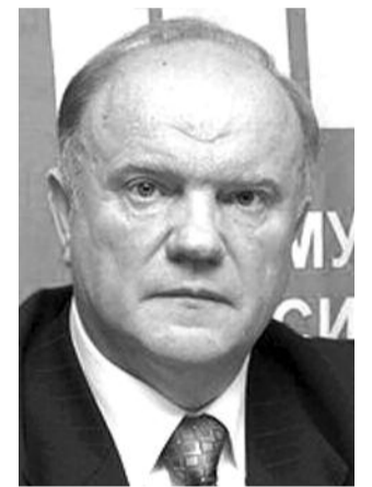
● НА ФОТО: ЛИДЕР КПРФ

КПРФ также намерена создать «Народное ополчение» в противовес «Общероссийскому народному фронту» премьер-министра Владимира ПУТИНА , сообщил в Пятигорске на семинаре-совещании партийного актива Геннадий ЗЮГАНОВ . Идею «Народного ополчения» предложили региональные отделения коммунистической партии.