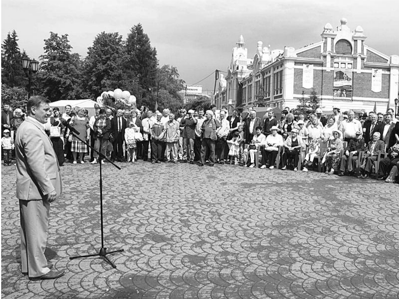
● НА ФОТО: АНАТОЛИЙ ЛОКОТЬ ОТКРЫВАЕТ IV ФЕСТИВАЛЬ ЛЕВОЙ ПРЕССЫ «ДЕНЬ ПРАВДЫ — 2011»