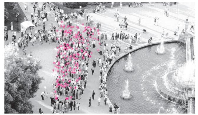
● НА ФОТО: УЧАСТНИКИ ФЛЭШМОБА СОСТАВИЛИ СЛОВО «ГАГАРИН» ИЗ КРАСНЫХ ШАРОВ, А ПОТОМ ОТПУСТИЛИ ШАРЫ В НЕБО

Финальная часть концертной программы фестиваля левой прессы в Первомайском сквере Новосибирска собрала сотни новосибирцев. Сначала восторг слушателей вызвало выступление группы «Silenzium», выпускницы консерватории просто очаровали жителей столицы Сибири своими