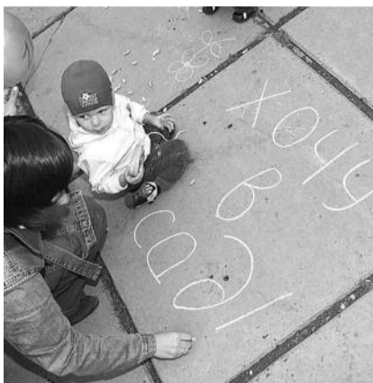
■ НА ФОТО: ДЕТИ УСТАЛИ ЖДАТЬ

Депутат Горсовета Алексей МЕДВЕДЕВ отметил, что эти предложения должны быть приняты, но тщательно проработаны: