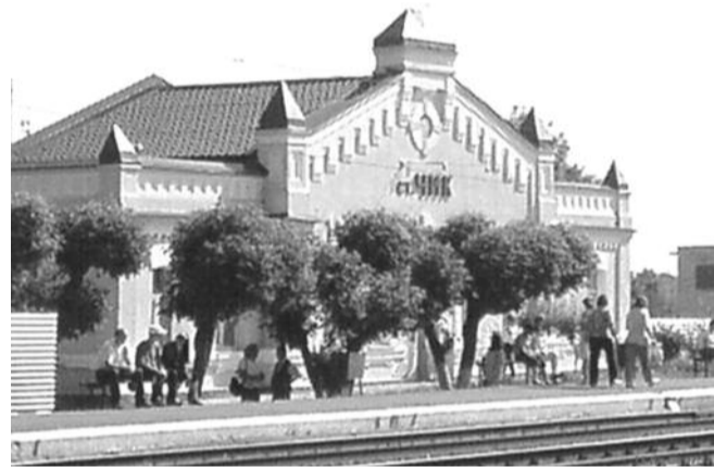
● НА ФОТО: ВЗРЫВНОЕ УСТРОЙСТВО СРАБОТАЛО ОКОЛО 14:30

Источник сообщил, что на месте ЧП обнаружены фрагменты взрывного устройства. «Сейчас идут экспертизы. Точно можно сказать, что взрывное устройство было без оболочки», — сказал собеседник агентства. По его словам, возможно, само устройство было самодельным.