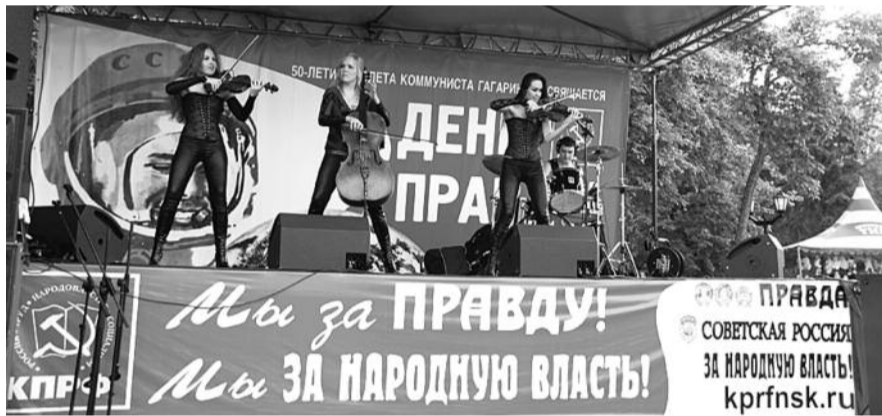
● НА ФОТО: НА ГЛАВНОЙ СЦЕНЕ ФЕСТИВАЛЯ — ГРУППА «SILENZIUM»