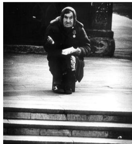
● НА ФОТО: ЭКСПЕРИМЕНТ ПО ВЫЖИВАНИЮ

Есть и еще один фактор: на 10 тыс. населения в России приходится 172 госслужащих. То есть, каждые 58 россиян кормят одного чиновника. Сейчас в России около 2,4 млн чиновников на 140 млн человек населения. А в СССР количество чиновников не превышало 400 тыс. на 300 млн.