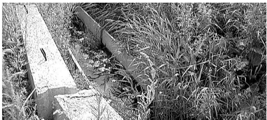
НА ФОТО: ФРАГМЕНТ СИСТЕМЫ ВОДОПОНИЖЕНИЯ ОБЩЕЙ СТОИМОСТЬЮ 36 МЛН РУБЛЕЙ