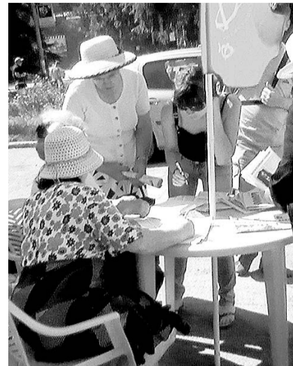
НА ФОТО: УЖЕ БОЛЕЕ 5500 ПОДПИСЕЙ

В Заельцовском районе пикеты проходят на площади Калинина в будние дни с 16 до 18 часов; в Ленинском районе — по средам и пятницам с 17 до 20 часов по адресу: ул. Станиславского, 17. В Октябрьском районе пикеты проходят ежедневно около ГПНТБ с 16 до 18 часов. В Калининском — 31 июля по адресу: ул. Рассветная, д.2/1 (ост. «Торговый центр») с 17 до 19 часов, а 2 августа по адресу: ул. Объединения, 19 (ост. «Магазин «Юбилейный») с 17 до 19 часов.