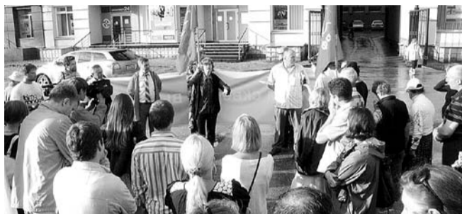
НА ФОТО: ВСТРЕЧА ДЕПУТАТА АНАТОЛИЯ ЛОКОТЬ С ЖИТЕЛЯМИ ДОМА ПО УЛ. КИРОВА, 27 ПО ВОПРОСУ ВЫРУБКИ СКВЕРА У ГПНТБ

Можно по-разному относиться к этому виду обслуживания и качеству питания, но почему это должно происходить за счет зеленых зон, за счет здоровья горожан, которые и без того сегодня страдают от критического недостатка парков и скверов? Очевидно, Новосибирск превращается в город не для новосибирцев, а для бизнеса. Мы против такой политики, и считаем, что город, прежде всего, должен быть удобен для жизни. Проблемы экологии, питания и качества жизни выходят на первый план для полуторамилионного Новосибирска.