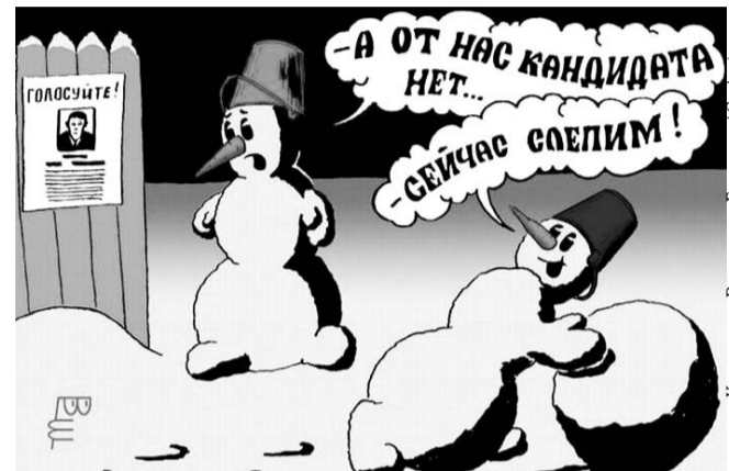
НА РИС.: ВЫДВИЖЕНИЕ ДВОЙНИКОВ — ГРЯЗНАЯ ТЕХНОЛОГИЯ

В Октябрьском районе на округе №30 8 сентября 2013 года состоятся выборы депутата городского Совета Новосибирска. Для областной администрации, а именно, вице-губернатора КОЗОДОЯ и министра ГУДОВСКОГО, выборы носят принципиальный характер, поскольку проигрыш кандидату от КПрФ будет свидетельствовать о профнепригодности высокопоставленных пиарщиков губернатора.