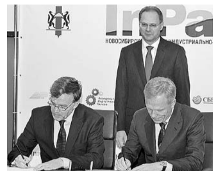
НА ФОТО: ДЕЯТЕЛЬНОСТЬ ПЛП ТЕПЕРЬ БУДЕТ ПРОВЕРЯТЬ СЛЕДСТВЕННЫЙ КОМИТЕТ

— Согласно странице 26 заключения Контрольно-счетной палаты Новосибирской области от 05.06.2013 №169/09, генеральный директор и его заместитель совмещают руководство ОАО «АИР» и ОАО УК «ПЛП», — говорится в обращении. — Указанная схема управления позволяет бесконтрольно использовать бюджетные средства,