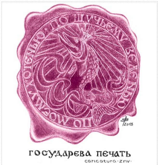
Карикатура Елены Вязановой