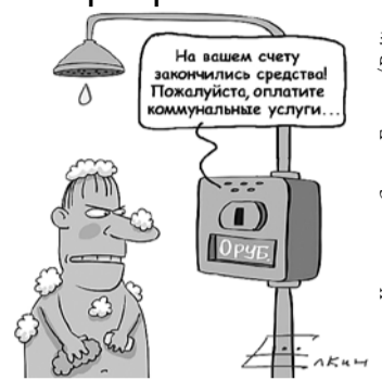
Карикатура Сергея Елкина