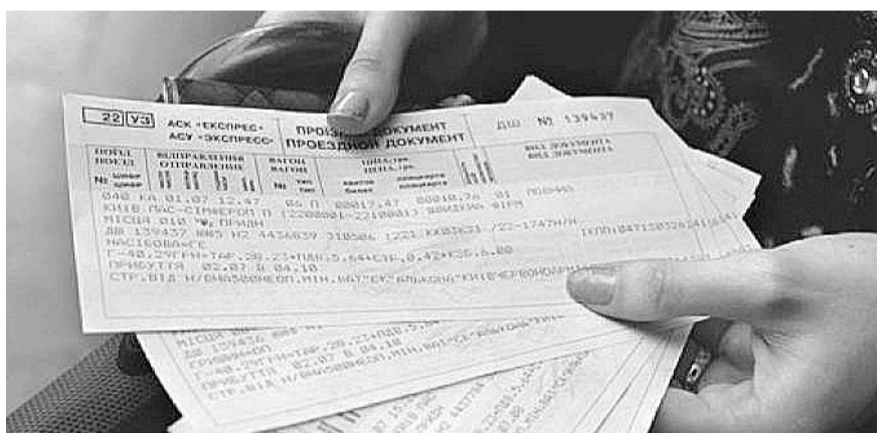
НА ФОТО: САМЫЙ ДЕШЕВЫЙ Ж/Д БИЛЕТ ИЗ НОВОСИБИРСКА В МОСКВУ СТОИТ 7500 РУБЛЕЙ