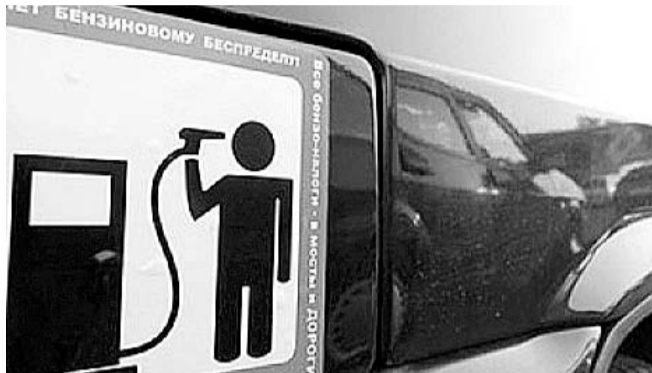
НА ФОТО: НОВАЯ ФОРМА ПРОТЕСТА. ВЫШЕ ЦЕНЫ — СИЛЬНЕЕ БУРЯ

Бензин на российских заправках продолжает дорожать. Литр АИ-95 в среднем по стране сейчас стоит 31,24 рубля, за последнюю неделю он подорожал на 15 копеек. И это не предел — к концу года автолюбители будут покупать 95-й бензин за 33 рубля, рассчитали эксперты «Российской газеты».