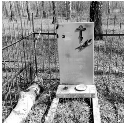
НА ФОТО: СТАРЫЕ КЛАДБИЩА НОВОСИБИРСКОЙ ОБЛАСТИ ВЛАСТЯМ НЕ НУЖНЫ

селения Новосибирской области с 2002 года сократилась на 10%. За это же время с карты области исчезло 32 сельских поселения.