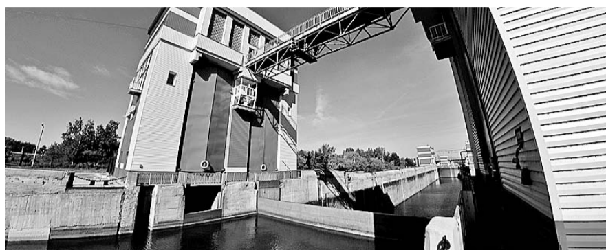
НА ФОТО: НОВОСИБИРСКИЙ ШЛЮЗ ИМЕЕТ ТРИ КАМЕРЫ ДЛИНОЙ 148 МЕТРОВ

Законом предусмотрен переходный период: до 1 июля 2013-го по учету воды и тепла, и до 1 января 2016-го — по учету газа. После этих сроков управляющие и энергоснабжающие организации будут вправе устанавливать общедомовые и индивидуальные счетчики, как сказано в законе, «в принудительном порядке». А их стоимость и затраты на установку частями включат в платежи.