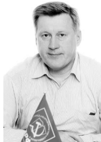
НА ФОТО: АНАТОЛИЙ ЛОКОТЬ

Очень важной для новосибирцев становится тема благоустройства, экологии и качества жизни. Раньше горожане гордились тем, что Новосибирск был зеленым городом. Сегодня мы видим, что с парками, скверами ведется целенаправленная борьба. Под видом благоустройства разворачивается строительство в последних зеленых уголках города. Одно из самых популярных мест отдыха горожан — Заельцовский парк, вопреки всем установленным нормам, застраивают ресторанами и увеселительными заведениями. Несмотря на протесты жителей, вырубил голубые ели на Вокзальной магистрали около Управления Западно-Сибирской железной дороги. Под предлогом строительства теплотрассы собираются «воткнуть» ресторан «Макдоналдс» в сквер около ГПНТБ. Более того, существует целый план внедрения в Новосибирск десятка ресторанов американского фастфуда.