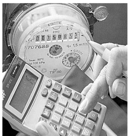
НА ФОТО: ПЛАТИТЬ ЗА УСТАНОВКУ И САМИ СЧЕТЧИКИ ПРИДЕТСЯ ЖИЛЬЦАМ

Практика применения домовых и квартирных счетчиков начала складываться в России совсем недавно — с 2002-2003 годов. Жильцы, установившие в квартирах счетчики горячей и холодной воды в 2005-2007 годах, уже столкнулись с проблемой поверки. А ее, напомним, нужно проводить раз в четыре года для счетчиков горячей воды и раз в шесть лет — холодной.