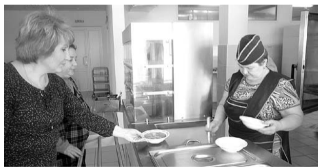
НА ФОТО: ПРОВЕРКА ВЫЯВИЛА СУЩЕСТВЕННЫЕ НАРУШЕНИЯ

— Существуют официально принятые общероссийские нормы питания, которые определяют количество и качество необходимых школьникам продуктов, — говорит директор Си-