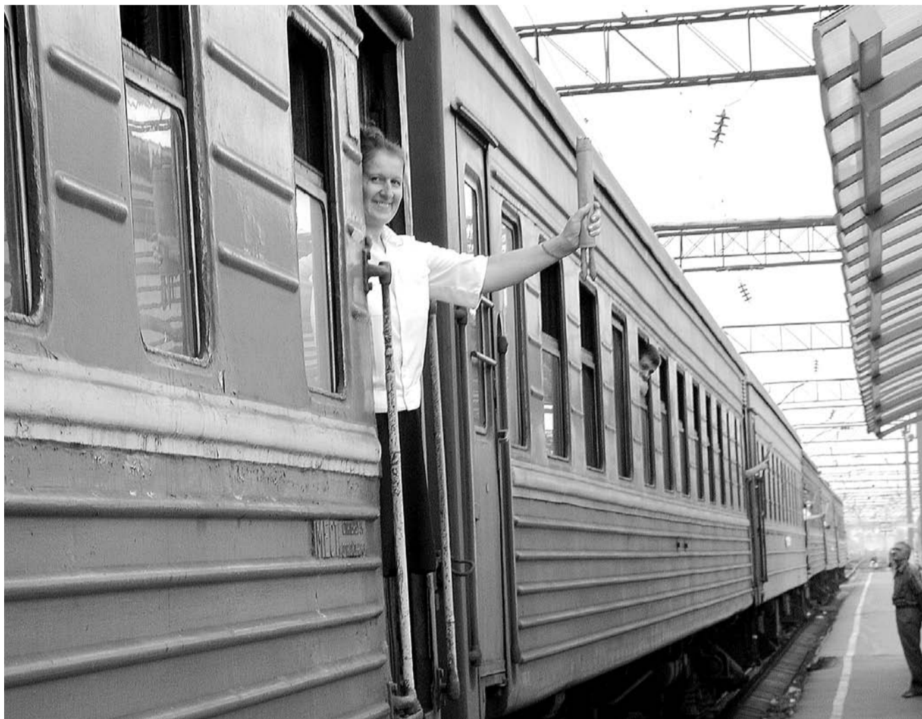
НА ФОТО: ДОЕХАТЬ ИЗ ОДНОГО КОНЦА СТРАНЫ В ДРУГОЙ НА ПОЕЗДЕ ТЕПЕРЬ НЕ НАМНОГО ДЕШЕВЛЕ, ЧЕМ ДОЛЕТЕТЬ НА САМОЛЕТЕ