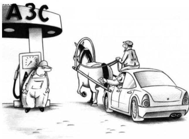
● НА РИС.: ПОРА ВОЗВРАЩАТЬСЯ К ЛОШАДИНЫМ СИЛАМ?

В свою очередь, нефтяники видят главную причину растущего топливного коллапса в действиях самой ФАС. Искусственное зажимание цен привело к смене приоритетов и выходу на первый план экспортной альтернативы, а февральское решение ФАС, с точки зрения ведомства, решающее проблему недопущения роста цен, — продажу 15% от объема производства нефтепродуктов каждой компанией на бирже — сделало покупателя определяющим направлением топлива.