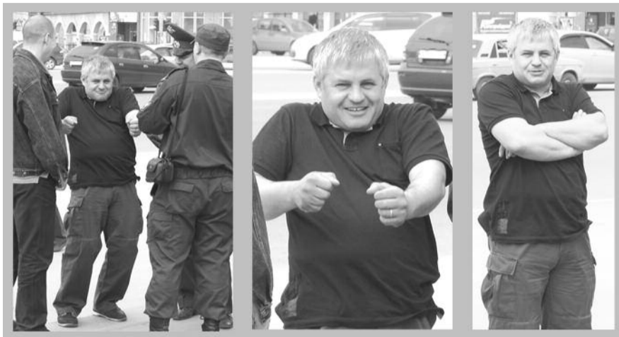
● НА ФОТО: ПАНТОМИМА «ПУЛЕМЕТЧИК» В ИСПОЛНЕНИИ ЧЕЛОВЕКА В ШТАТСКОМ

В день 22 апреля, когда коммунисты проводили традиционное возложение цветов к памятнику В.И. Ленину, журналист сайта KPRFNSK.RU наблюдал вызывающее поведение «человека, похожего на сотрудника полиции». Находясь в группе сотрудников правоохранительных органов, «приписанных» к наблюдению за пикетом, человек в штатском в красноречивых жестах показал своим зрителям в форме, как он расстреливает из воображаемого станкового пулемета коммунистов, собравшихся на возложение цветов.