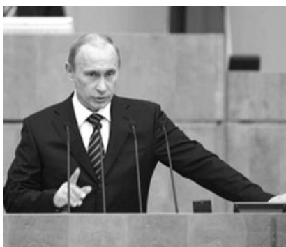
● НА ФОТО: МАСТЕР ОБЕЩАНИЙ С ТРИБУНЫ