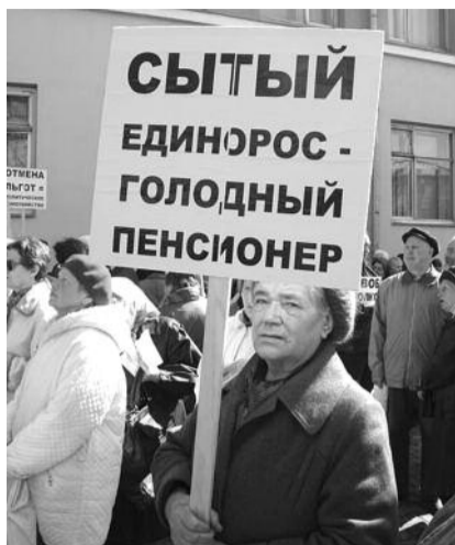
● НА ФОТО: КОНТРАСТ НАШЕЙ ЖИЗНИ

зили в правах. А если уж идти по навязанному областной властью пути «экономического обоснования» льготного проезда для пенсионеров, то 30 поездок, даже если считать по-губернаторски, недостаточно.