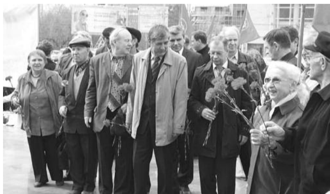
● НА ФОТО: ВОЗЛОЖЕНИЕ ЦВЕТОВ В ЧЕСТИ ДНЯ РОЖДЕНИЯ ВОЖДЯ

Активисты КПРФ и представители левых организаций и движений возложили цветы к памятнику Владимиру Ильичу ЛЕНИНУ на одноименной площади в честь дня рождения вождя мирового пролетариата. В митинге и возложении цветов приняли участие более ста человек.