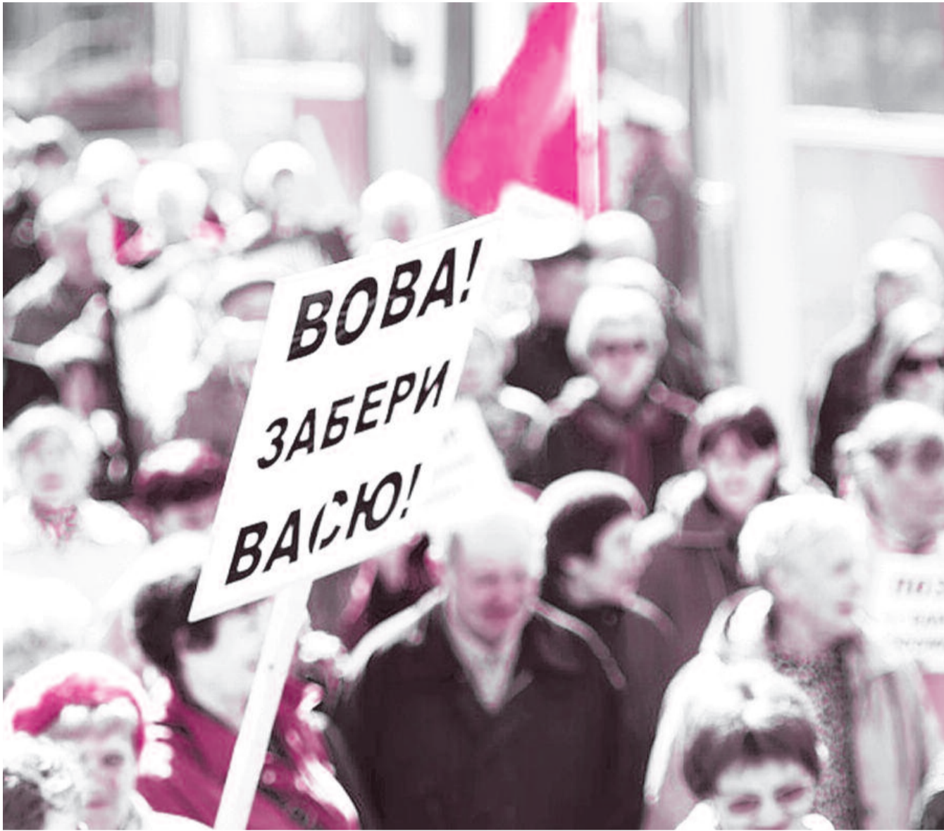
● НА ФОТО: ОДИН ИЗ ПЛАКАТОВ УЧАСТНИКОВ МИТИНГА ПРОТИВ ОТМЕНЫ БЕЗЛИМИТНОГО ПРОЕЗДА 15 АПРЕЛЯ 2011 ГОДА