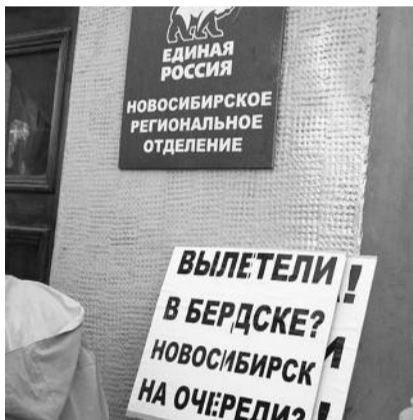
● НА ФОТО: СТРАШНО, ГОСПОДА?

проезд небольшой части льготников, протестные мероприятия по-прежнему собирают большое число новосибирцев. Горожане продолжают требовать возврата безлимитного проезда для всех без исключения категорий льготников.