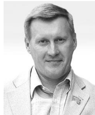
● НА ФОТО: АНАТОЛИЙ ЛОКОТЬ

В этот день мы отмечаем не просто праздник весны и труда, мы отмечаем день борьбы трудящихся за свои права, день международной солидарности. В этот день мы объединяем силы оппозиционных партий, чтобы совместно выступить в защиту гражданских и политических прав.