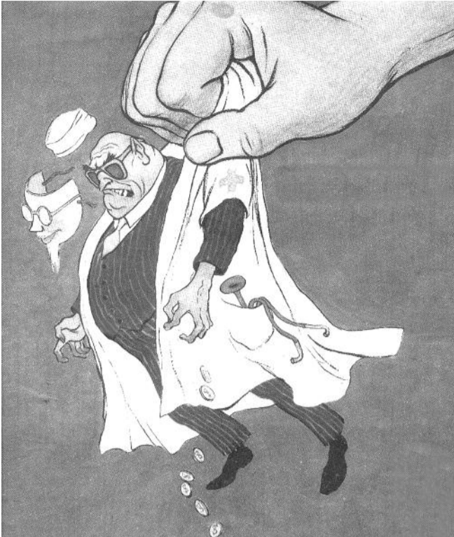
● НА РИС.: ЛЕОНИД РОШАЛЬ РАССКАЗАЛ ПРАВДУ О КОРРУМПТИРОВАННОЙ СИСТЕМЕ ЗДРАВООХРАНЕНИЯ РОССИИ