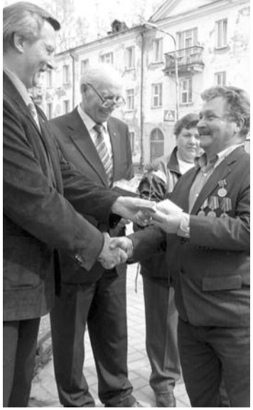
■ НА ФОТО: НАГРАДА — КОММУНИСТУ

22 апреля коммунисты Первомайского района и их сторонники собрались на пикет возле памятника Ленину в сквере городка НЭРЗ, чтобы возложить цветы к памятнику Вождю Мирового Пролетариата.