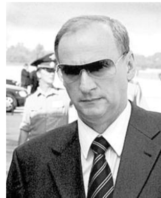
● НА ФОТО: ГЛАВНЫЙ КОРРУПЦИОНЕР ПО ВЕРСИИ САЙТА

В пятницу на новом сайте со значительным названием Election2012.ru («Выбор-2012») опубликована первая часть доклада о коррупции в российском правительстве. От множества подобных материалов на эту тему его отличает то, что в нем приведены четкие и в меру подробные сведения не только о министрах, но и об их родственниках и друзьях, что дает гораздо более полную картину. Называется документ «Власть Семей — 2011. Правительство. Часть 1».