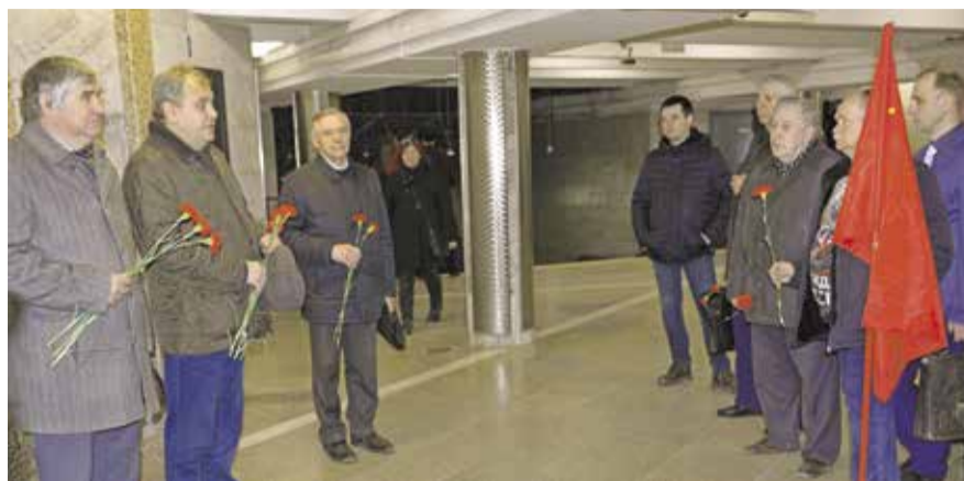
НА ФОТО: КОММУНИСТЫ НОВОСИБИРСКА ВОЗЛОЖИЛИ ЦВЕТЫ К БАРЕЛЬЕФУ ЮРИЯ ГАГАРИНА НА СТАНЦИИ МЕТРО «ГАГАРИНСКАЯ»