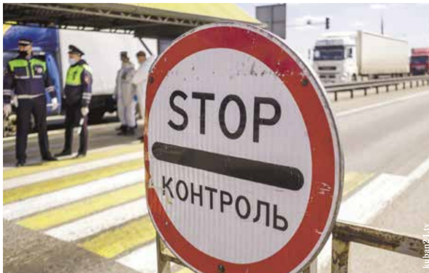
НА ФОТО: ТЕМ, КТО БЕЖАЛ ИЗ СТРАНЫ В ТРУДНОЕ ВРЕМЯ, — НАЗАД ДОРОГИ НЕТ

Из-за политической и экономической ситуации граждане России отнюдь не рвутся из страны, с удивлением отмечают «либеральные» социологи. Тех, кто уехал, россияне называют предателями и предлагают лишать гражданства.