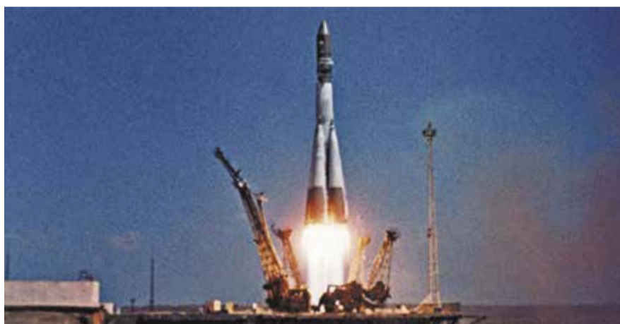
НА ФОТО: КОРАБЛЬ ВОСТОК-1 С ПЕРВЫМ В МИРЕ КОСМОНАВТОМ НА БОРТУ

Полет Юрия ГАГАРИНА 12 апреля 1961 года сделал прорыв в сфере советской космонавтики. Пика развития отрасль достигла в 1980-е годы, а в 1990-е все надежды на ее развитие рухнули. С какими заботами отрасли приходится сталкиваться сегодня?