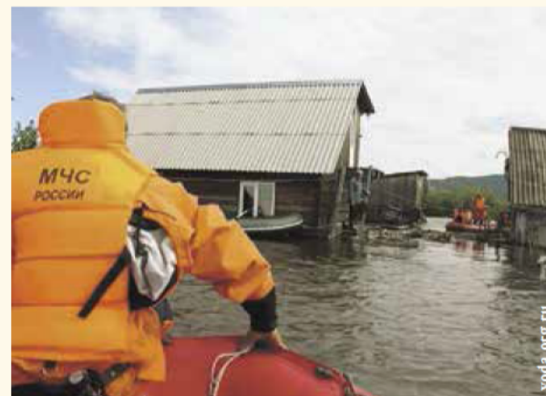
НА ФОТО: «БОЛЬШАЯ» ВОДА НАСТУПАЕТ

Из-за обильного таяния снега в ряде населенных пунктов Новосибирской области фиксируются локальные подтопления. Один из примеров — Сузун.