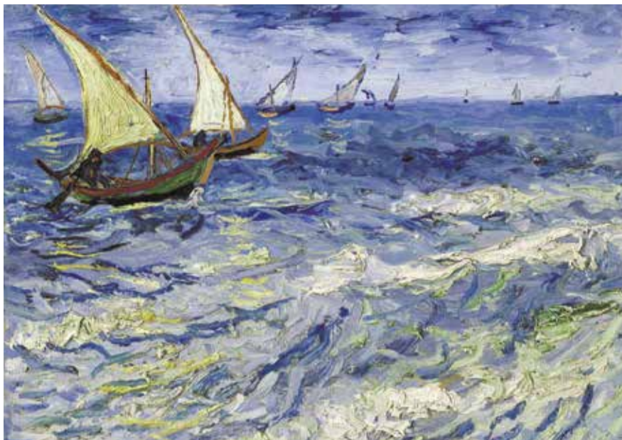
НА ФОТО: КАРТИНА ВИНСЕНТА ВАН ГОГА «МОРСКОЙ ПЕЙЗАЖ В СЕН-МАРИ», КОТОРОЙ УДАЛОСЬ ВЕРНУТЬСЯ В РОССИЮ

Франция конфисковала одну из российских картин, находившихся в частной коллекции. Изучается вопрос изъятия и второго полотна в рамках введенных против России санкций. Почему искусство стало разменной монетой в экономической войне России и Запада и как подобное можно расценивать?