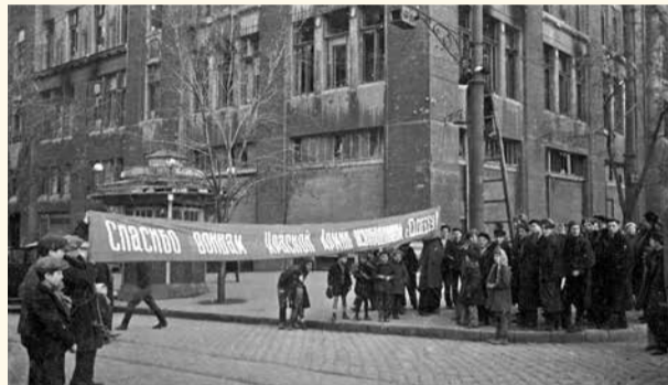
НА ФОТО: ЖИТЕЛИ ОСВОБОЖДЕННОЙ ОДЕССЫ ВСТРЕЧАЮТ ВОИНОВ КРАСНОЙ АРМИИ. 1944 ГОД.

Вечером 4 апреля началось наступление на село Свердлово, Коблево, Кошару, Тишковку. 6 апреля начались бои за высоты севернее Свердлово. В этот же день в ожесточенной схватке взята железнодорожная станция Раздельная. Во время боев противник потерял до 580 солдат и офицеров убитыми и ранеными, в плен попало 310.