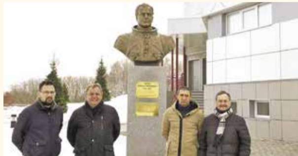
НА ФОТО: НОВОСИБИРСКИЕ КОММУНИСТЫ В МУЗЕЕ ГЕРМАНА ТИТОВА В СЕЛЕ ПОЛКОВНИКОВО

Начало космической эры — это не только первый полет Гагарина, но и второй полет Германа ТИТОВА, который состоялся 6 августа. «Космонавт № 2», Герман Степанович ТИТОВ — настоящий сибиряк, родился в Алтайском крае, закончил Сталинградское военное авиационное училище в Новосибирске.