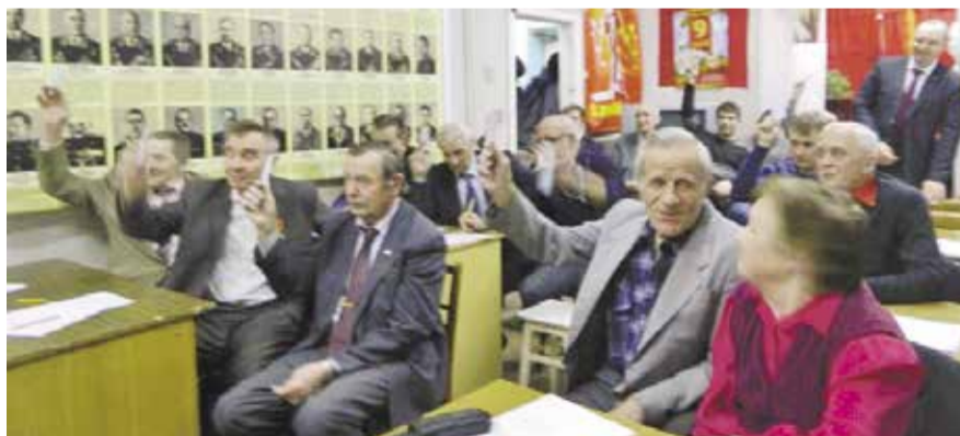
НА ФОТО: ОТЧЕТНО-ВЫБОРНАЯ КОНФЕРЕНЦИЯ КАЛИНИНСКОГО МЕСТНОГО ОТДЕЛЕНИЯ КПРФ. 2016 ГОД

Калининский район — самый молодой в Новосибирске. Когда развалился Советский Союз, а Ельцин запретил деятельность Коммунистической партии, район только отметил первое 10-летие со дня образования.