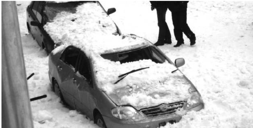
НА ФОТО: ОТ СНЕГА В НОВОСИБИРСКЕ СТРАДАЮТ И ЛЮДИ, И АВТОМОБИЛИ

Исполняющий обязанности мэра города Новосибирска Владимир ЗНАТКОВ на этой неделе страшно удивил избирателей, заявив, что мэрия города не имеет отношения к прецедентам, когда снег падает на крыши автомобилей и головы новосибирцев, причиняя серьезный ущерб здоровью и имуществу горожан. До этого заявления граждане читали в провластных агитках об «умелом хозяйственнике».