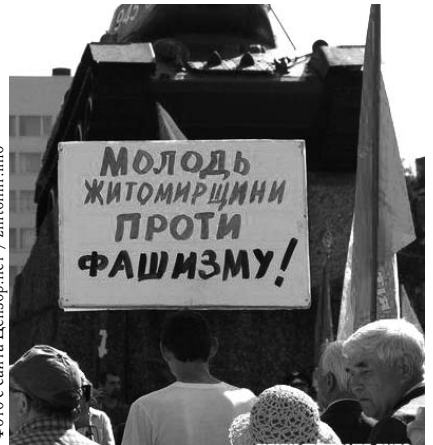
НА ФОТО: УКРАИНЦЫ БОРЮТСЯ С БЕДОЙ

На Украине Россия создавала не только промышленные и производственные центры, но и объекты стратегической обороны, и в руках ярых, порой не контролируемых свои действия людей это оружие может привести к страшным последствиям. Не случайно американцы лезут на Украину с советами и рекомендациями, это ведь не Югославия, это часть нашего оборонительного щита. Вот почему уже сегодня надо предпринять более решительные шаги по защите прав и свобод россиян и на территории Украины. И мы, россияне, решительно поддерживаем шаги правительства, президента по активизации действий против неонацистов, против 3-й мировой войны. Мы за ввод на Украину российских войск, которые в первую очередь возьмут