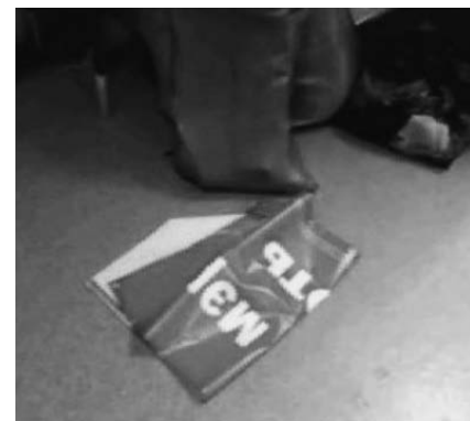
НА ФОТО: В КОМНАТЕ БЫЛ БАННЕР И ГАЗЕТЫ

Напомним, что 13 марта в штаб Анатолия Локтя поступила информация о том, что один из украденных баннеров в поддержку кандидата-коммуниста и мешки с зачищенной из почтовых ящиков агитацией находятся в помещении Общественного центра «Ельцовский» по адресу ул. Жуковского, 106а. Представители избирательного штаба Анатолия Локтя, приехав в муниципальный центр, действительно обнаружили