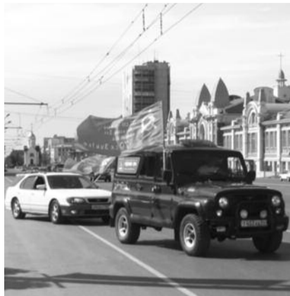
■ НА ФОТО: СТАРТ АВТОПРОБЕГА 18 ИЮНЯ

Можно ли забыть, как копию Знамени Победы вручили подполковнику Акимбеку МАМАДРИЗОБЕТОВУ , исполняющему обязанности начальника Купинской комендатуры пограничного управления ФСБ. С трепетом принимал он красное знамя, ведь офицер помнит, что летом 41-го именно пограничники первыми приняли на себя удар врага.