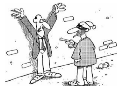
● НА РИС.: ДЕЯТЕЛЬНОСТЬ КОЛЛЕКТОРОВ БУДЕТ УЗАКОНЕНА?

пании для вступления в СРО составит от 100 тысяч рублей.