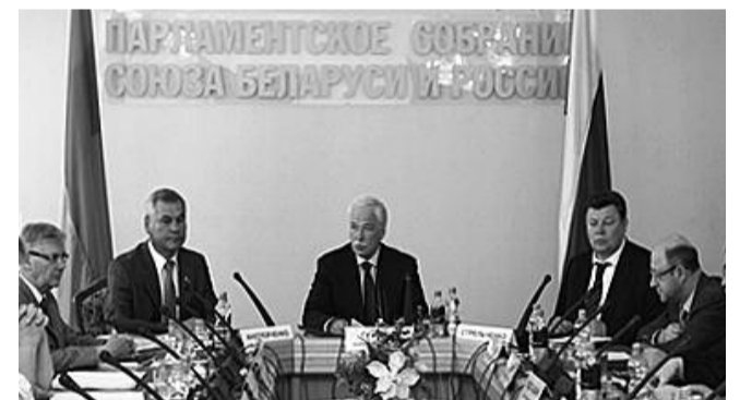
● НА ФОТО: ЗАСЕДАНИЕ СОВЕТА ПАРЛАМЕНТСКОГО СОБРАНИЯ

«Уважаемые депутаты, сегодняшние информационные блоки начались с информации о том, что российская корпорация «Интер РАО» угрожает прекратить поставку электроэнергии в Республику Беларусь. Это делается в дни не самые благоприятные для экономики Белоруссии. Это делается в дни, когда все мы отмечаем 70-летие траурной даты — начало Великой Отечественной войны. В этой связи хочу напомнить, что Белоруссия тогда, прикрыв всю державу, отдала каждого третьего своего сына. А мы, позабыв об этом, присоединяемся к ряду тех государств, которые ведут сегодня политический и экономический шантаж Белоруссии, мы присоединяемся к единой Европе, Соединенным Штатам Америки.