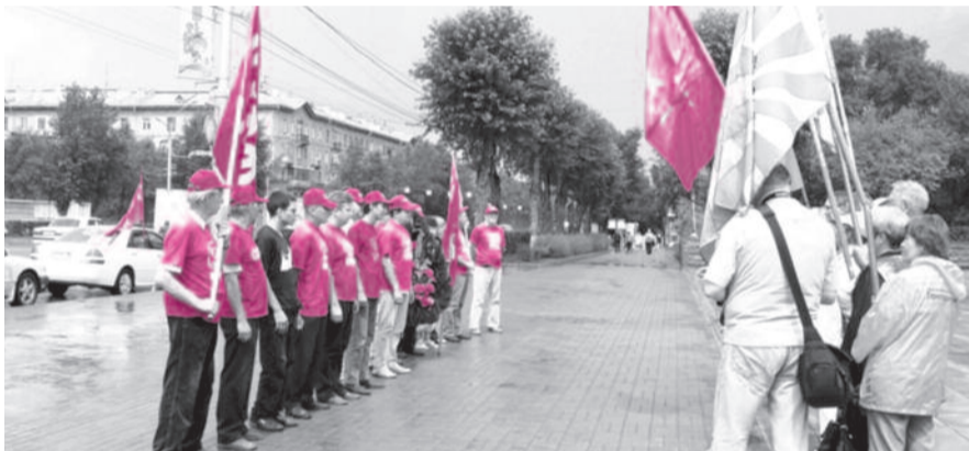
■ НА ФОТО: ФИНИШ АВТОПРОБЕГА НА МОНУМЕНТЕ СЛАВЫ В НОВОСИБИРСКЕ 22 ИЮНЯ 2011 ГОДА

В Чистоозерном в церемонии возложения цветов приняли участие не только ветераны, но и пионеры. После посещения мемориала, мы проехали к краеведческому музею, где установлен бюст товарища Сталина, и отдали дань уважения Верховному Главнокомандующему.