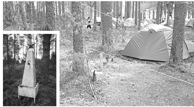
● НА ФОТО: НА ПРОШЛЫХ СЕЛИГЕРАХ ПАЛАТКИ ОТГОРАЖИВАЛИ ОТ МОГИЛ БЕЛЫМИ ВЕРЕВКАМИ

Монастырь Нило-Столобенская пустынь в Тверской области переносит кладбище, расположенное на территории, где вот уже несколько лет проводится слет «нашистов» со всей страны — «Селигер». До сих пор палатки и веселые развлечения прокремлевской молодежи соседствовали с могилами.