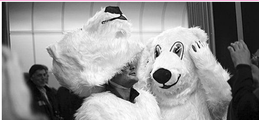
● НА ФОТО: ГОЛОВЫ С ЗАВОРОВАВШИХСЯ ПОДРЯДЧИКОВ СТАЛИ СНИМАТЬ ТОЛЬКО СЕЙЧАС

«Из опубликованной части отчета КСП ясно, что в сентябре 2007 года работы по сооружению правого перегонного тоннеля до станции «Золотая нива» подрядчик — компания ЗАО «ФСК» — оценил в 227 млн. рублей. Контракт был заключен, но в ноябре 2008 года расторгнут, а обязательства по нему выполнены не были — строители про-