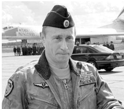
● НА ФОТО: ПИАР — ЛЮБИМОЕ ЗАНЯТИЕ ВЛАДИМИРА ВЛАДИМИРОВИЧА

Как следует из данного документа, с юридической точки зрения ОНФ не является общественным объединением, потому что не было общего собрания, принятия устава, формирования руко-