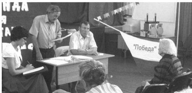
● НА ФОТО: ИДЕТ ОТЧЕТНАЯ КОНФЕРЕНЦИЯ РАЙОННОГО ОТДЕЛЕНИЯ

От представителей молодежи прозвучало предложение создать интернет-страничку Карасукского районного отделения КПРФ. Люди, которые бы занялись ее обслуживанием, в Карасуке сегодня появились.