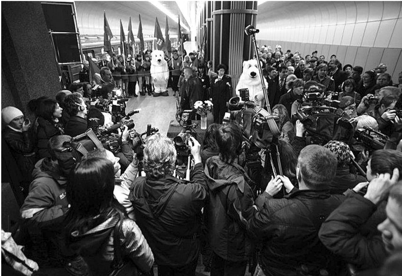
● НА ФОТО: СТАНЦИЮ «ЗОЛОТАЯ НИВА» ОТКРЫЛИ 7 ОКТЯБРЯ 2010 ГОДА В ПРИСУТСТВИИ ПОЛПРЕДА, ГУБЕРНАТОРА, МЭРА И БЕЛЫХ МЕДВЕДЕЙ