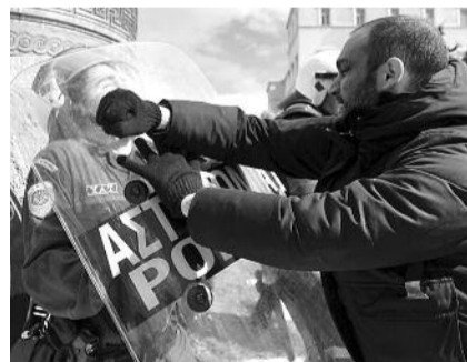
● НА ФОТО: У ЗДАНИЯ ГРЕЧЕСКОГО ПАРЛАМЕНТА В АФИНАХ

Всеобщая забастовка и массовые акции проводятся в Греции в знак протеста против принятия плана 28-миллиардного сокращения бюджетных расходов, повы-