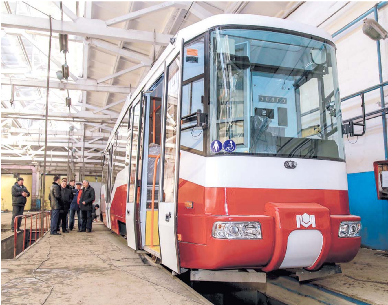
НА ФОТО: ОТ СТАРОГО ТРАМВАЯ ОСТАНУТСЯ ТОЛЬКО КОЛЕСНЫЕ ПАРЫ, ТЯГОВЫЙ ДВИГАТЕЛЬ И БАЛКИ ПОСЛЕ КАПИТАЛЬНОГО РЕМОНТА