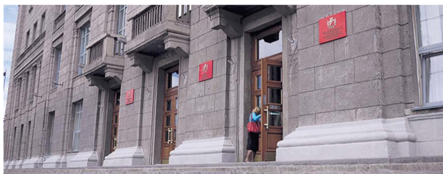
НА ФОТО: ГОРОДСКАЯ ВЛАСТЬ СЛЕДИТ ЗА ИСПОЛНЕНИЕМ НАКАЗОВ ГОРОЖАН