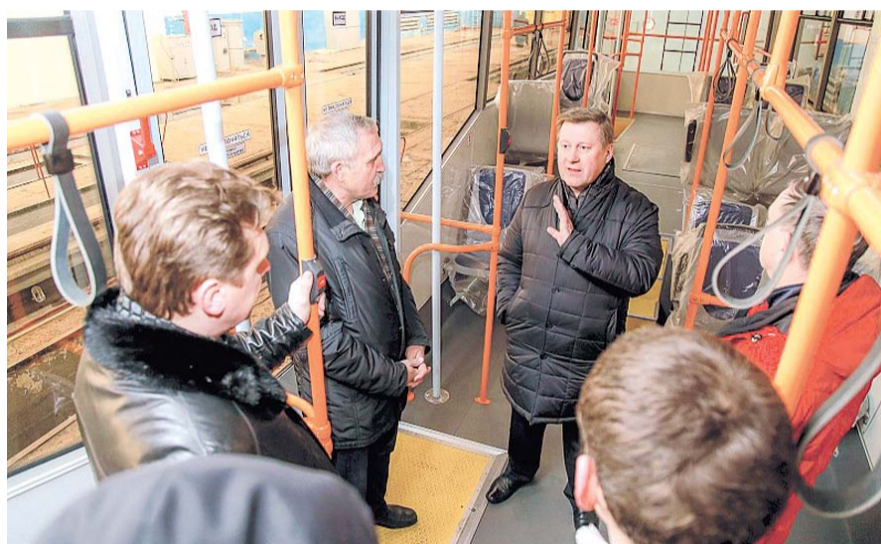
НА ФОТО: СКОРО ПОВЯТСЯ ТРАМВАИ, СДЕЛАНЫЕ В НАШЕМ ГОРОДЕ