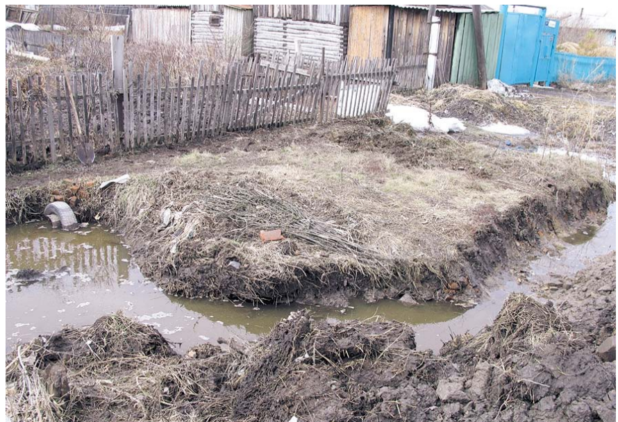
НА ФОТО: КАЖДУЮ ВЕСНУ ЖИТЕЛИ ГУЛЯЕВСКОГО ЖИЛМАССИВА СПАСАЮТСЯ ОТ ПОТОПА