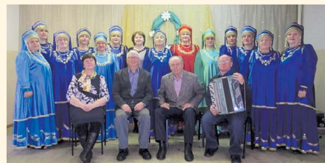
НА ФОТО: САМОДЕЯТЕЛЬНЫЙ КОЛЛЕКТИВ