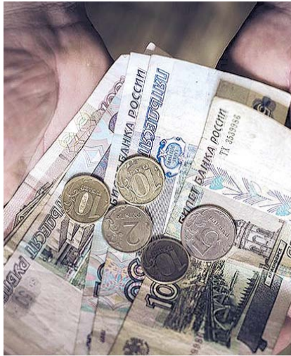
НА ФОТО: РЕАЛЬНЫЕ ДОХОДЫ ПАДАЮТ

Организаторы исследования разделили ответы респондентов по их социальной принадлежности. Выяснилось, что улучшение экономической ситуации заметили от 0,7% работающих в сфере транспорта и ЖКХ до 6,5% представителей силовых структур и 7,1% государственных и муниципальных служащих. Неожиданное улучшение отметили 7,9% работников социальной сферы — образования, здравоохранения, культуры. Но при этом самым популярным ответом остался «Ничего не изменилось». Каждый пятый отметил незначительные ухудшения, толь-