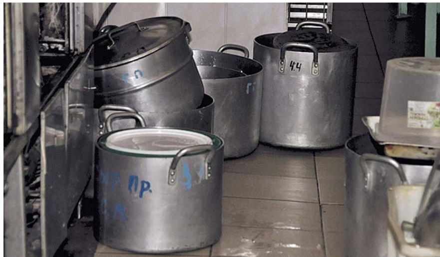
НА ФОТО: НУЖНО УЖЕСТОЧАТЬ КОНТРОЛЬ САНИТАРНОГО СОСТОЯНИЯ ПИЩЕБЛОКОВ